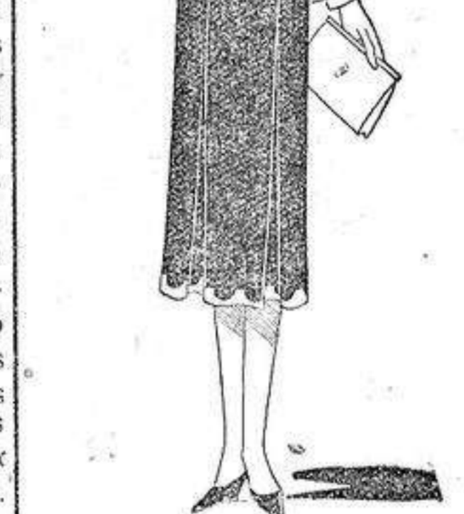
Conjunto de tussor verde hilo, sobre una blusa de crepé blanco.

SE OFRECE joven para trabajar por las tardes en un despacho conociendo contabilidad y mecanografía.