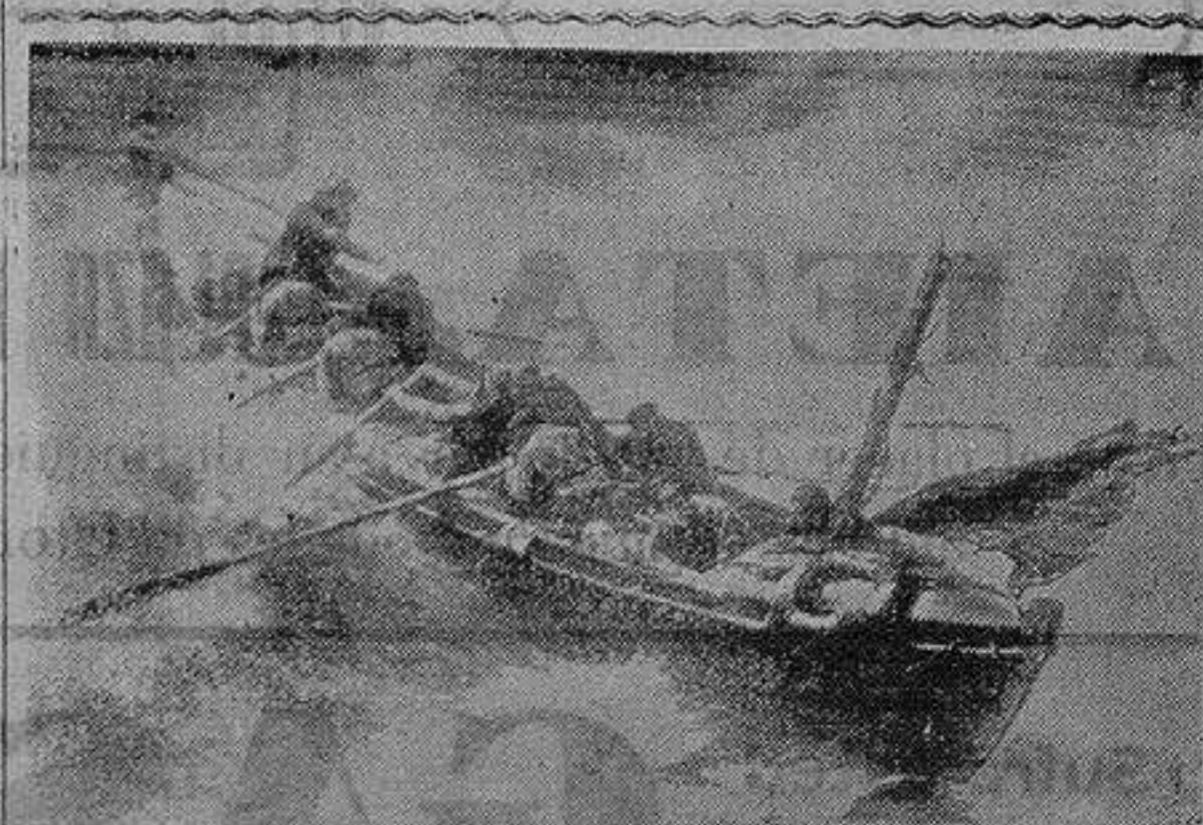
La Compagnie Europe.—Francia.—En el canal de la Mancha. Bote salvavidas dirigiéndose a prestar auxilio a un barco en peligro.