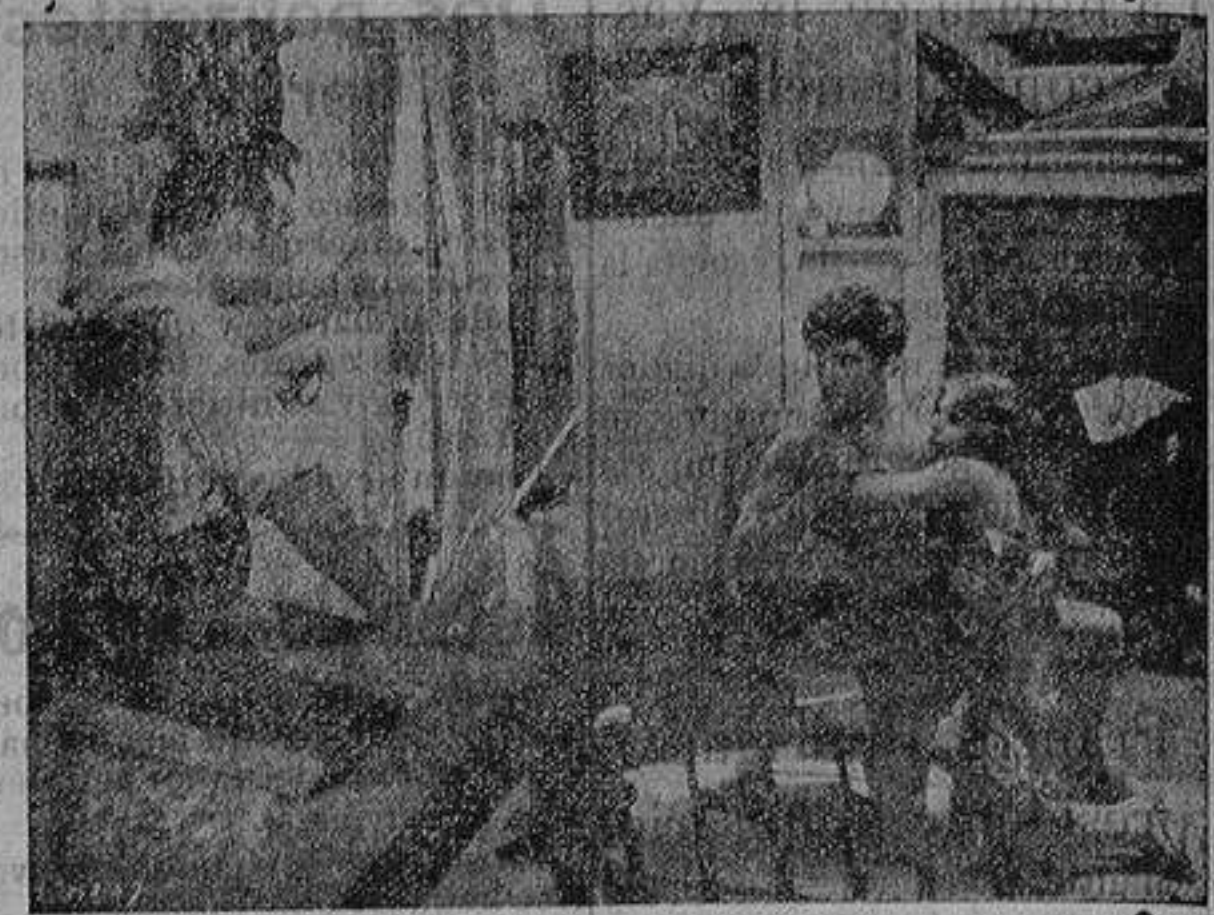
«EL PAGANO DE TAHITI»

—«Bull Dog Drummond» primera película parlante de Ronald Col-