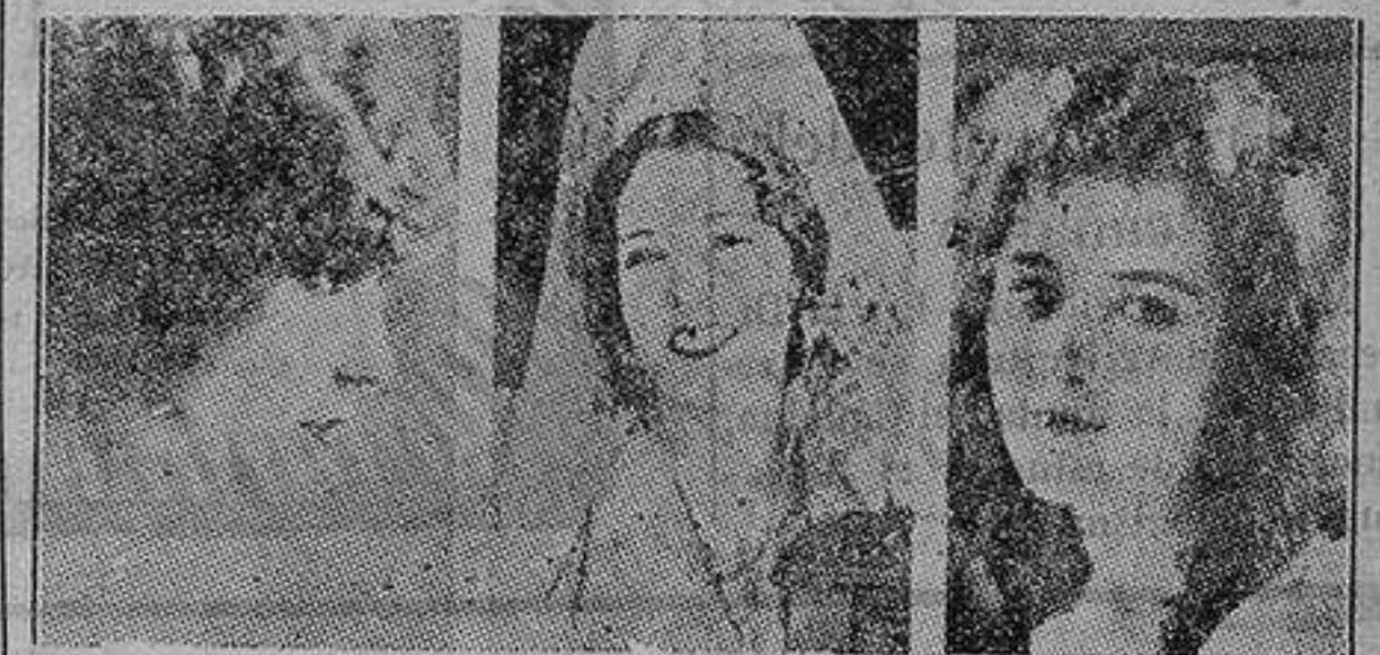
Un trío de artistas conocidas Mary Philbin, Lupe Vélez y Gilda Gray, tres famosas estrellas de Los Artistas Asociados