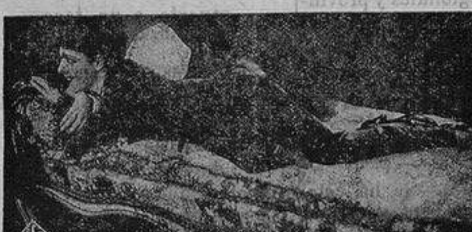
La bellísima SUZY VERNON en «CASTIGO» de la U. F. A.