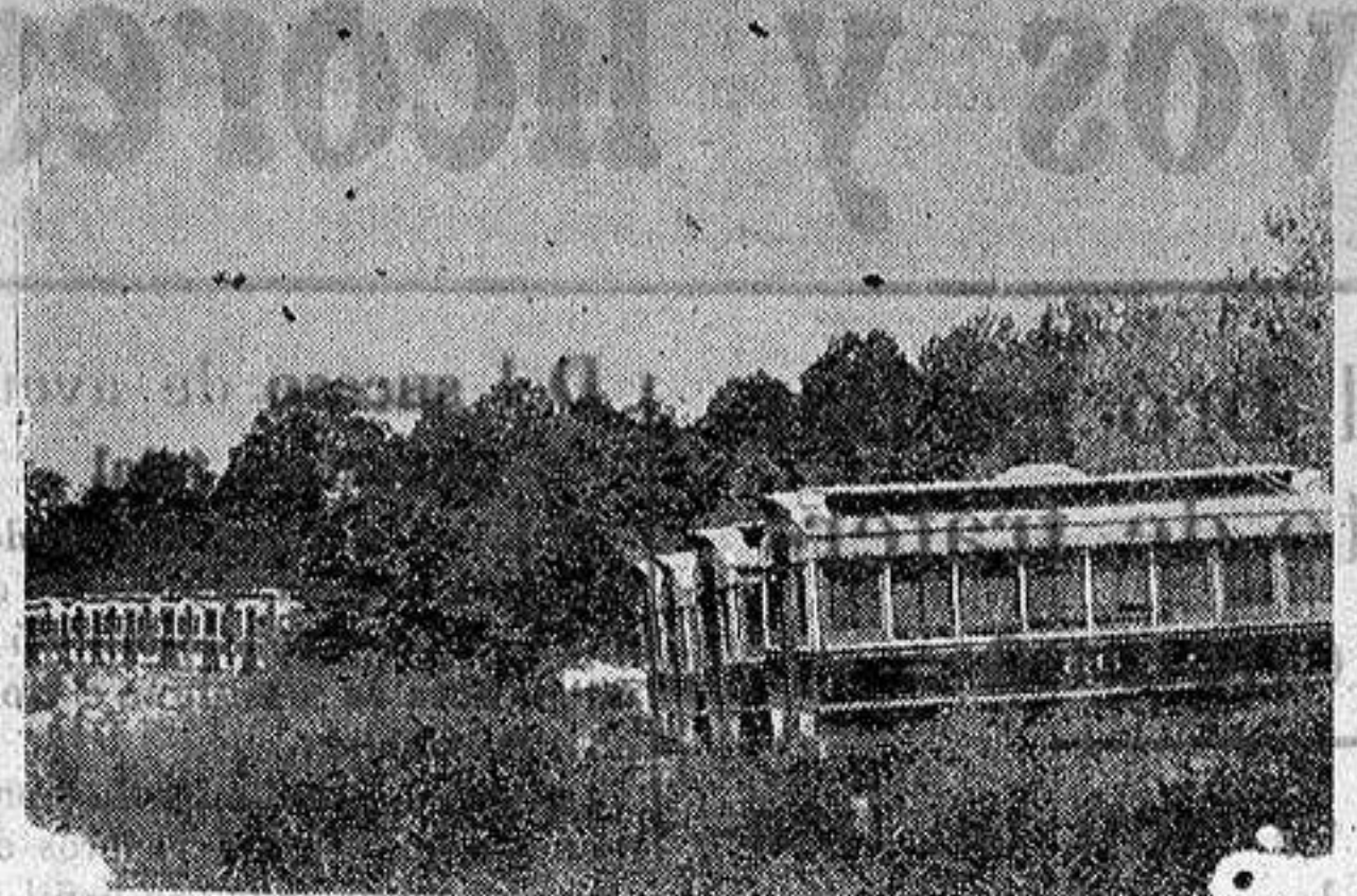
En los Estados Unidos algunos particulares han adquirido viejos vagones del metropolitano neoyorquino, transformándolos en residencias veraniegas.

De Alicante a Valencia (Por Villajoyosa, Benisa, Gandía y Sueca. Combinado para Pego y Denia). Servicio diario por nuevos y cómodos coches, ofreciéndose a los viajeros los bellos panoramas de la Marina, de la huerta gandiense y de la Ribera. Administración en Alicante: P. Santísima Faz (antes Progreso), 5.