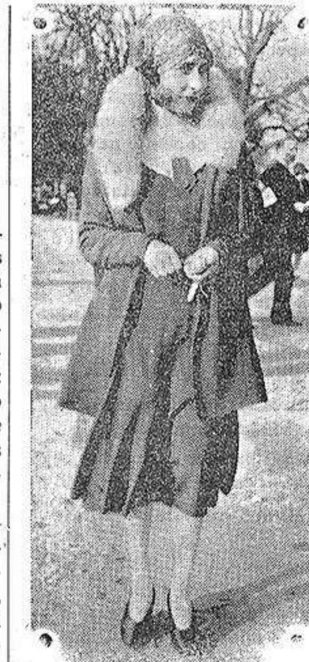
París.— Modelos exhibidos en el pesaje de Auteuil.—Conjunto de crepé de China, vestido y manteau tres cuartos.

Unicamente en aquellos países como Francia e Inglaterra, donde los gobiernos están en todo instante sometidos al Parlamento que los hace y deshace a capricho, sin que el jefe de Estado tenga otra intervención que acatar las resoluciones parlamentarias y proponer a las Cámaras un nuevo ministerio para sustituir al caído, cabe postular la irresponsabilidad de la primera magistratura. Irresponsabilidad condicionada, naturalmente, por su respeto a la Constitución, pues si la viola, la jefatura del Estado deja automáticamente a su vez de ser indiscutible e inviolable. A veces ni siquiera es necesario que la viole, sino que basta la más leve intención de extralimitarse para que la opinión pública fuerce al jefe de Estado a dimitir, como le ocurrió a Millerand en Francia. ¿Cómo serían posibles estas salvaguardias de la Constitución si no se pudieran discutir y en caso necesario enjuiciar los actos y aun las