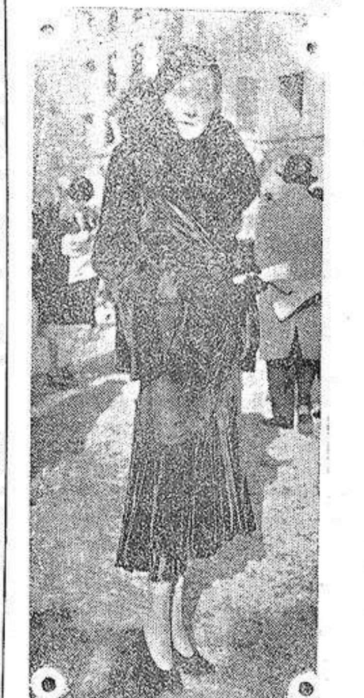
París.— En las carreras de caballos de Auteuil.— Elegante manteau de terciopelo musulmana, adornado.