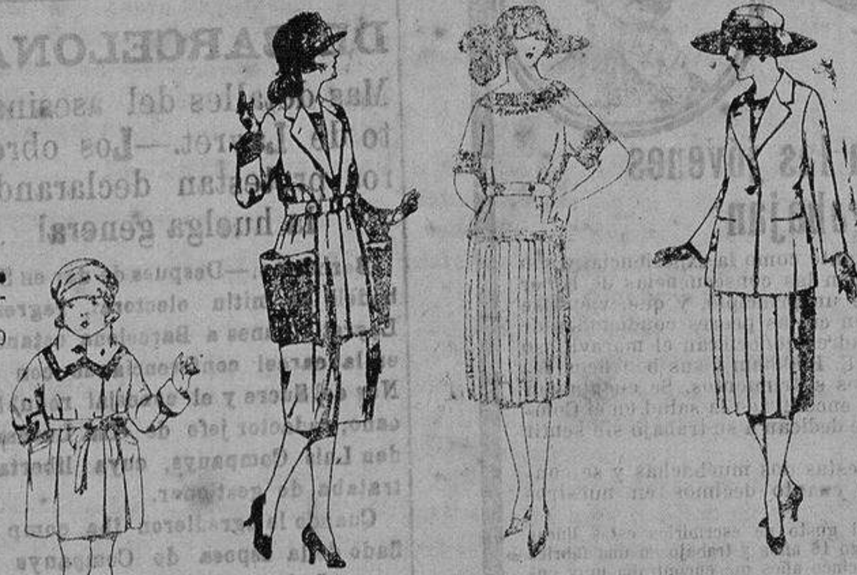
Trajes gabardina, lana, lana, sarga inglesa, etc. azul y color, adornos bordados. de ptas. 100 a 130 Vestidos de sarga inglesa, estambre, on nilla, sarga inglesa, etc. azul y color, adornos bordados. de ptas. 65 a 90 Trajes de lanilla, sarga, etc. en azul y color. de ptas. 90 a 120