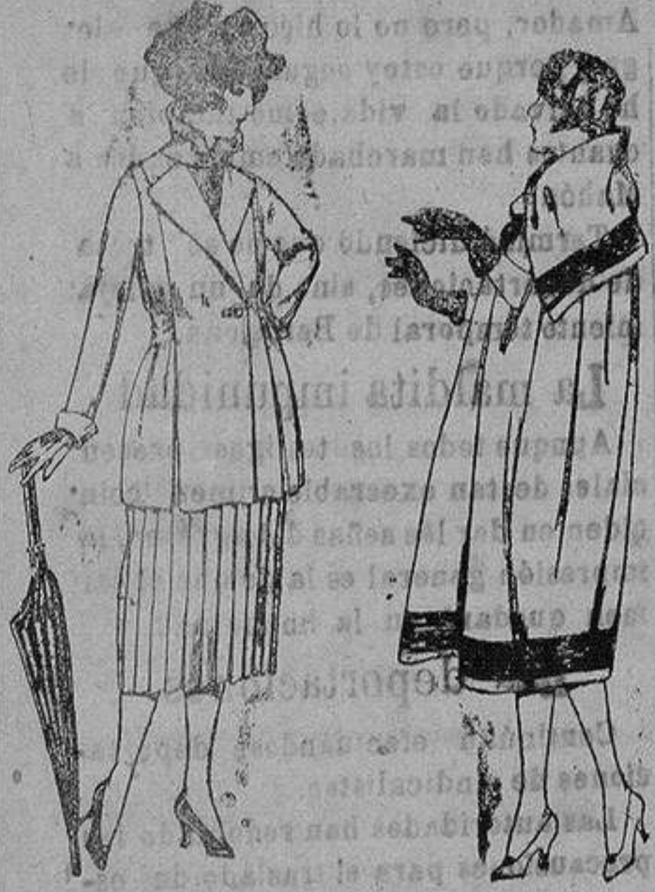
Trajes de gabardina, lana, lana, estambre, etc. en negro azul y color. de ptas. 130 a 165 Capas de gabardina inglesa, diferentes colores, pespunte de adorno. de ptas. 180 a 160

Princesa, 2 :: Alicante :: Victoria, 1 Sucursales: Madrid, Barcelona, Almeria, Bilbao, Cádiz, Cartagena, Gijón, Granada, Málaga, Palma de Mallorca, Santander, Sevilla, Valencia, Valladolid, Zaragoza