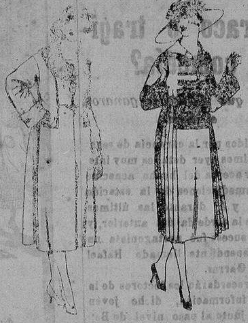
Abrigos de gamuza, pañete, en negro, azul y color, adornos y terciopelo negro. de ptas. 120 a 150 Vestido de sarga inglesa, lanilla, etc., en negro, azul y color, adornos bordados. de ptas. 100 a 140