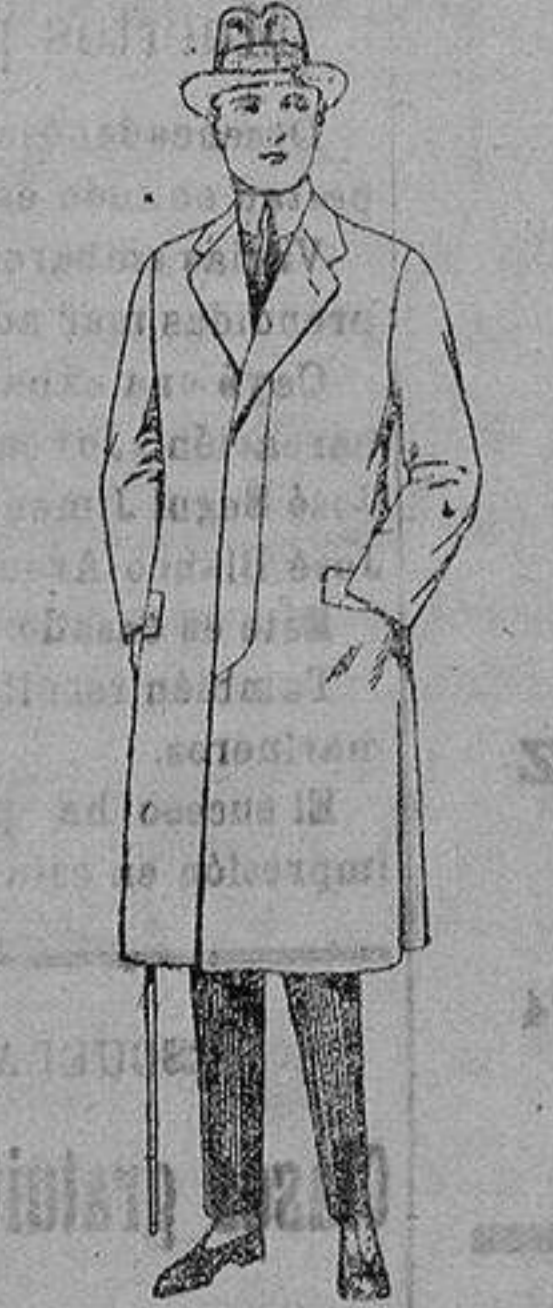
Gabanes de melltón, gabardina, etc. de ptas. 70 a 175