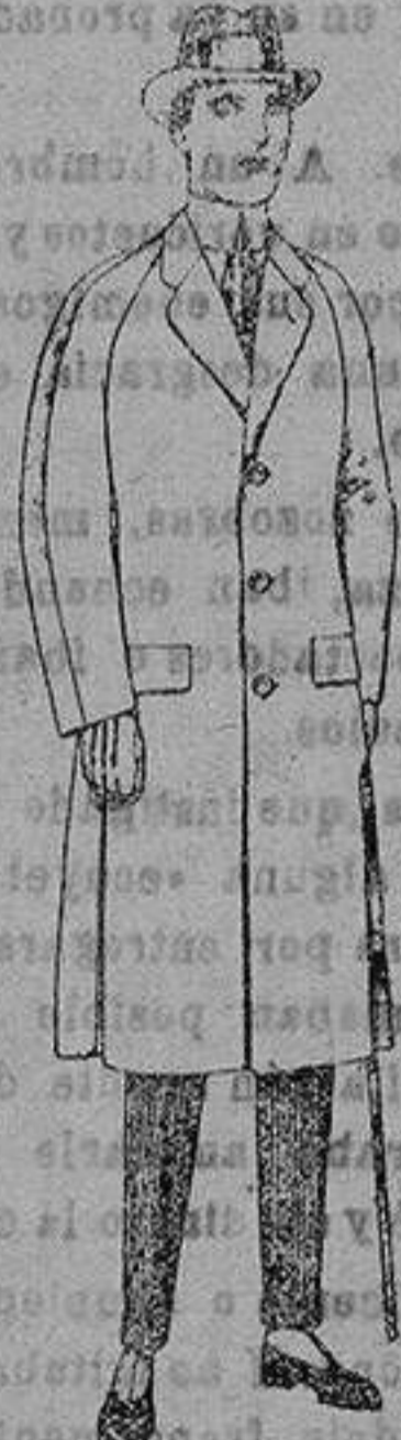
Gabanes de patén, meloncha cheviot, con forro de satén e escoces. de ptas. 62 a 165.

Ropas confeccionadas para Caballero, Señora, Niños y Niñas Peletería, Camisería, Géneros de punto, Corbatería, Guantería, Sombrerería, Zapatería, Paraguas, Bastones y Artículos de Viaje