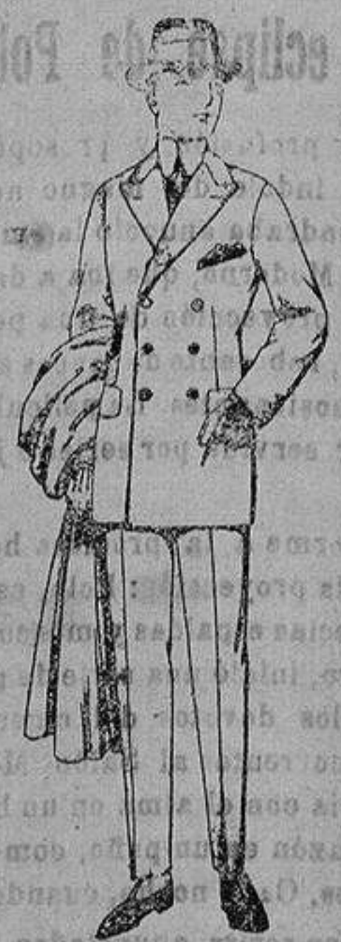
Trajes de cheviot, melltón, vicuña o jerga. de ptas. 55 a 190.