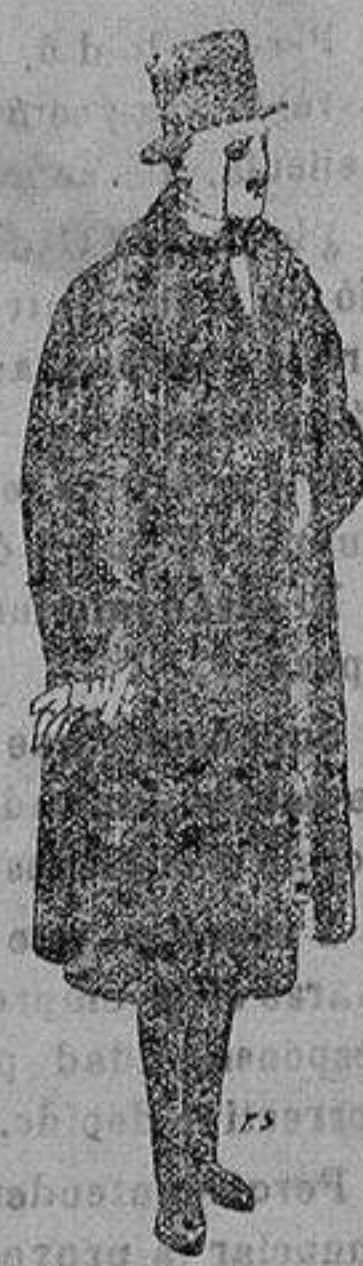
Gabanes de edredón negro, con cuello vistas de piel. de ptas. 220 a 250.