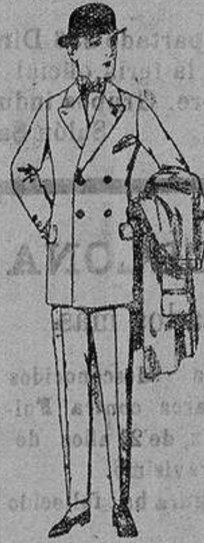
Trajes de patén, vicuña, etc para niños de 10 a 12 años, de ptas. 39 a 86. Los mismos para jovencitos de 13 a 16 años, de ptas. 42 a 87.