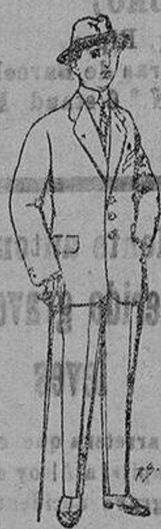
Trajes de patén, vicuña o jerga, para niños de 10 a 12 años, de ptas. 37 a 83. Los mismos para jovencitos de 13 a 16 años, de ptas. 40 a 85