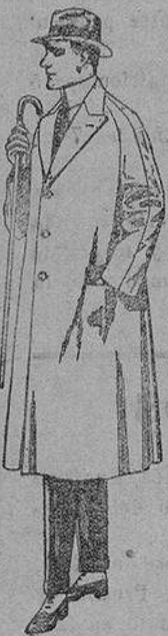
Gabanes de cheviot, gamuén, etc. de ptas. 55 a 60.