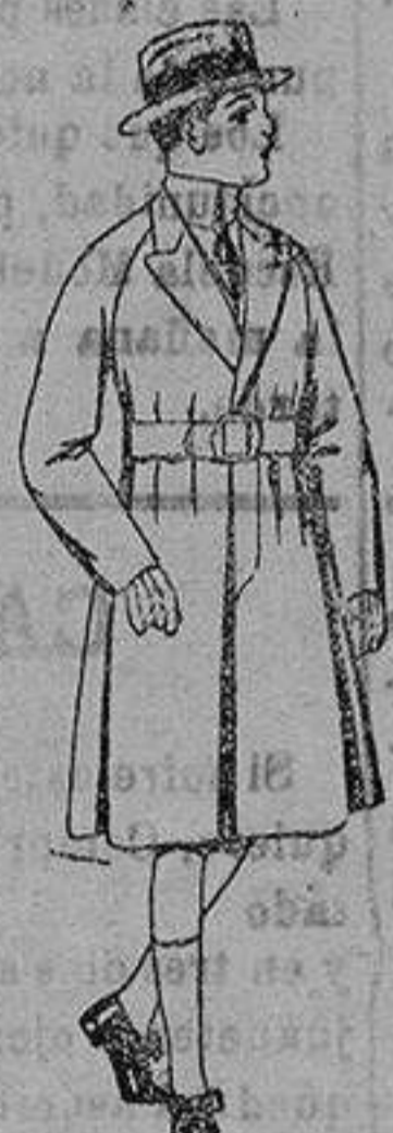
Gabanes de patén, para niños de 4 a 9 años, de ptas. 30 a 52.