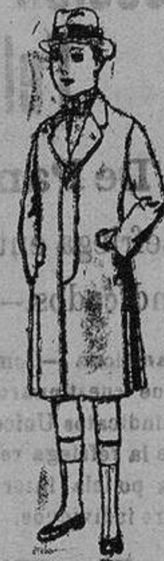
Gabanes de patén, para niños de 10 a 12 años, de ptas. 85 a 42.