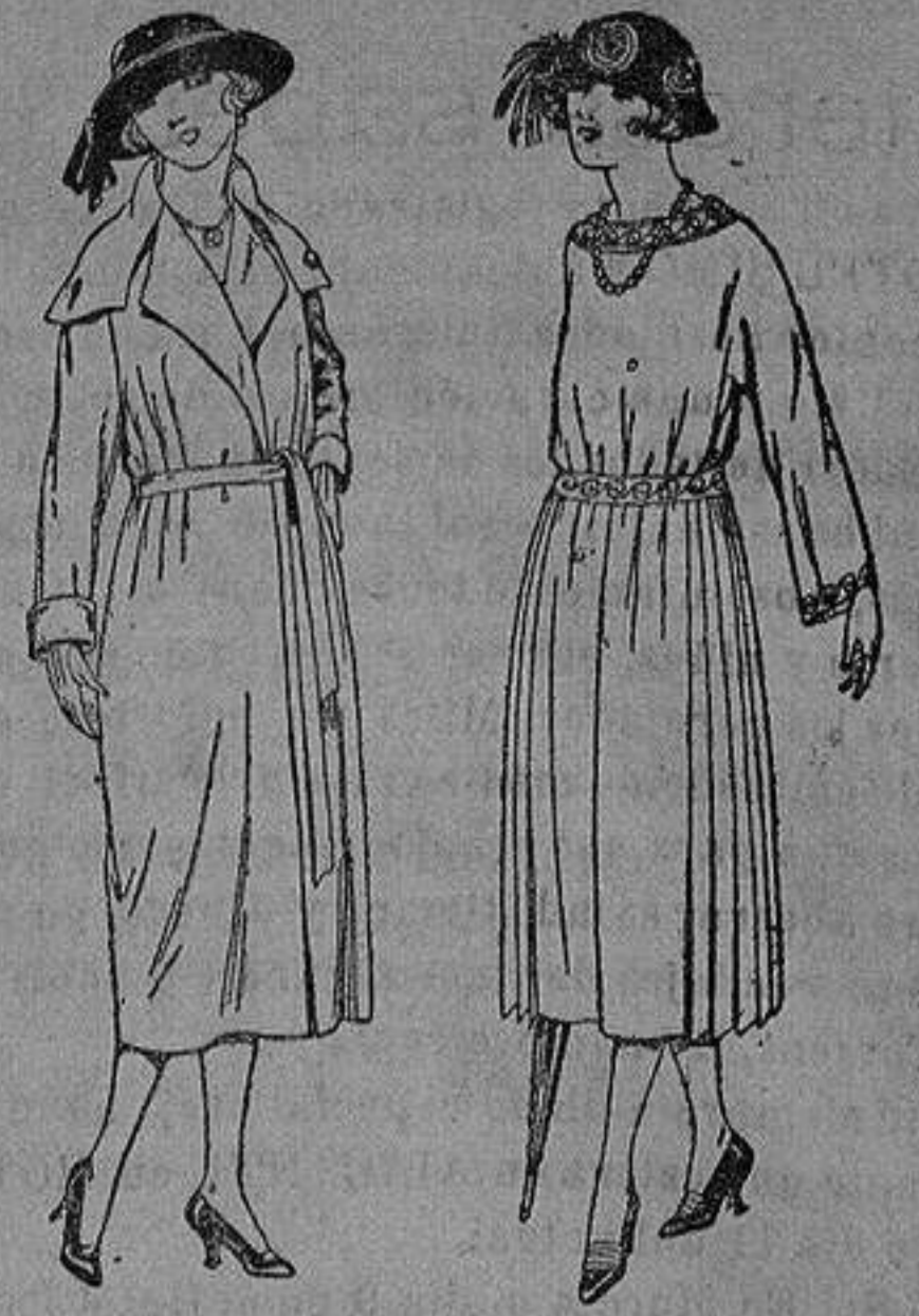
Abrigos de gamuza, cheviot, etc., en negro, azul y co.or. de ptas 50 a 100