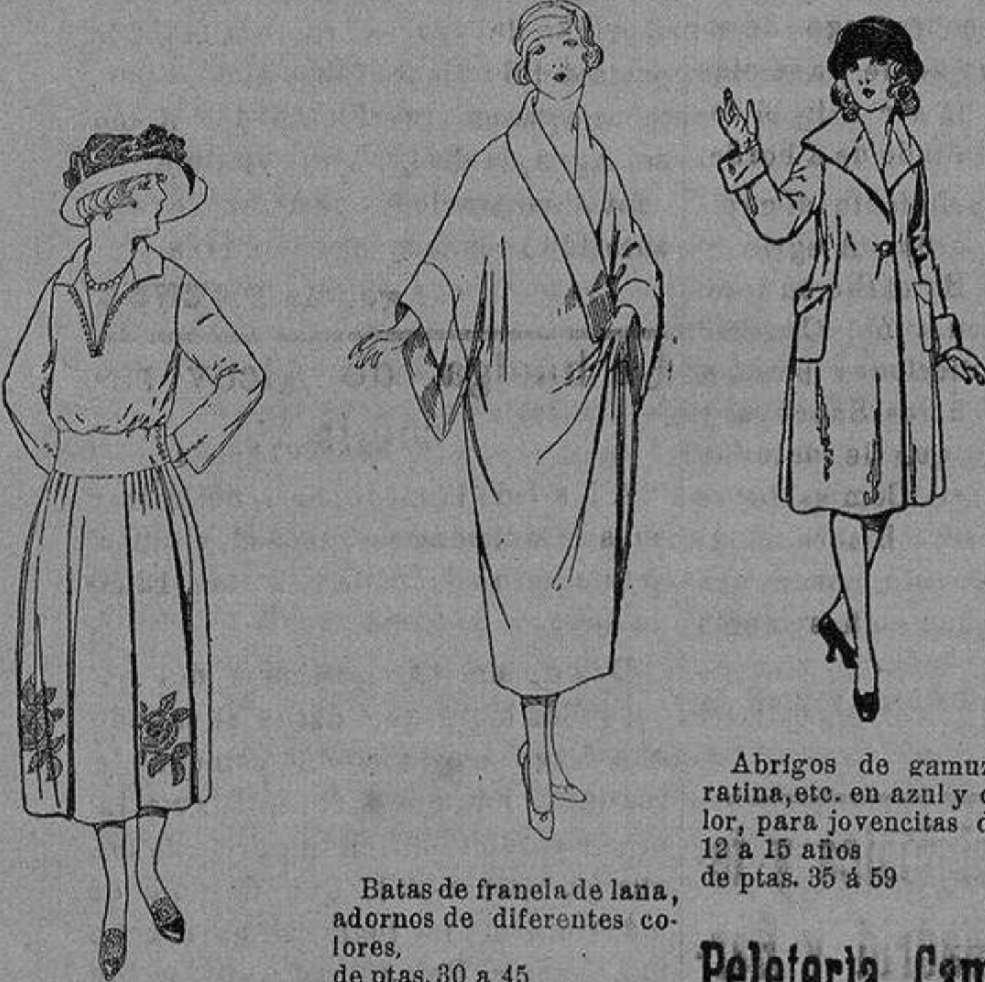
Abrigos de gamuza ratina, etc. en azul y color, para jovencitas de 12 a 15 años, de ptas. 35 a 59