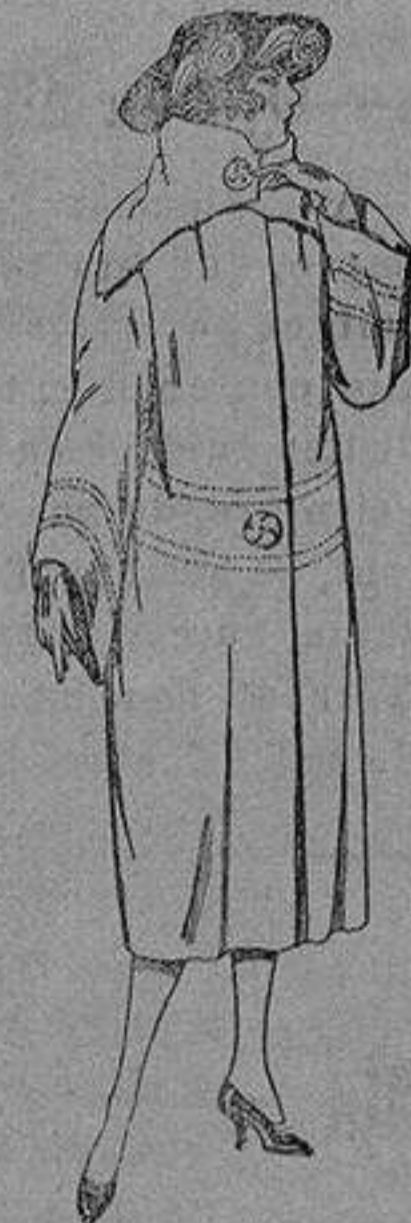
Abrigos de terciopelo de lana, ratina, etc., en negro, azul y color, adornos respunte seda de ptas. 120 a 200