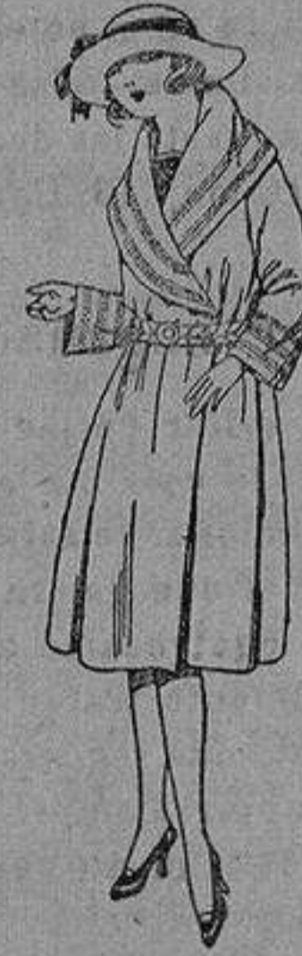
Abrigos de terciopelo de lana, gamuza, etc., en negro, azul y color, para jovencitas de 12 a 15 años, de ptas. 55 a 95