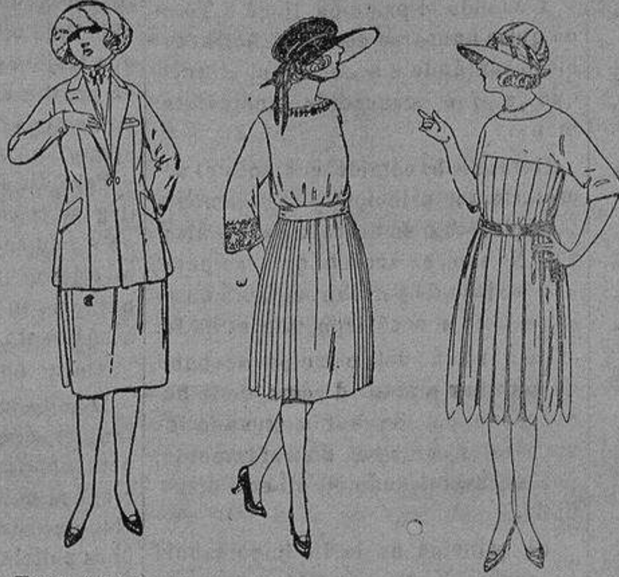
Trajes de sarga inglesa, gabardina etc, en azul y color, de ptas. 85 a 100