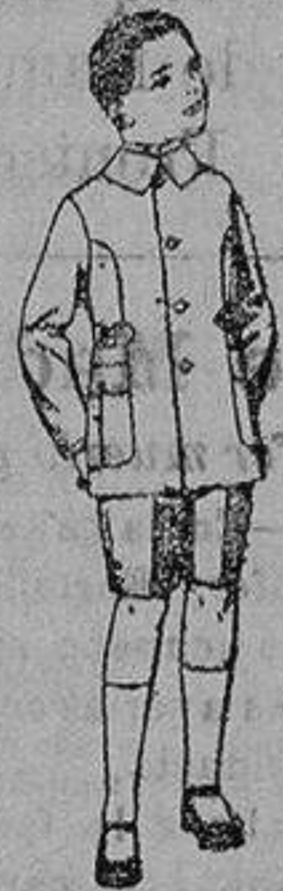
Trajes modelo «Sport», de lanilla, estambre, melton, etc., para niños de 9 a 4 años de ptas. 30 a 48 Trajes de dril liso o listado. de ptas. 9 a 18