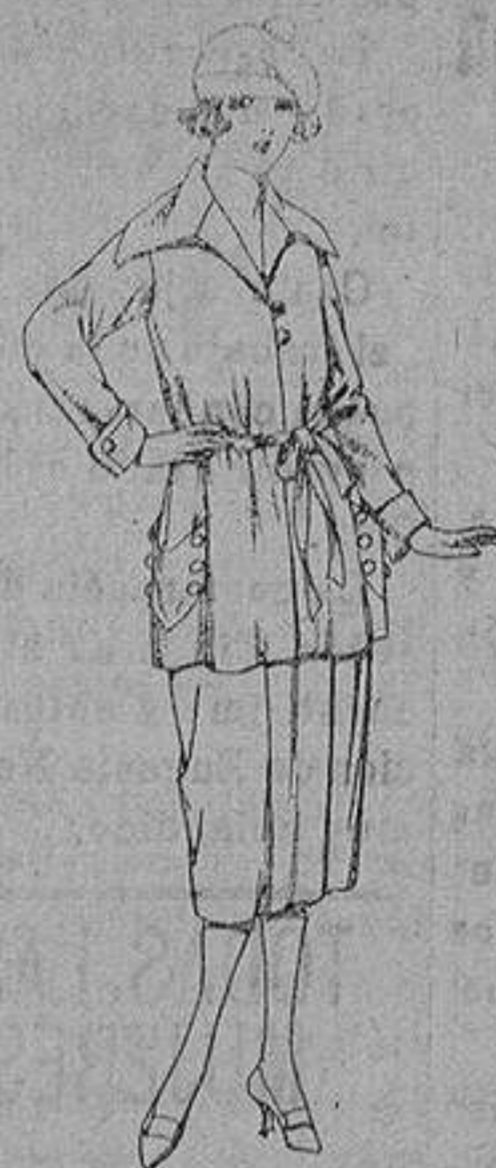
Vesidos de punto de seda, en negro, azul y color. de ptas. 180 a 230