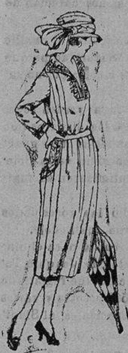
Vestidos gabardina, sarga inglesa, etc., en negro azul y color adornos bordados. de ptas. 110 a 130

PRECIO FIJO :: VENTAS AL CONTADO PÍDASE CATALOGO GENERAL