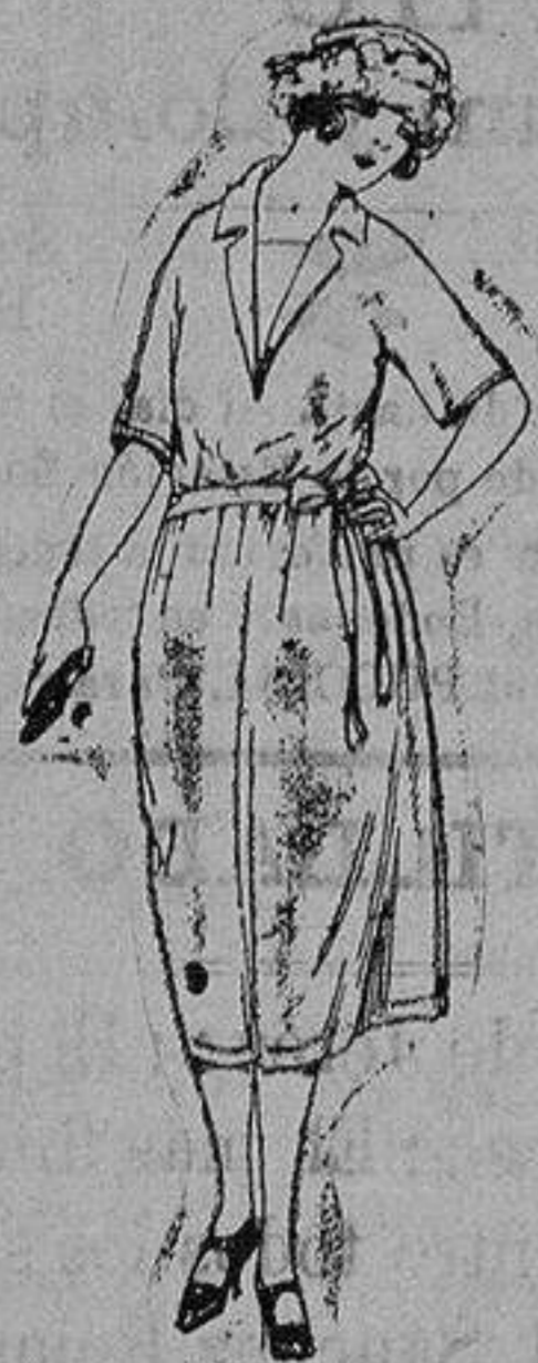
Trajes de sarga inglesa, estambre, etc., negro, azul color, de ptas. 180 a 188