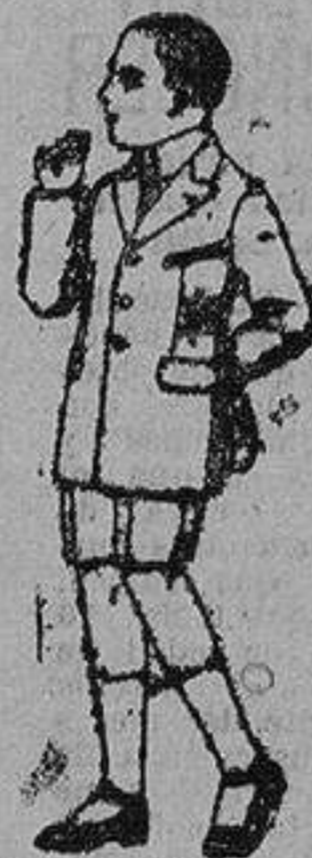
Trajes modelo Sport, lanilla, estambre, etc., para niños 7 a 12 años de 28 ptas a 50 Trajes delantal de aril crudo o kaki, para niños de 3 a 7 años. de ptas. 9 a 15

Ropas confeccionadas para Caballero, Señora, Niño y Niña