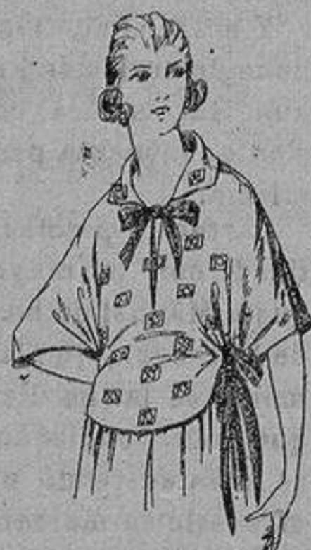
Blusas crespón de seda, voile y etamin estampado de ptas 4 a 25