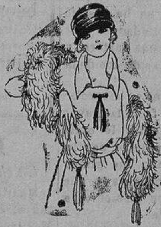
Boas de plumas avestruz, gran variedad en colores y tamaños de ptas 15 a 125 Gran surtido en capelitas de marabú de ptas. 30 a 70.