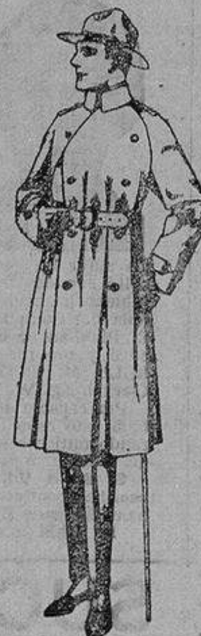
Gabanes impermeabilizados con cinturón «American renh coat». de ptas. 200 a 350