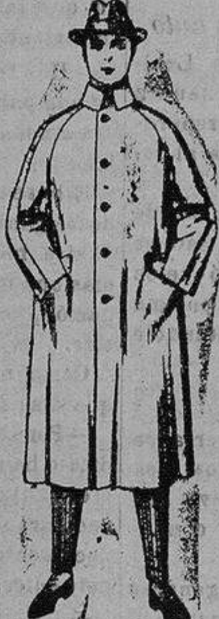
Gabanes de patén, cheviot o wer. de ptas. 80 a 160