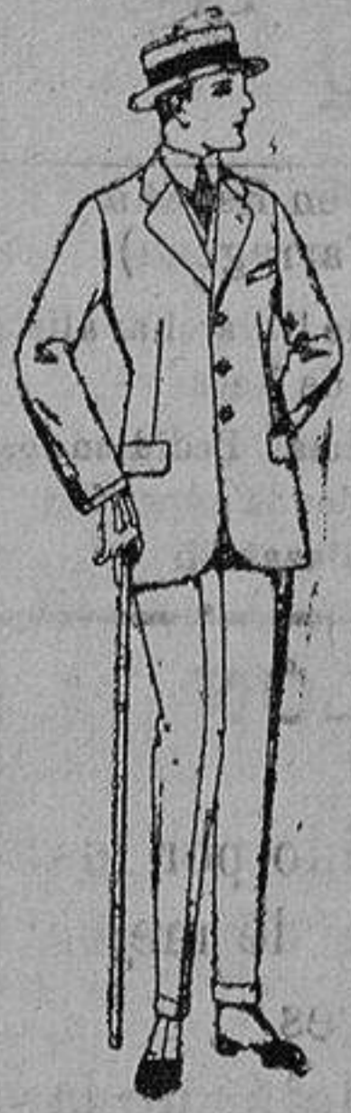
Trajes de lanilla melton, estambre, vicuña o jerga. de ptas. 38 a 130

Sucursales: Madrid, Barcelona, Almeria, Bilbao, Cádiz, Cartagena, Gijón, Granada, Málaga, Palma de Mallorca, Santander, Sevilla, Valencia, Valladolid, Zaragoza