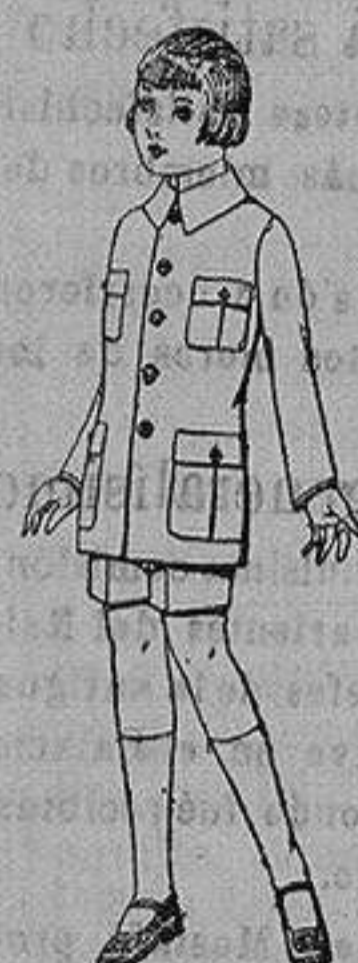
Trajes de pa-tén modelo Sport, para niños de 4 a 9 años. de ptas. 22 a 35.