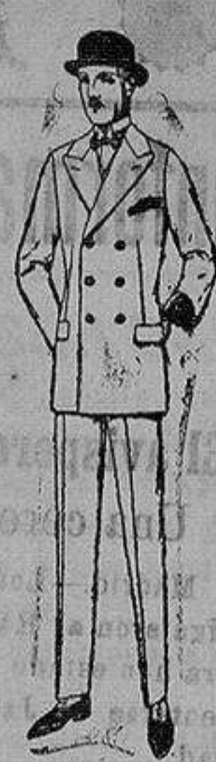
Trajes de mel-tón, cheviot, es-tambre, vicuña o jerga. de ptas. 50 a 175.