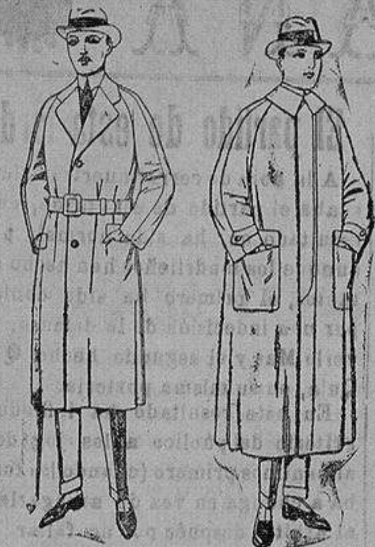
Gabanes raglán de patén, gamuza o co-wer. de ptas. 75 a 200

Sucursales: Madrid, Barcelona, Almeria, Bilbao, Cadiz, Cartagena, Gijón, Granada, Málaga, Palma de Mallorca, Santander, Sevilla, Valencia, Valladolid, Zaragoza