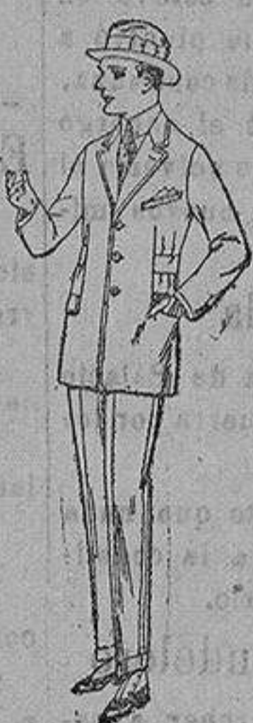
Trajes de patén, vi-cuña o jerga forma Sport, para niños y jovencitos de 10 a 16 años. de ptas. 40 a 85.