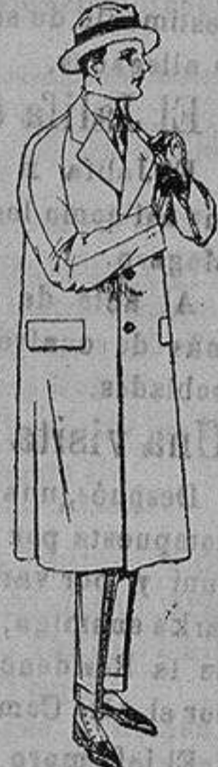
Gabanes raglán de patén, mel-tón, cheviot, con forro de seda o satén. de ptas. 60 a 160

Ropas confeccionadas para Caballero, Señora, Niño y Niña