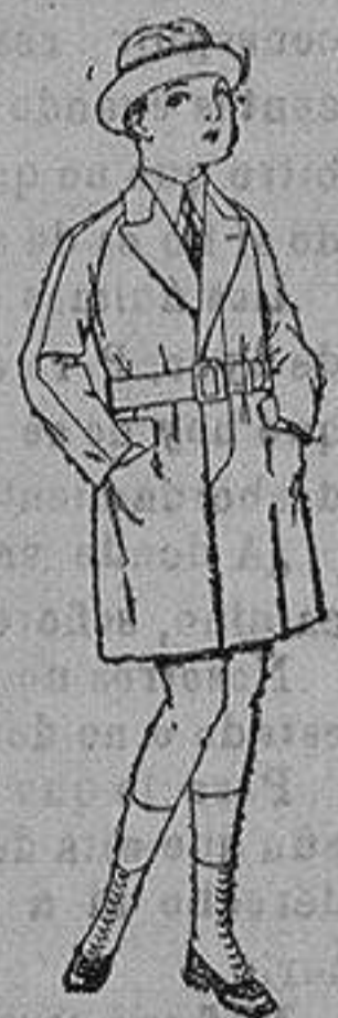
Gabanes de patén gamuza, etc. para niños y jovencitos de 10 a 16 años. de ptas. 30 a 7