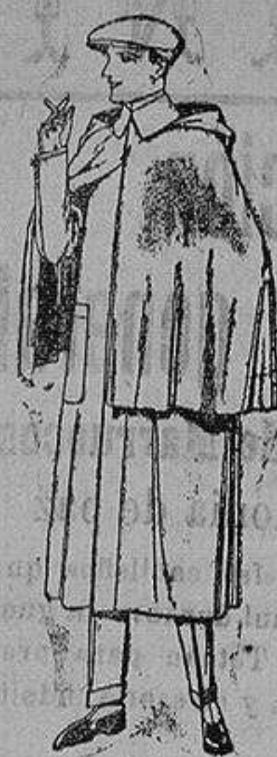
Impermeables mack-ferland en negro y azul de ptas. 85 a 157