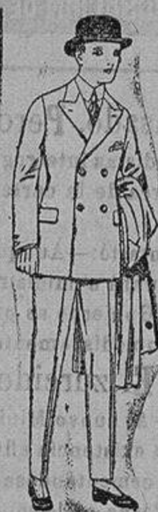
Trajes de patén, vi-cuña etc. para niños y jovencitos de 10 a 16 años. de ptas. 32 a 55.