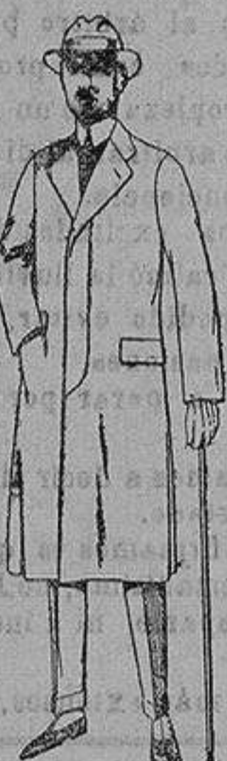
Gabanes de cheviot gamuza o patén etcétera. de ptas. 45 a 140.