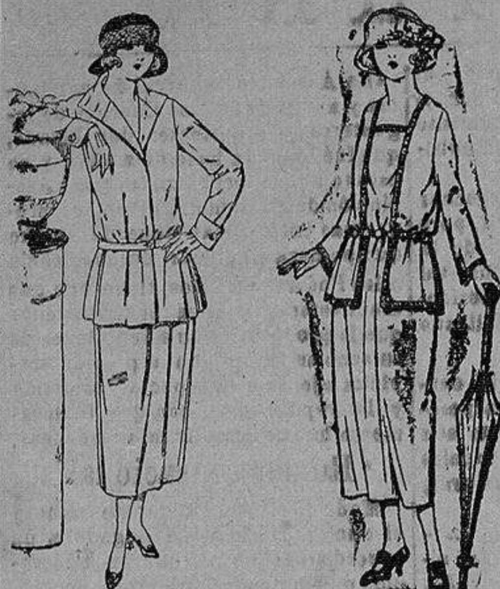
Traje sastre de estambre gabardina, etc., chaqueta forrada de seda, en negro marino y colores moda. de ptas. 115 a 145

Sucursales: Madrid, Barcelona, Almeria, Bilbao, Cadiz, Cartagena, Gijón, Granada, Málaga, Palma de Mallorca, Santander, Sevilla, Valencia, Valladolid, Zaragoza