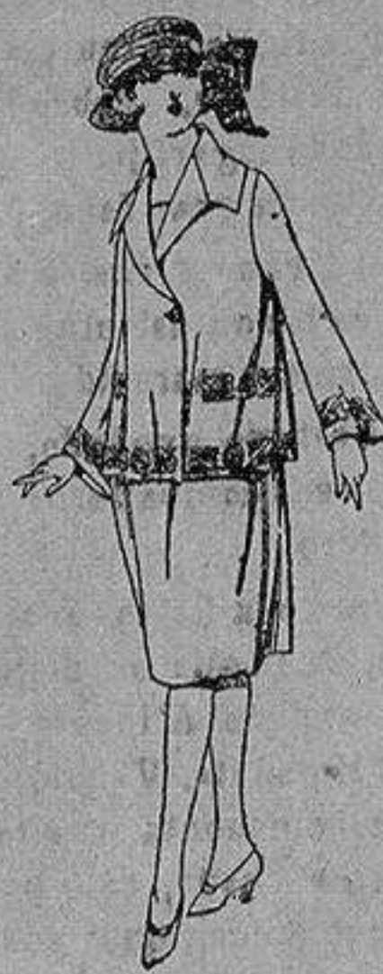
Vestido gabardina sarga inglesa etc. en azul y color, adornos bordados para jovencitas de 13 a 15 años de ptas. 93 a 100