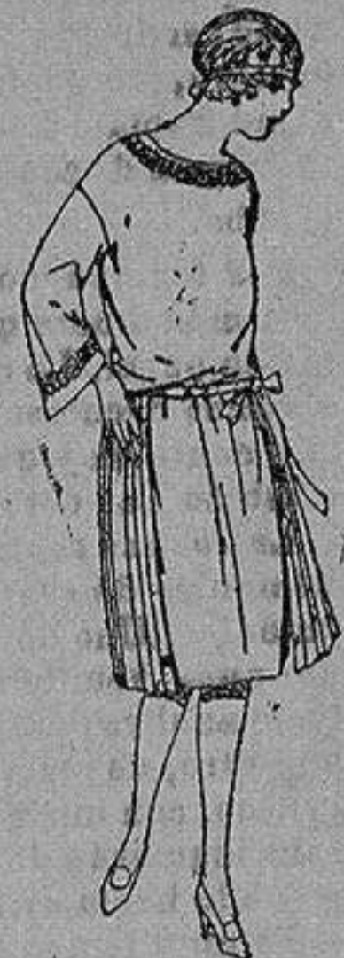
Vestidos de papeline, sarga, etc., en azul y color adornos bordados para jovencitas de 13 a 15 años. de ptas. 60 a 78