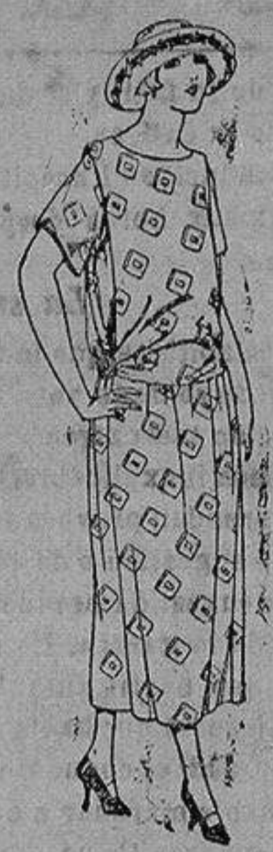
Vestido de foulard de algodón dibujo fantasía. de ptas. 35 a 50