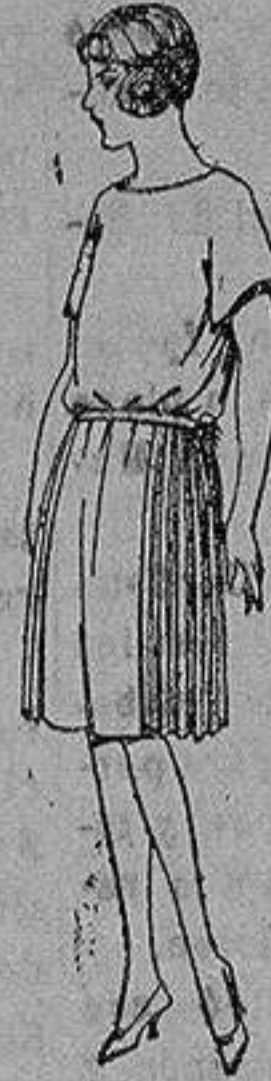
Vestido sarga inglesa gabardina, etc., en azul y color, adorno de pespuntes seda. de ptas. 55 a 110