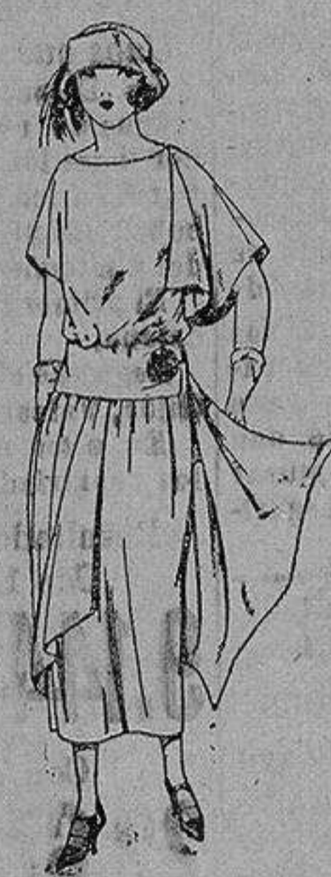
Vestido de crespón de china, en negro, azul y colores moda, adornos bebillas de metal. de ptas. 135 a 160