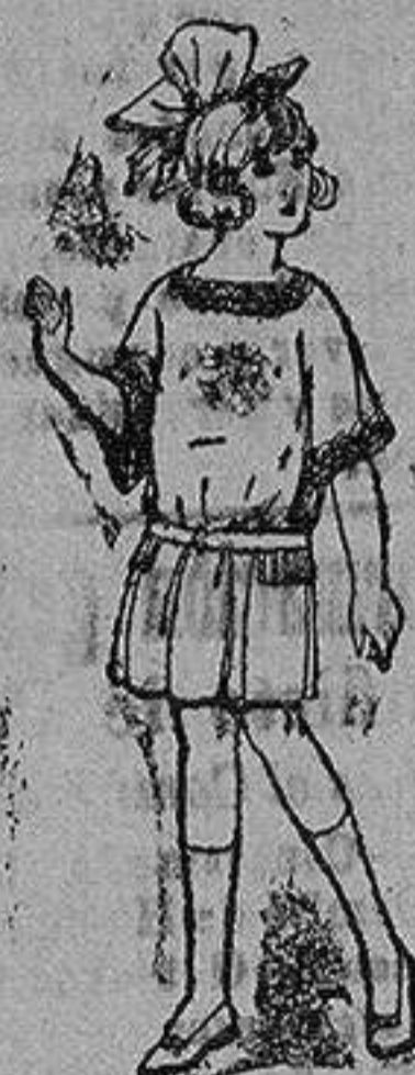
Vestido de sarga popelina inglesa, en azul y colores moda, para niñas de 4 a 9 años. de ptas. 38 a 38

Ropas confeccionadas para Caballero, Señora, Niño y Niña