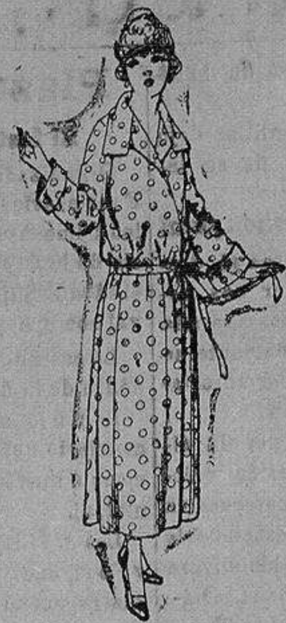
Batas de percal, voile listado, etcétera. de ptas. 16 a