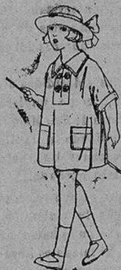
Vestidos de batista blanca, adornos bordados, para niñas de 2 a 6 años de ptas. 6 a 8

Boas, Camisería, Géneros de punto, Corbatería, Guantería, Sombrerería, Zapatería, Paraguas, Bastones y Artículos de Viaje