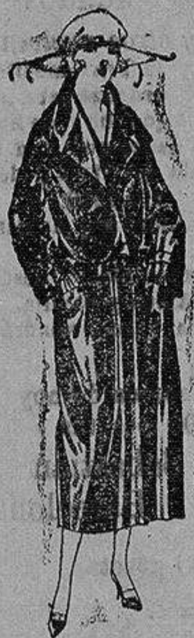
Abrijo de seda impermeables, en negro, azul y color. de ptas. 130 a 225