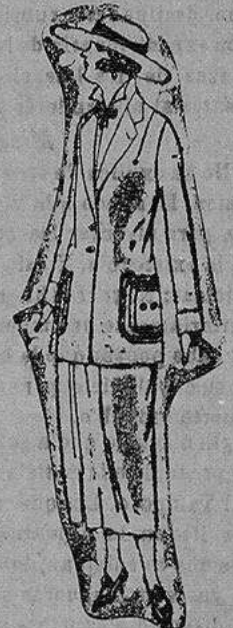
Trajes sastre de popelina gabardina etc., adorno y pespuntes seda, chaqueta forrada de seda en negro, marrón decolores moda. de ptas. 120 a 140.