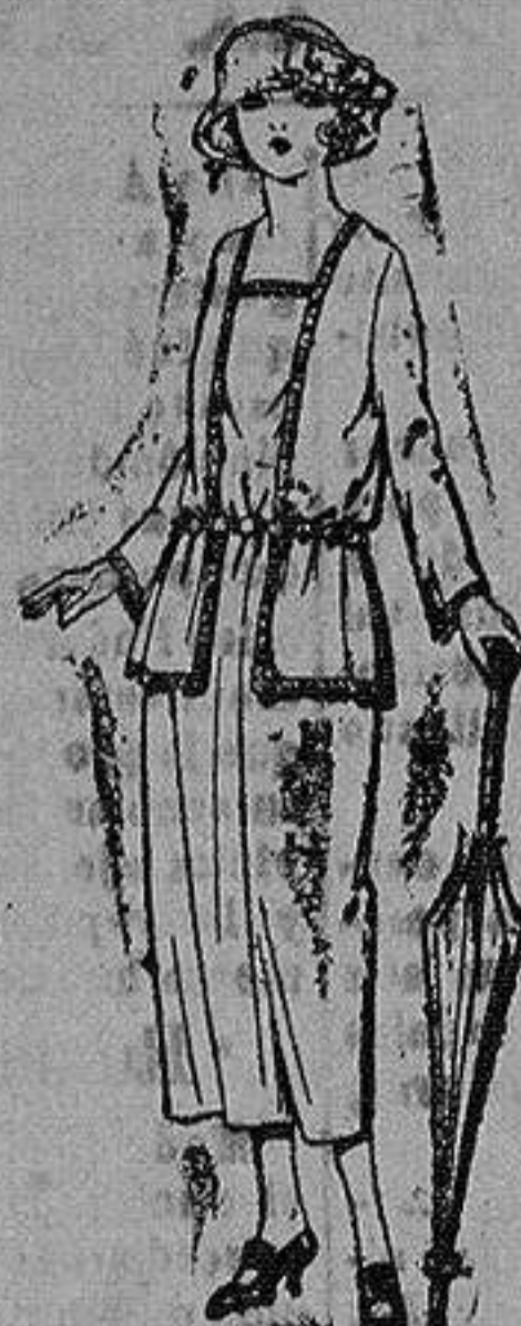
Vestido de gabardino, sarga inglesa etc., en negro, azul y color, adornos cinta seda. de ptas. 63 a 90