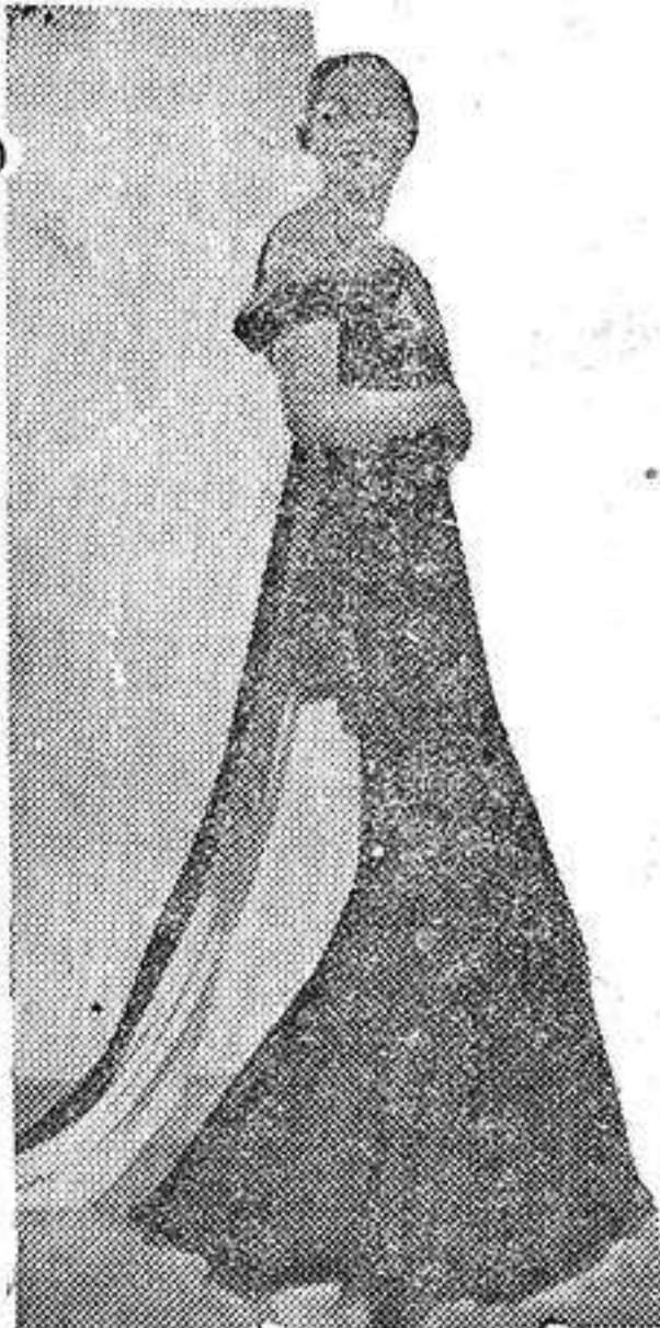
LA MODA FEMENINA

—Me extraña más esa actitud del señor Largo Caballero porque, como saben ustedes, su oficio es el de empapelador y, la verdad, debería tener costumbre de conocer los malos papeles.