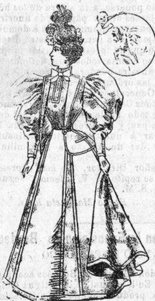
Traje para paseo.

De vicuña azul marino; chaqueta corte sastré; con bieses del mismo género en las costuras, solapas y todo alrededor. Al final de las solapas van dos botones; bolsillos tambien con bieses; cuerpo ajustado, con sus botones en el delantero y una pata del mismo género con bieses; cuello alto con corbat; mangas de una pieza con un bies en el centro de la misma y otro en la bocamanga; falda forma campana con cuatro bieses en el delantero y otro en el bajo.