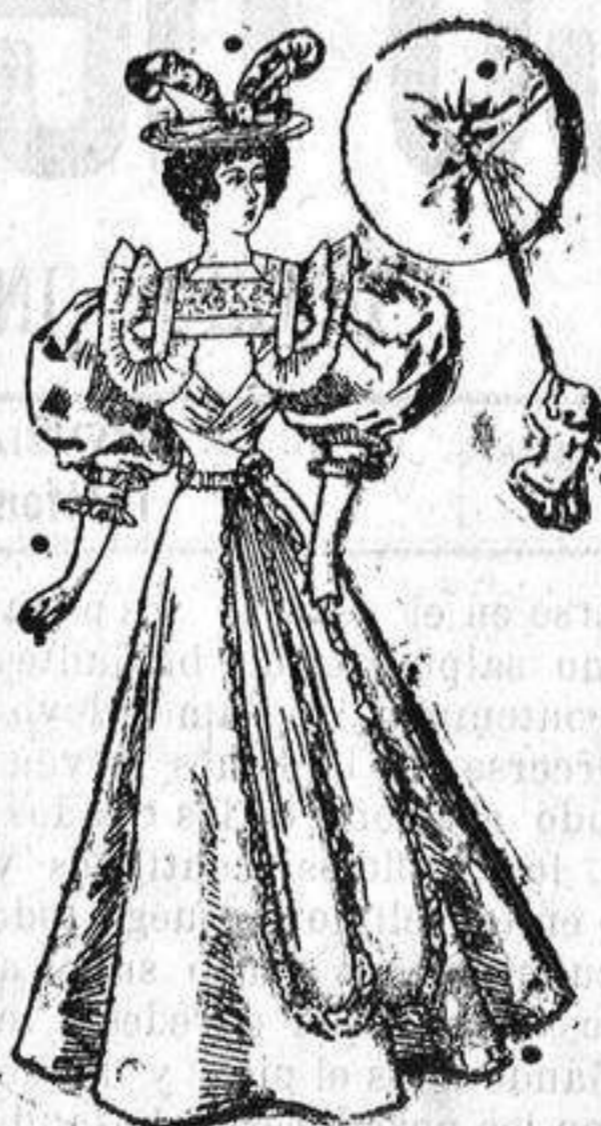
Otro traje para visita.

el delantero con un entredós; gran cuello del mismo género y tres entredores con una cinta y un chous en los hombros; cuello alto de cinta con una lazada detrás. Cinturon de goma con una bonita hebilla; manga corta forma globo y falda lisa forma campana.