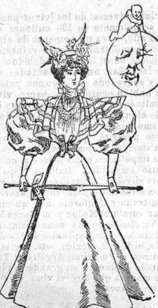
Traje para visita.

De vicuña azul marino; chaqueta corte sastré; con bieses del mismo género en las costuras, solapas y todo alrededor. Al final de las solapas van dos botones; bolsillos tambien con bieses; cuerpo ajustado, con sus botones en el delantero y una pata del mismo género con bieses; cuello alto con corbat; mangas de una pieza con un bies en el centro de la misma y otro en la bocamanga; falda forma campana con cuatro bieses en el delantero y otro en el bajo.