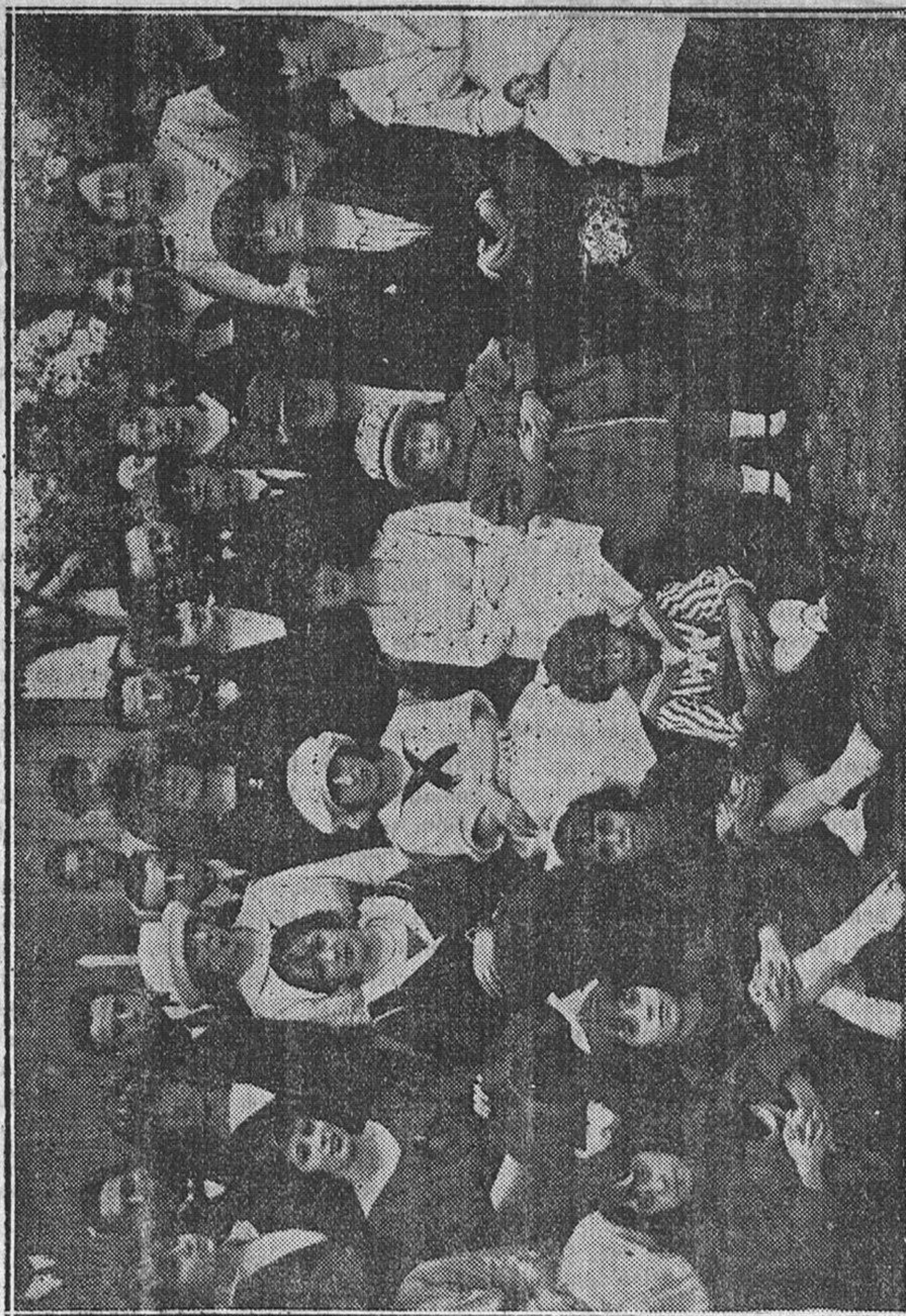
Un grupo interesante de algunas de las concurrentes.