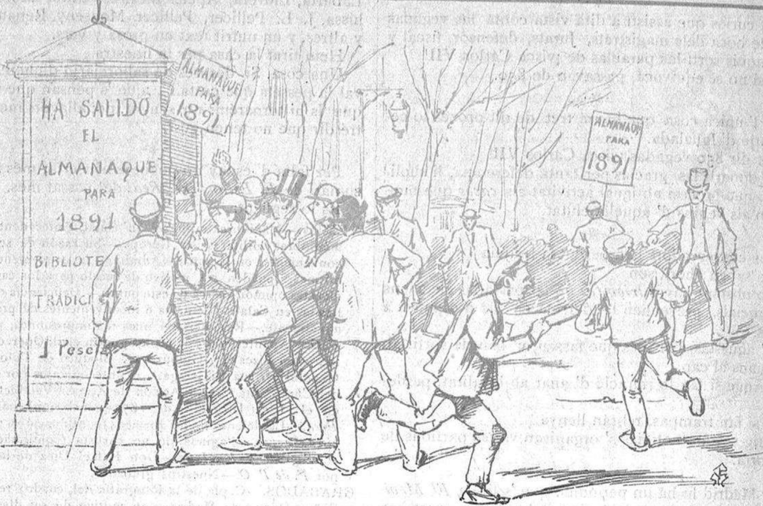
—Esperintset ja n' hi haurá per tots.