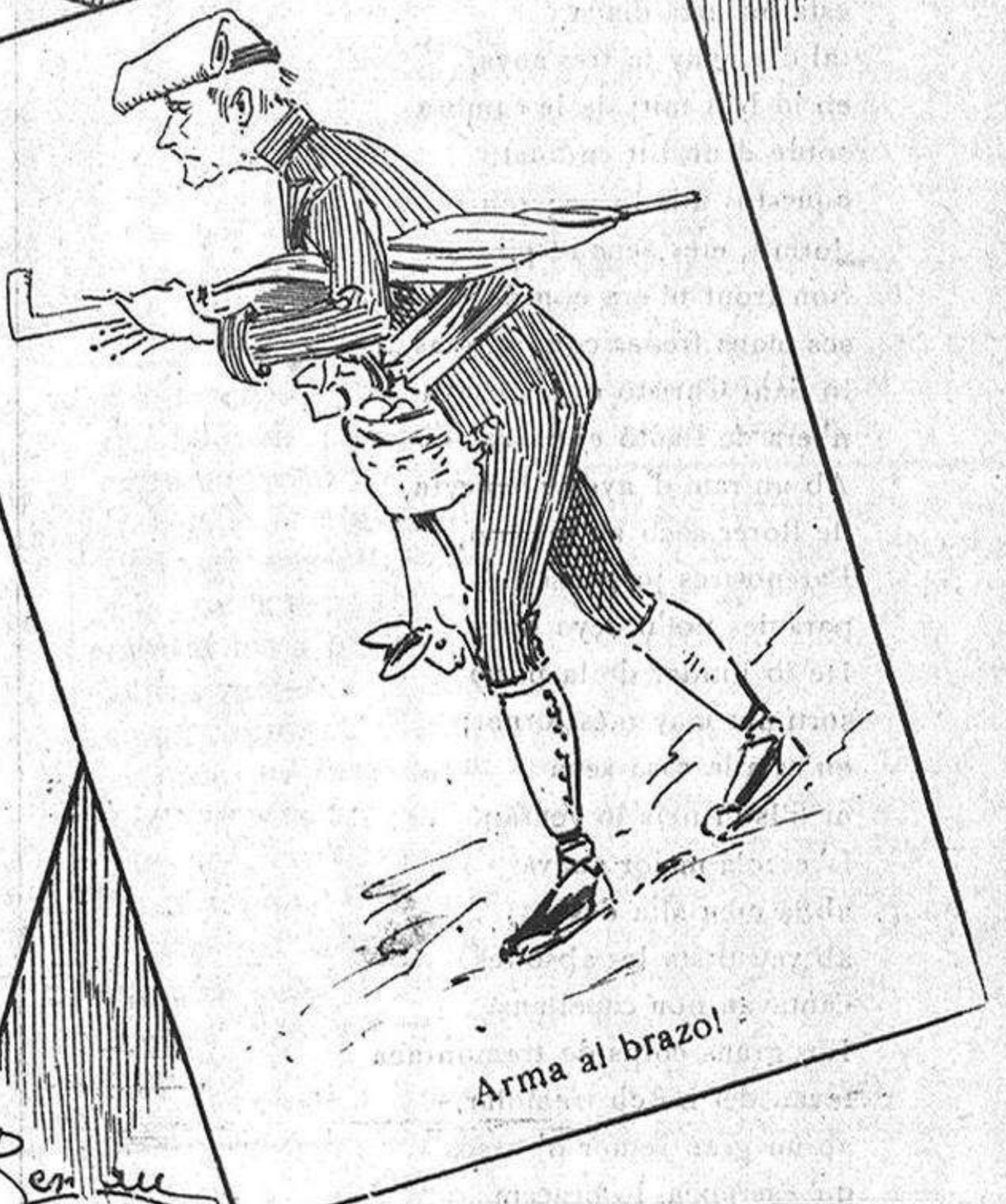
Arma al brazol