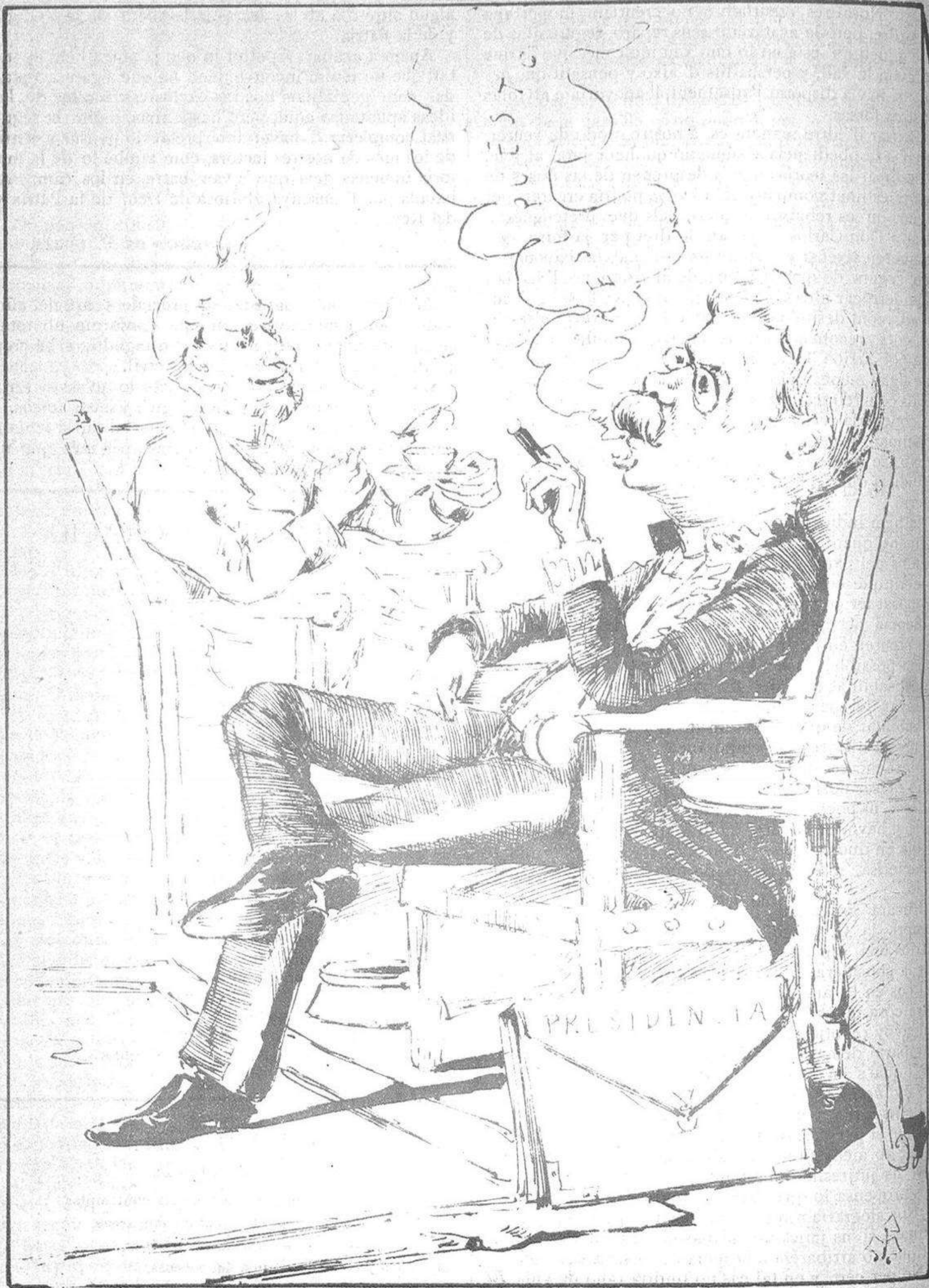
Pels polítichs trapassés un mon d' alegrías es;