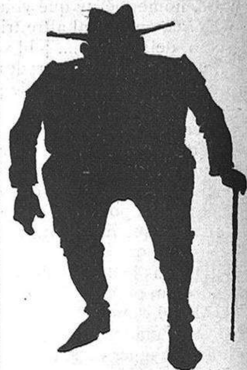
Es una excelent persona, amich que sou d' Espartero y ara 'l primer colillero dels cafés de Barcelona.