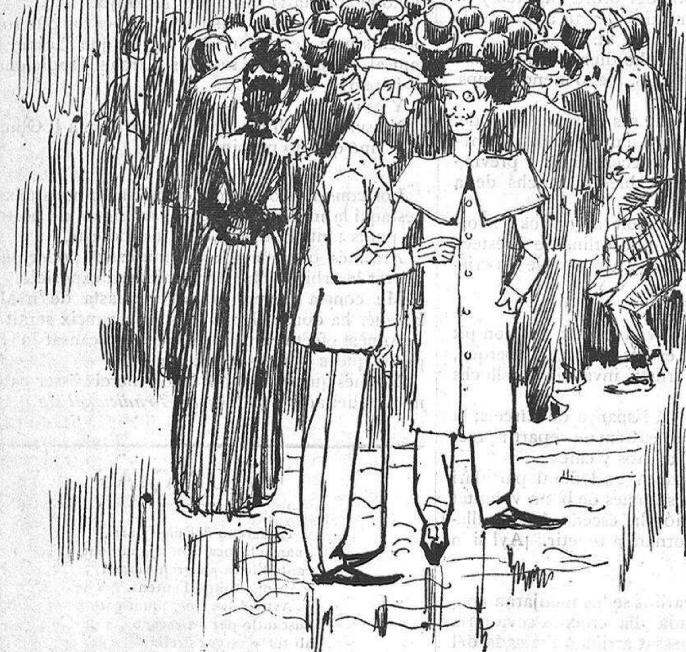
(En lo carrer de Fernando). Dos gomosos al veurer lo retrato de Don Carlos: —¡Vaya quin tipo, no porta pan y toros ni 'l bigoti engomat!