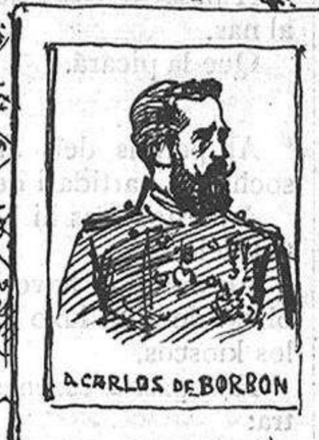
D. CARLOS DE BORBÓN