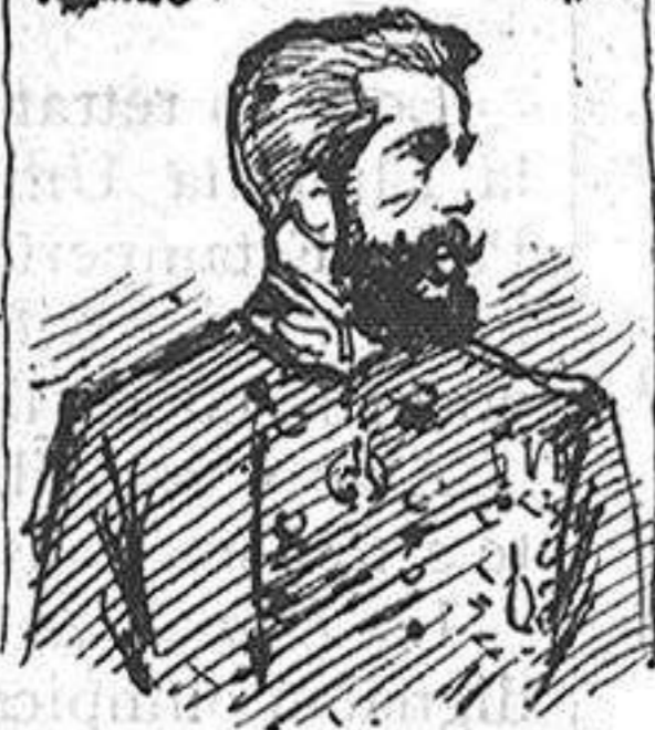
D. CARLOS DE BORBÓN