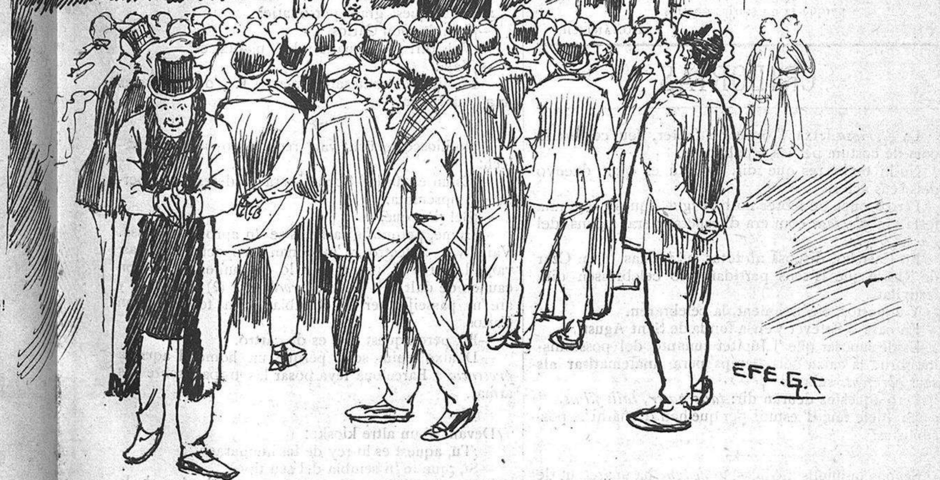
(Devant los kioskos).—¡Quina barra la dels carlins!— ¡Això 'ls liberals no ho deuriem consentir!—¡Visca 'l Rey!