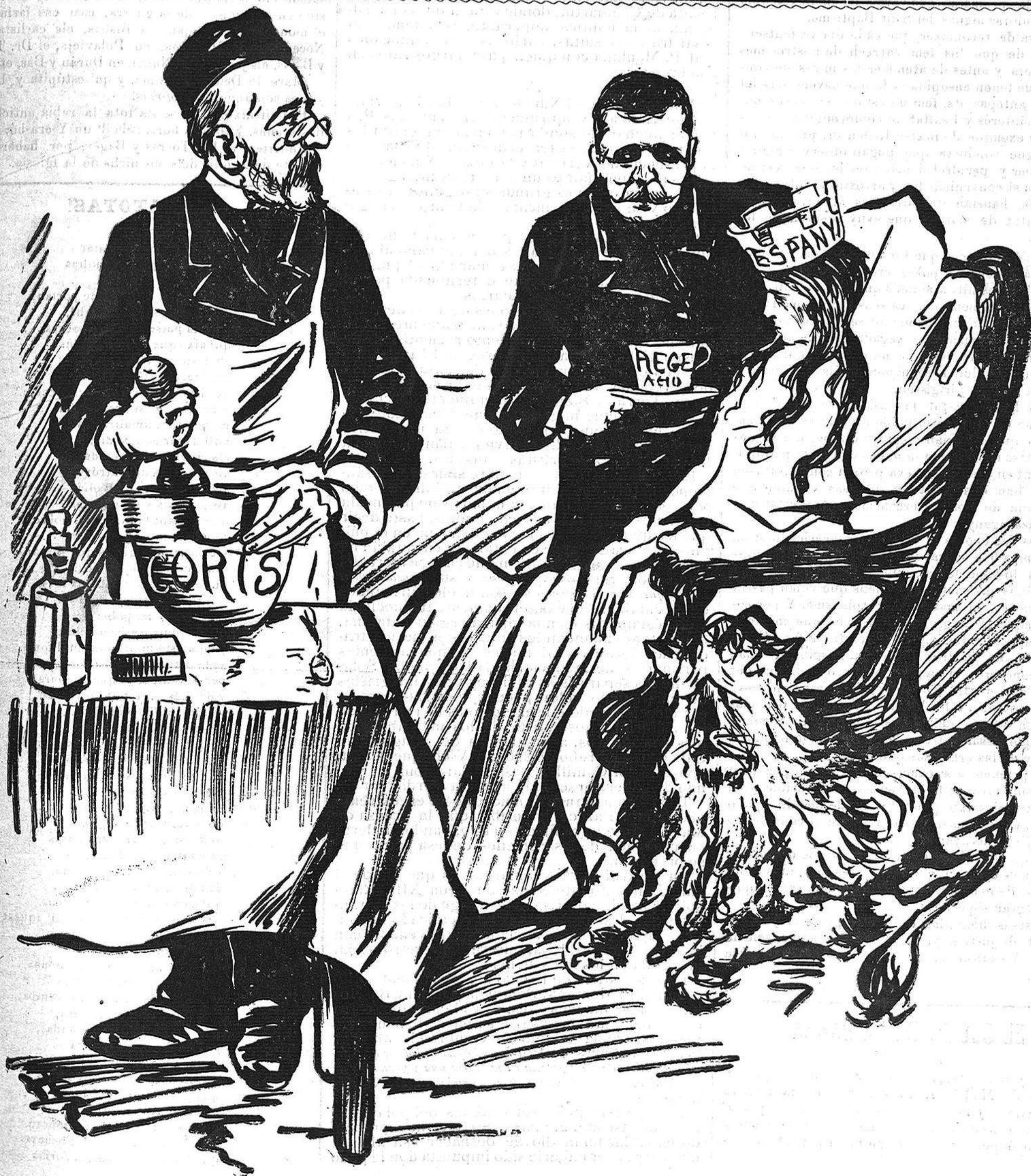
¡Pobra Espanya, en mans d' aquets Galenos y ab aquestas potingas!