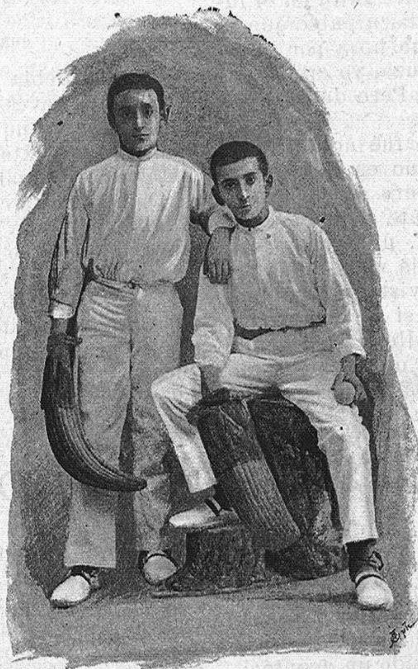
LOS HERMANOS MARQUINESES