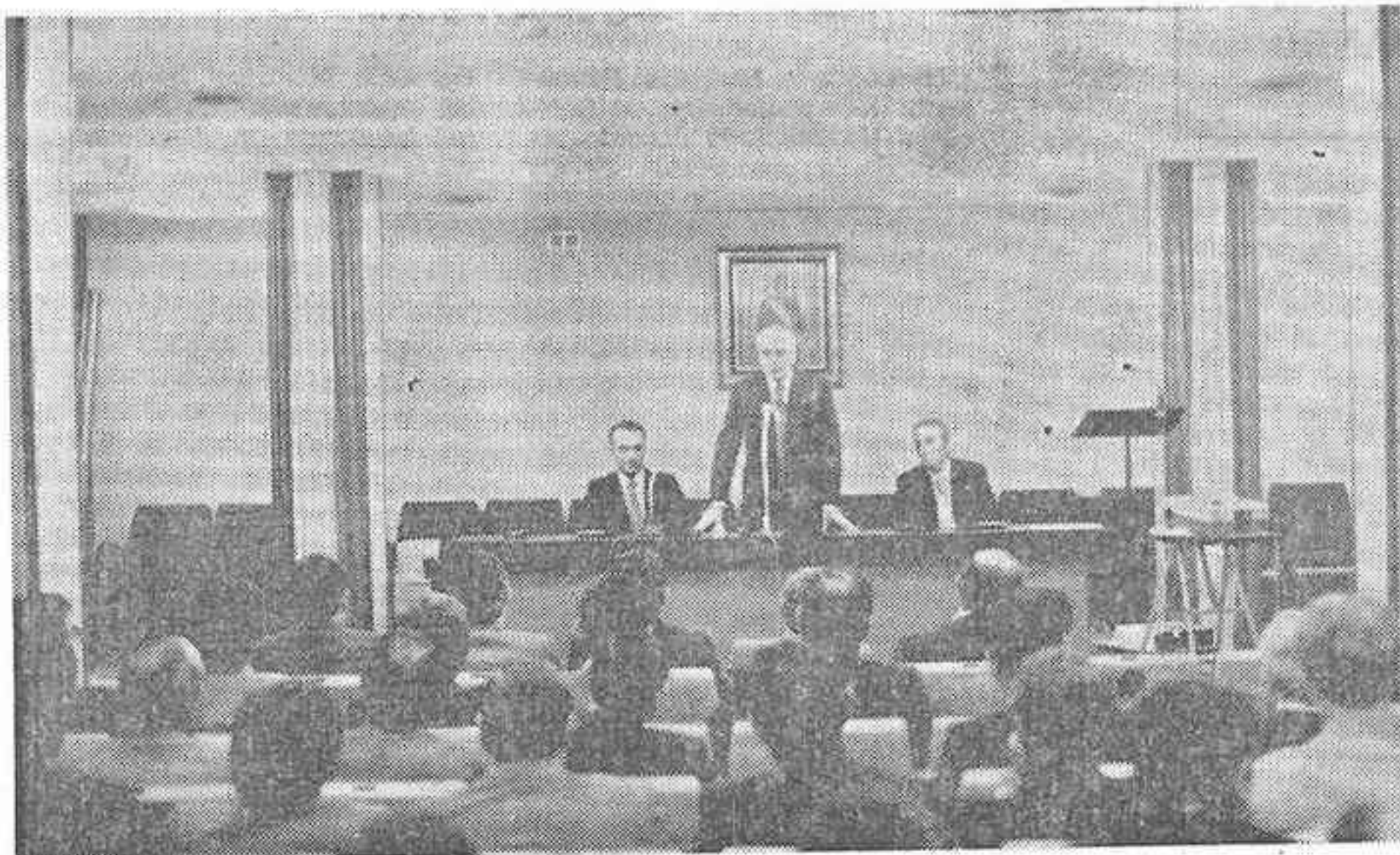
Intervención del presidente de la Caja Rural Provincial, en la apertura del seminario sobre informática.

Asisten un centenar de directivos y técnicos de toda España