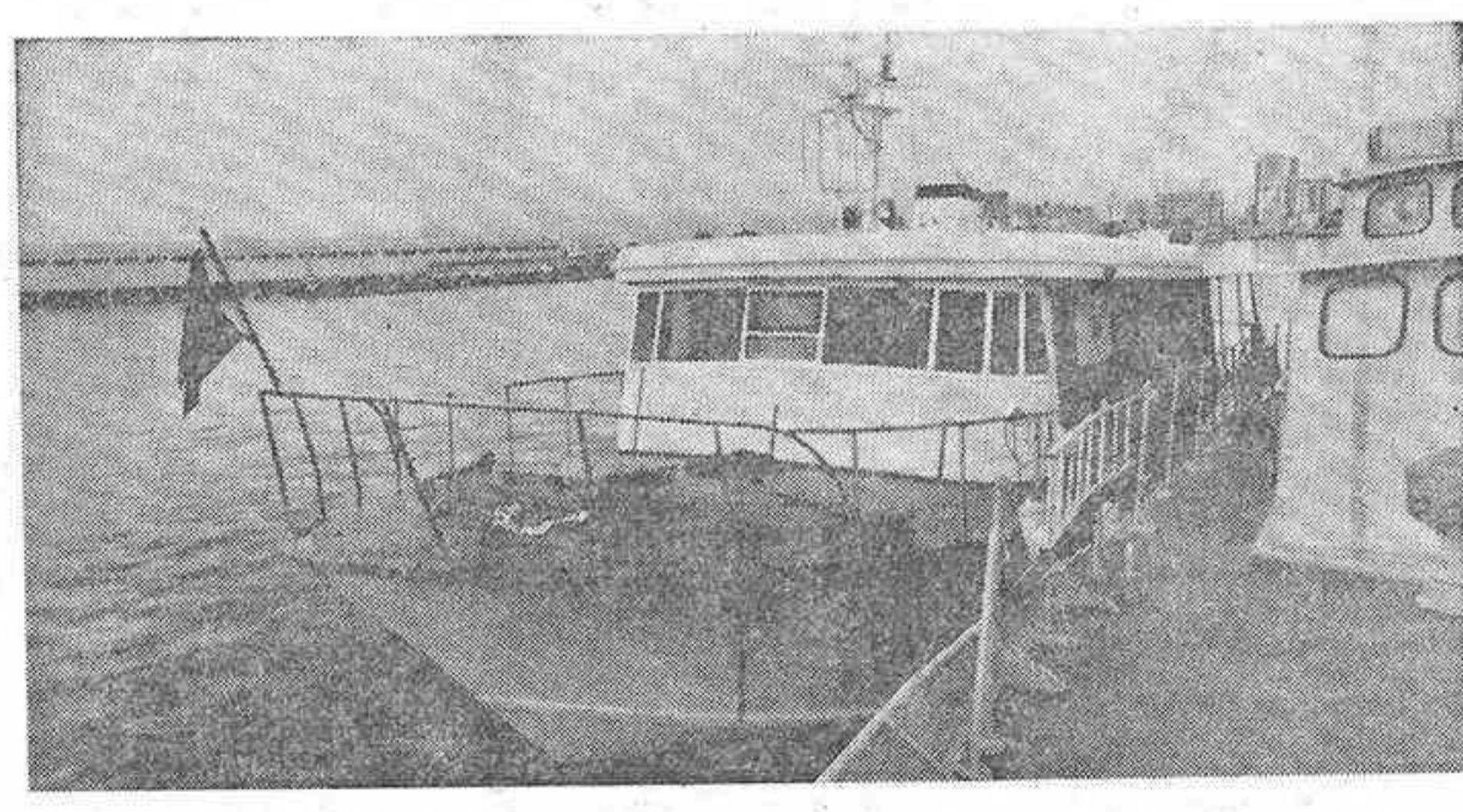
El yate "Urraca III" fondeado en el puerto de Castellón

La operación se realizó a tres millas de la costa, cerca de Vinaroz y Benicarló