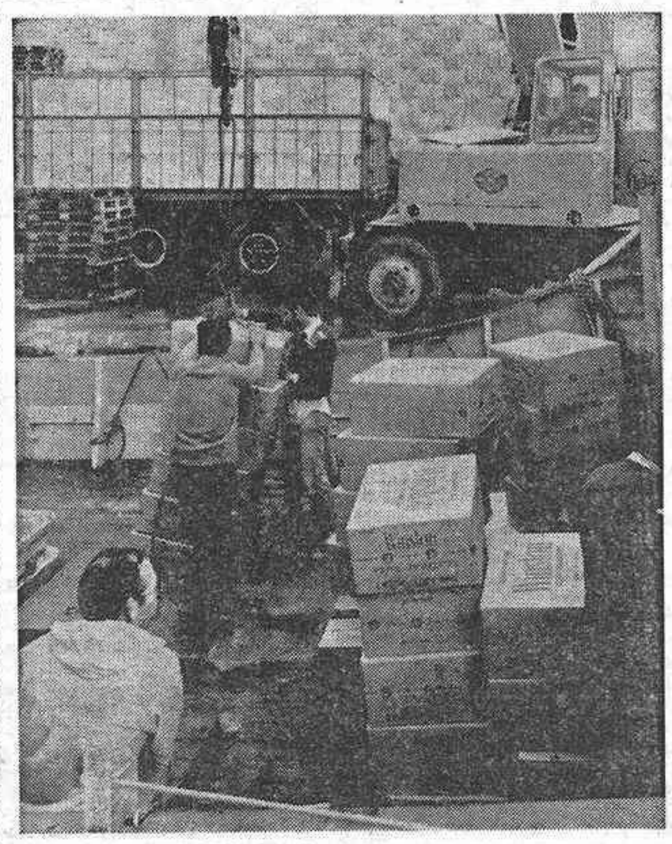
Das lanchas del servicio de vigilancia fiscal del Ministerio de Hacienda intervinieron un alijo de más de 2.500 cajas de cartones de tabaco rubio americano, valoradas en unos cincuenta millones de pesetas, cuando era transportado desde un buque a un yate, a tres millas de la costa, en las proximidades de Vinaroz y Benicarló. Las embarcaciones apresadas fueron trasladadas al puerto de Castellón, donde han quedado ancladas, en tanto que la mercancía ha sido depositada en la delegación de Tabacalera. En total son 125.400 cartones de cigarrillos de la marca "Winston" cuyo precio en las expenditorias sería de unos cien millones de pesetas. En la foto, descarga de las cajas en el puerto.