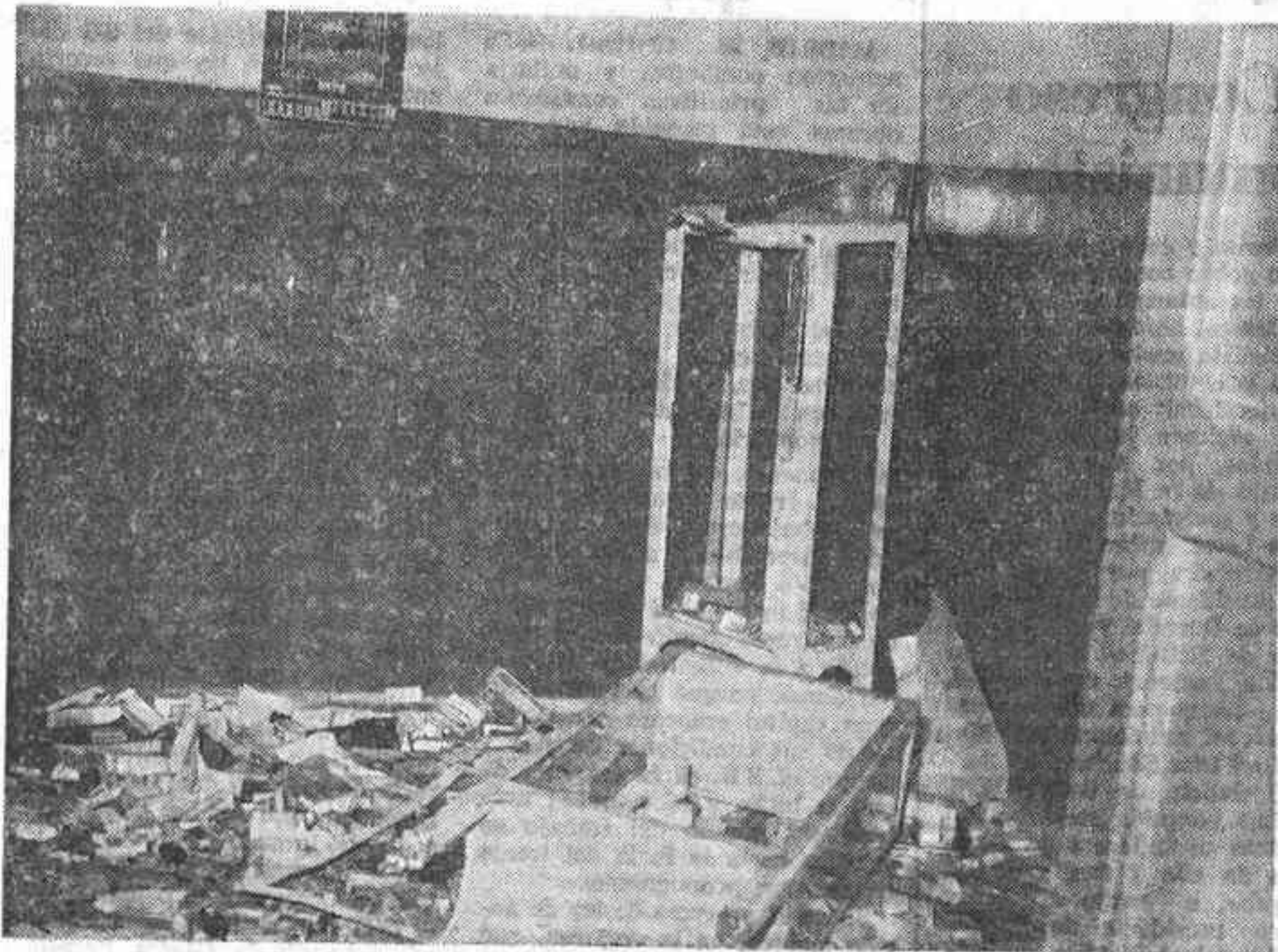
GUADALAJARA. — Destrozos ocasionados por los reclusos del centro penitenciario de esta ciudad, en las dependencias del mismo, después de amotinarse. Los internos iniciaron el motín quemando las colchonetas, extendiéndose el fuego por las diversas salas del centro.

Fuga de tres presos del penal de El Dueso Siguen faltando once internos en Carabanchel