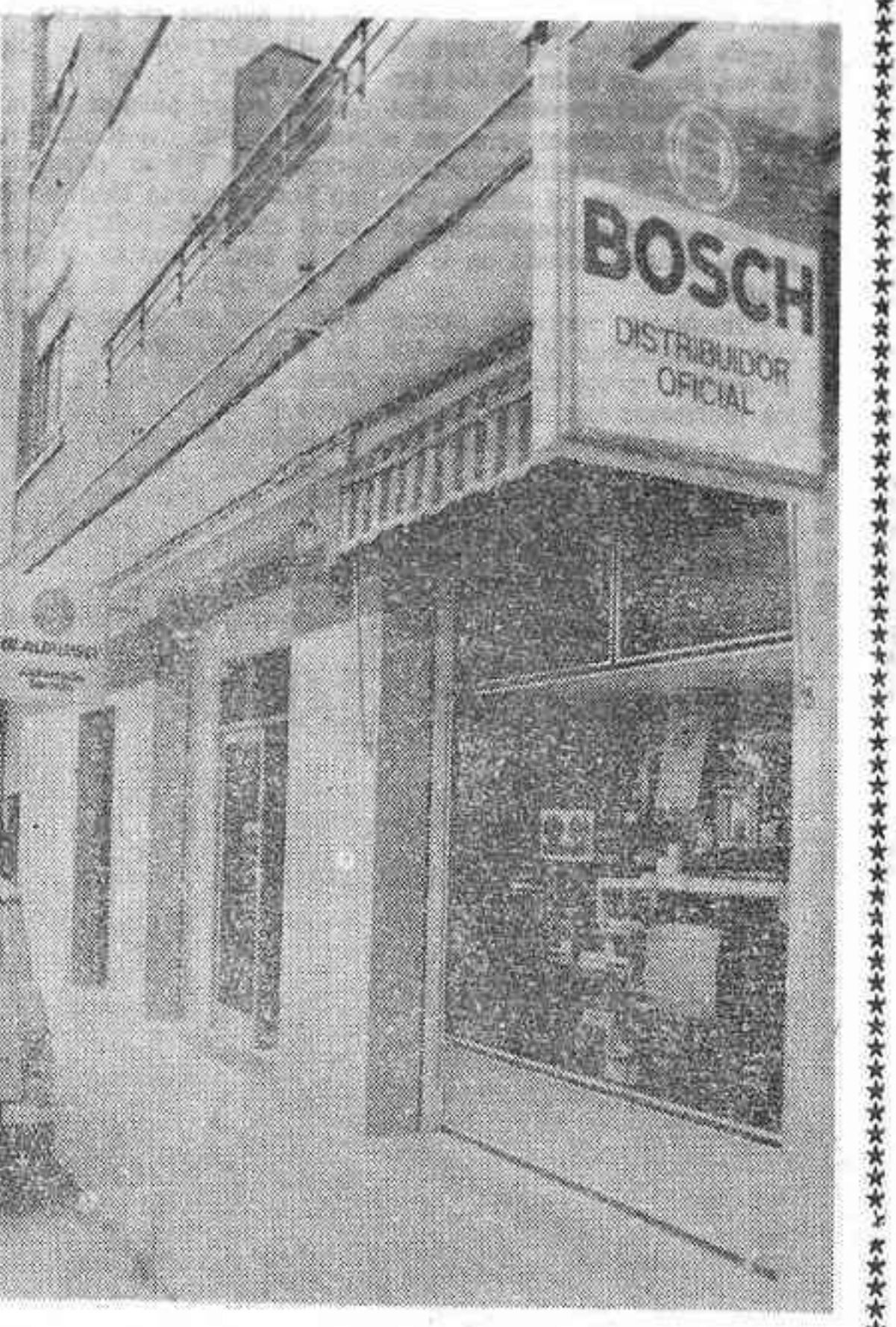
clientes potenciales. Además de las instalaciones generales que existen en EDECO de Castellón y Villarreal, los expertos han co-

Señalaremos finalmente que la firma ha creado una nueva red de asistencia de 11 talleres autorizados, actualmente en plan de expansión. Este servicio ha llegado en nuestra provincia hasta el 90 por ciento de los