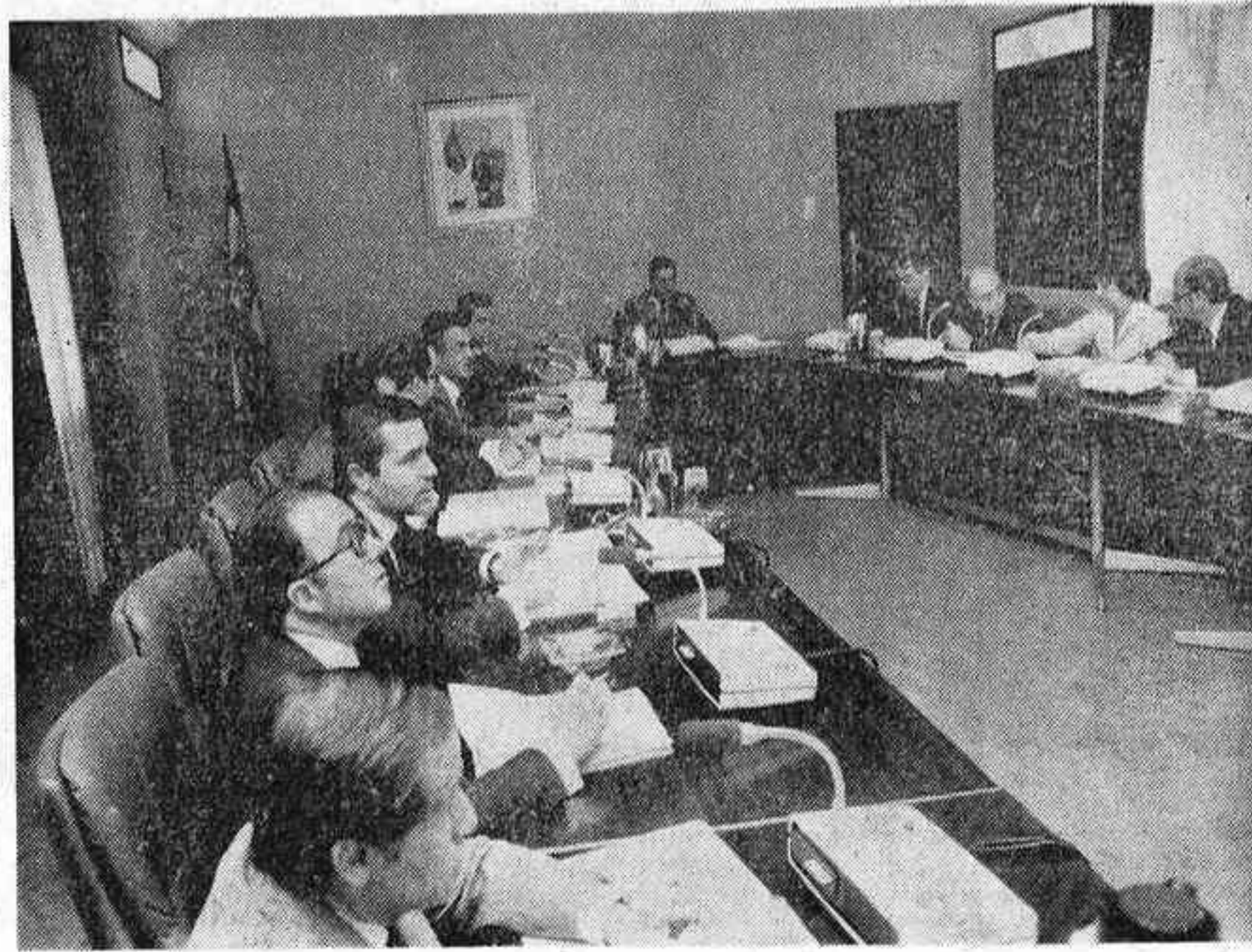
MADRID. — Se ha reunido en el Palacio de la Moncloa el comité ejecutivo de Unión de Centro Democrático presidido por Adolfo Suárez.

MADRID, 24 (Efe). — Pasadas las once y media de la mañana se ha reunido en un edificio anexo al complejo de la Presidencia del Gobierno el Comité Ejecutivo de UCD, bajo la presidencia de Adolfo Suárez.