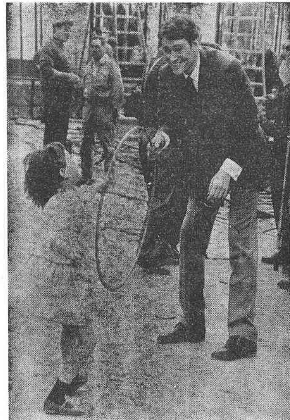
Peter O'Toole, un genial actor dominado por el alcohol.