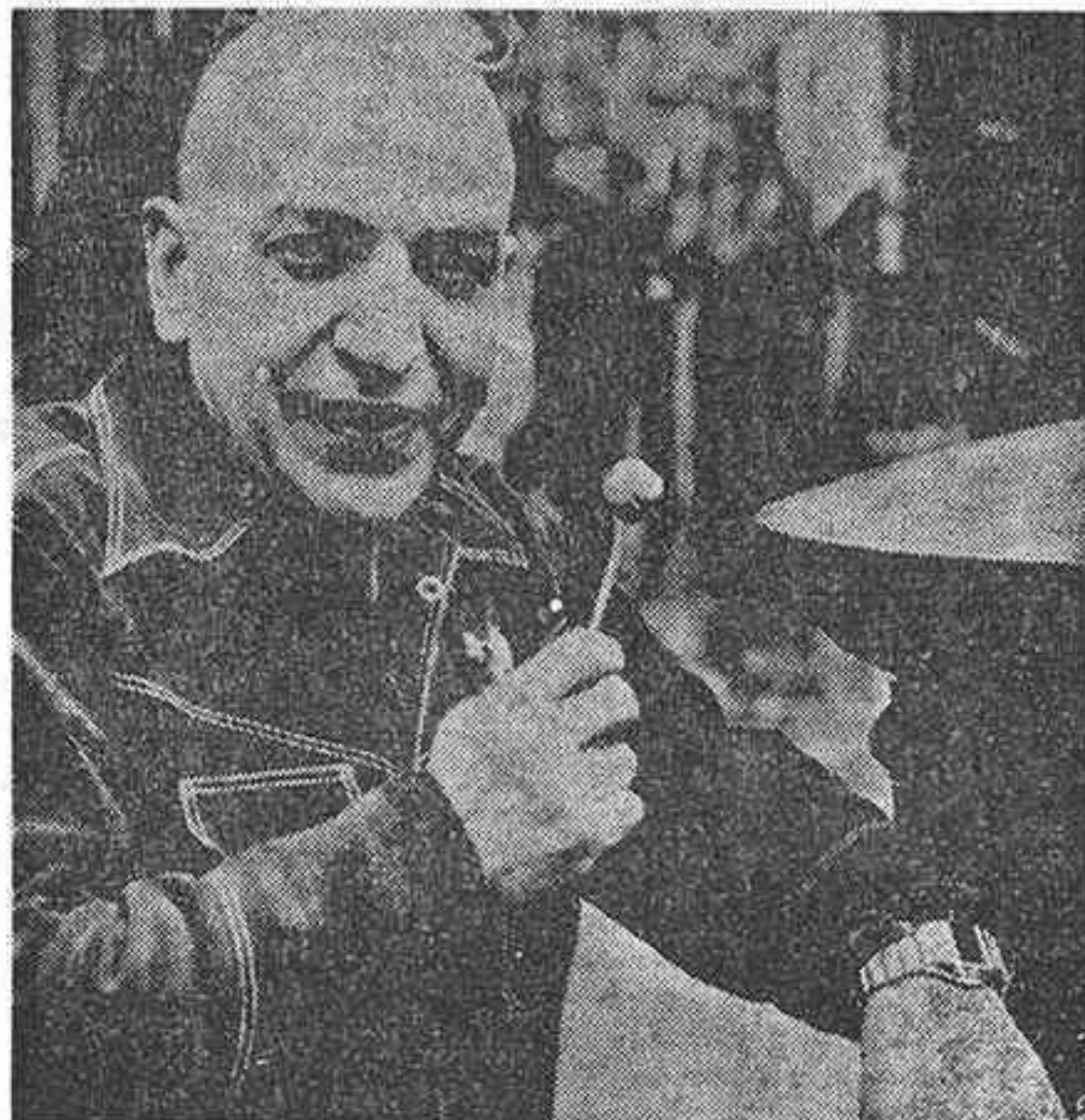
Savolas, el policía del chupa-chuss

Joann Woodward, Charles Bronson, Peter O'Toole, Kirk Douglas, Bette Davis, Sofia Loren, Bárbara Walters (Periodista de la TV), Katharine Hepburn, Jack Nicholson, Burt Reynolds, Anthony Quinn, James Coburn.