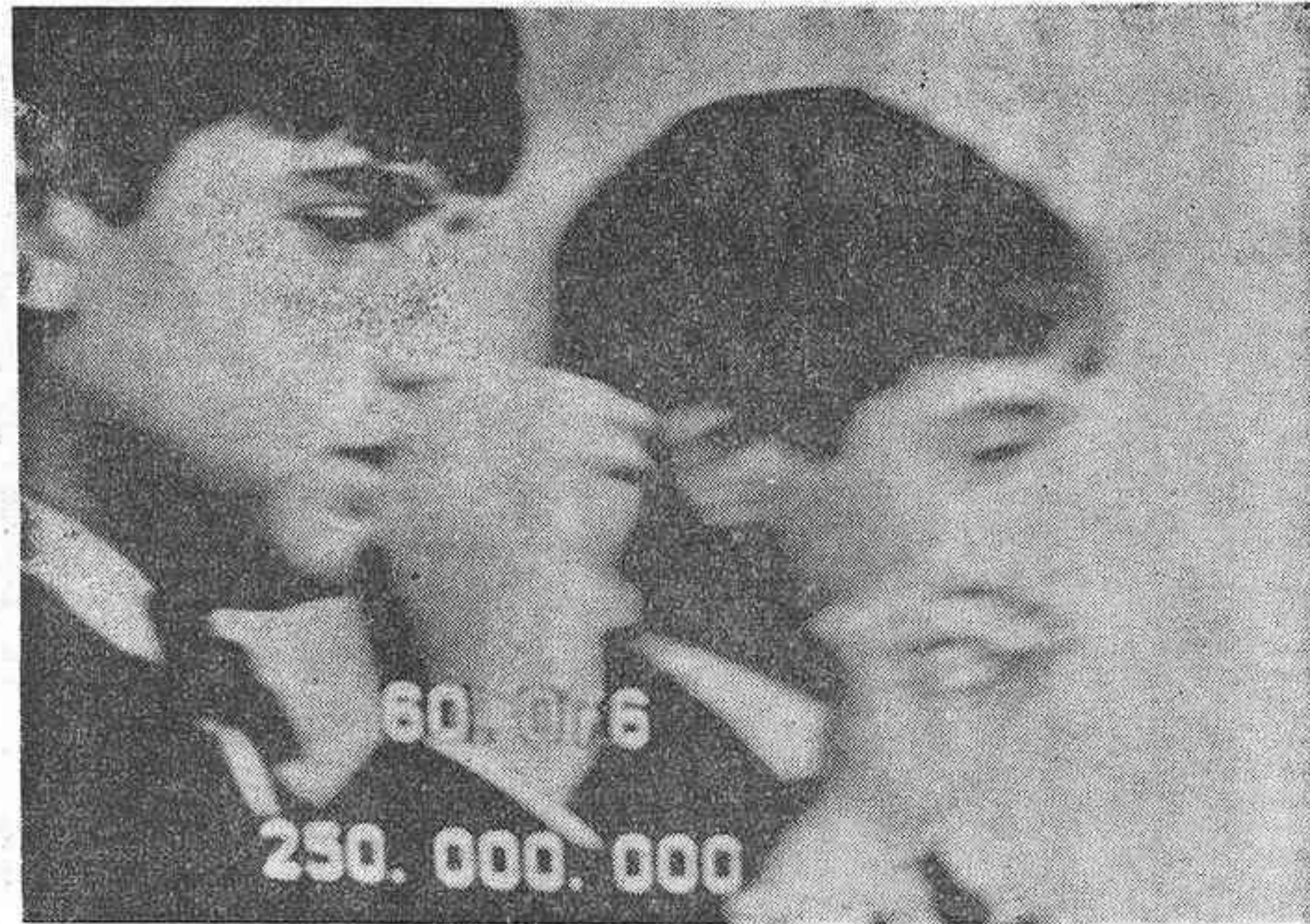
Los niños del Colegio de San Ildefonso muestran al público el número premiado con el «gordo».

Este año, Zaragoza jugaba 1.300 millones de pesetas, y sólo en este número ya ha conseguido 2.535 millones, con lo que las ganancias sobrepasan los 1.000 millones.