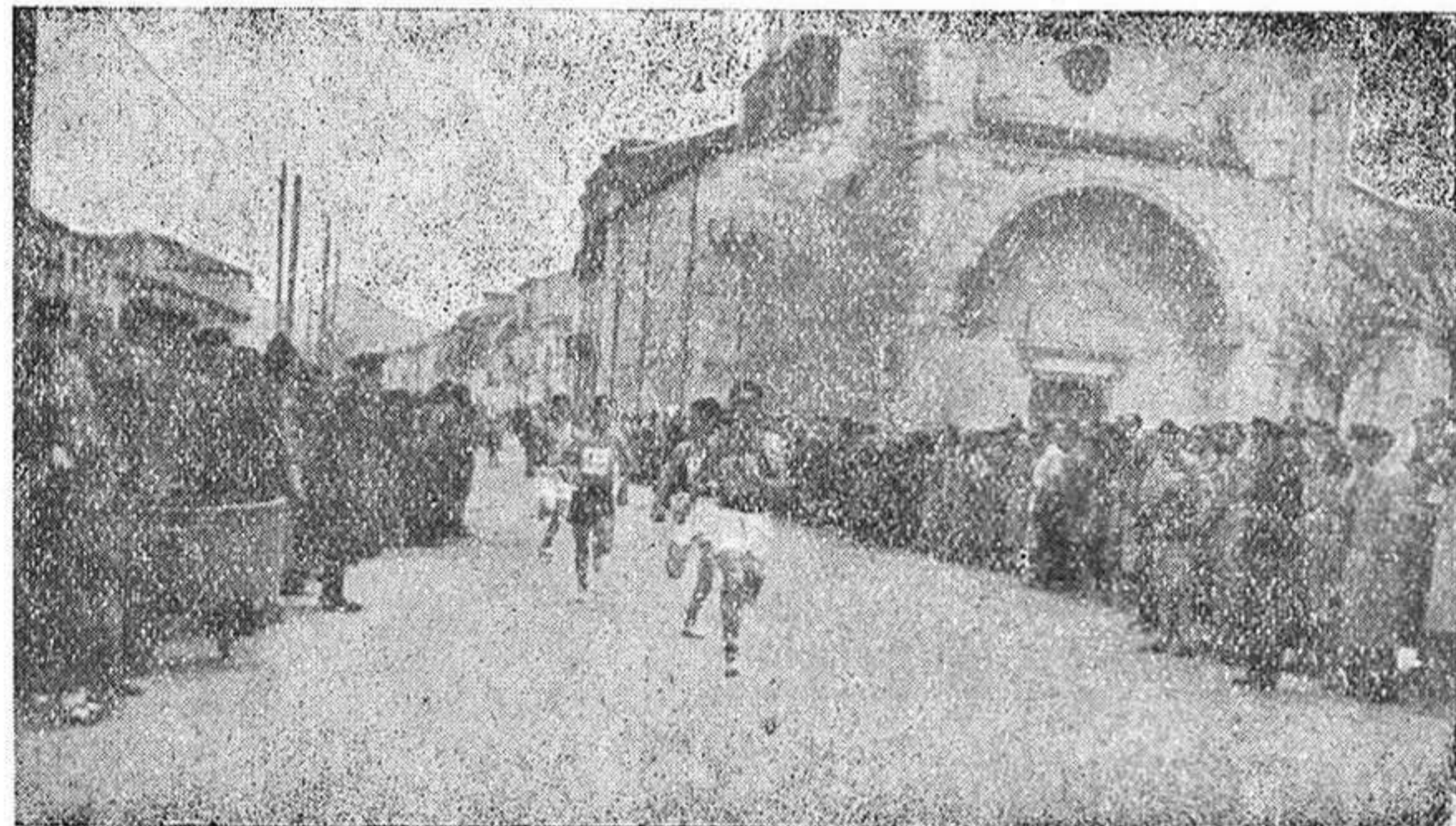
Tirón final de un grupo de participantes.

Por equipos, la clasificación ha quedado así: 1.º, Júpiter, 29 puntos; 2.º, Sacedón A, 42; 3.º, Chiloeches, 51; 4.º, Aranzueque, 65; 5.º, Hueva, 83; Sigüenza A, Sacedón B, Colegio Sagrada Familia A, Aibares, «F. Palomares», Mandayona, San Antonio (Guadalajara), Sigüenza B, Colegio Sagrada Familia B, y Marchamalo.