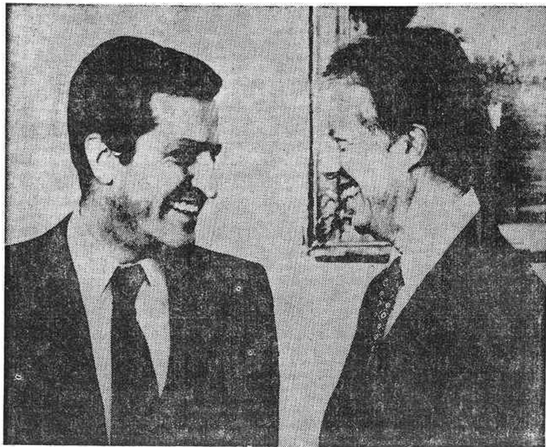
WASHINGTON. — El presidente del Gobierno español, Adolfo Suárez, durante la entrevista que mantuvo con el presidente norteamericano, Jimmy Carter.

La CEE ofreció 156 licencias para la pesca de altura con una reducción proporcional sobre el cupo de captura de merluza y el mantenimiento de las condiciones de la pesca de bajura.