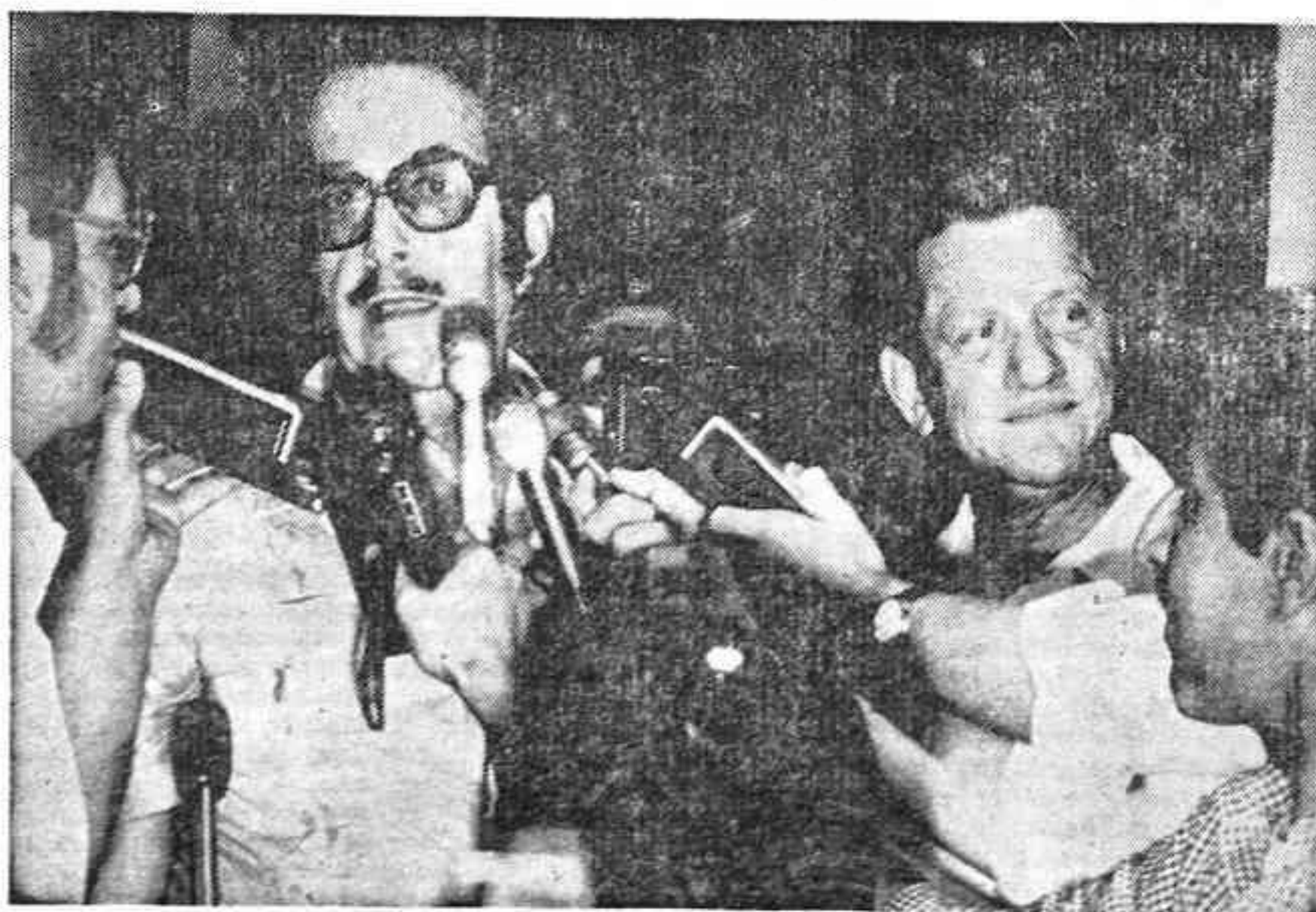
EL SALVADOR, 15. — Ocupantes y rehenes de la embajada de Panamá desalojaron anoche esta misión diplomática después de que el Gobierno dejara en libertad a siete campesinos que se hallaban en prisión en la ciudad de Usulután bajo cargo de daños a la propiedad privada y tenencias de armas de fuego. El arreglo fue logrado por los embajadores de Venezuela y de Méjico, tras conversaciones con la Junta revolucionaria de gobierno y de las "Ligas Populares". En la foto, los embajadores de Panamá y Costa Rica hablan con la prensa después de ser liberados.