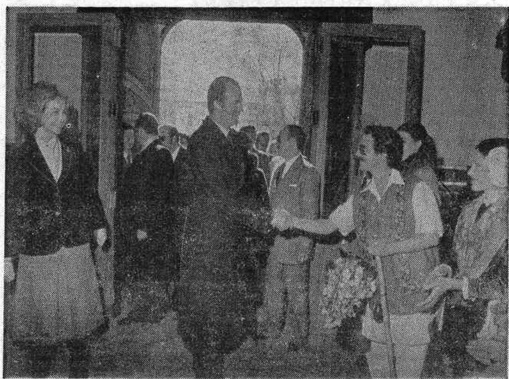
HUESCAR (Granada). — SS. MM. los Reyes de España, don Juan Carlos y doña Sofía, saludan a un grupo de jóvenes ataviados con trajes típicos de la región, durante la recepción que les ofrecieron en el Ayuntamiento de esta localidad, antes de emprender viaje de regreso a Madrid, dando por finalizada su estancia oficial en tierras andaluzas.