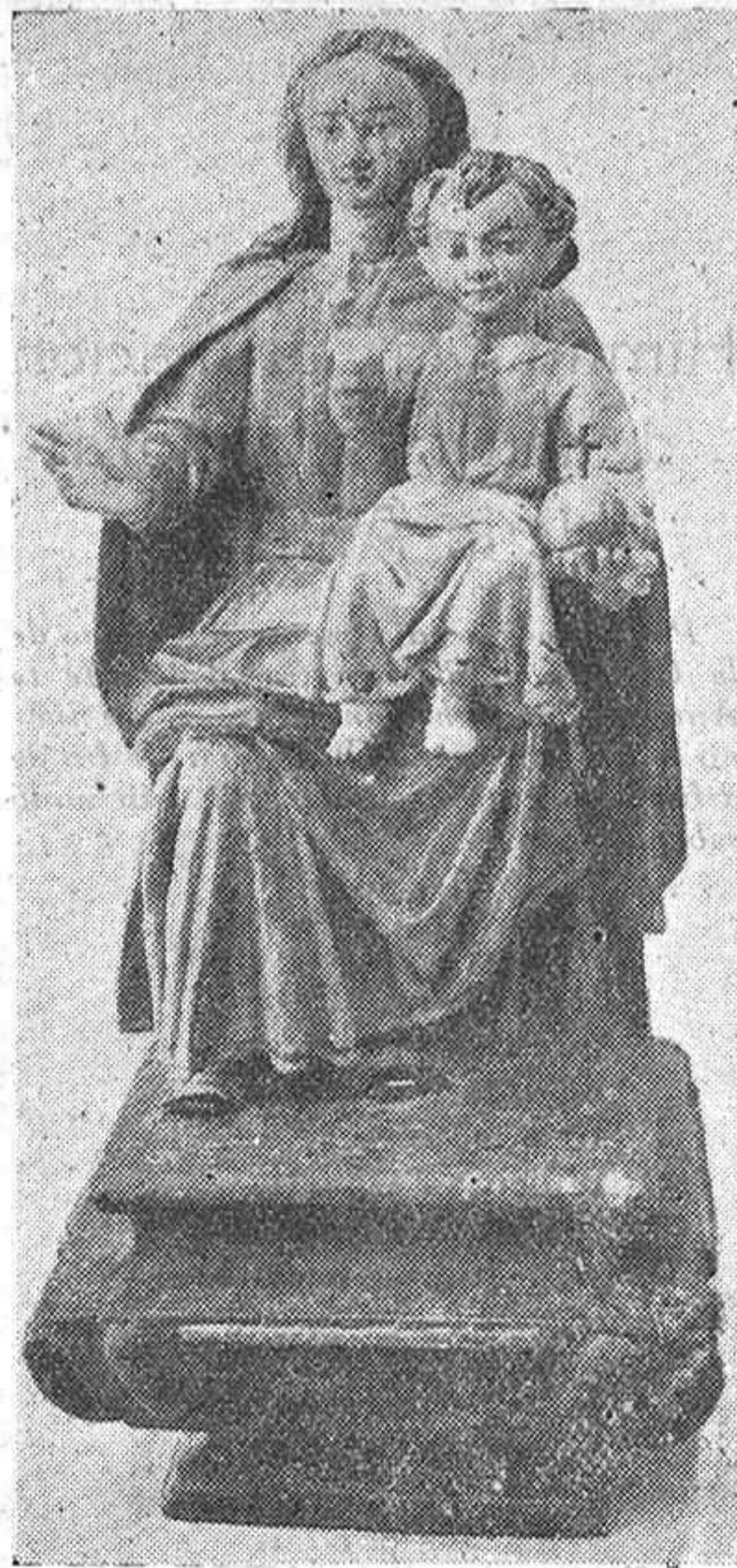
Imagen de Ntra. Sra. de al Antigua, llamada la «Enfermera». Talla del siglo XIV, de 44 cm. de altura, y que era llevada a casa de los cofrades cuando alguno la solicitaba por hallarse enfermo.