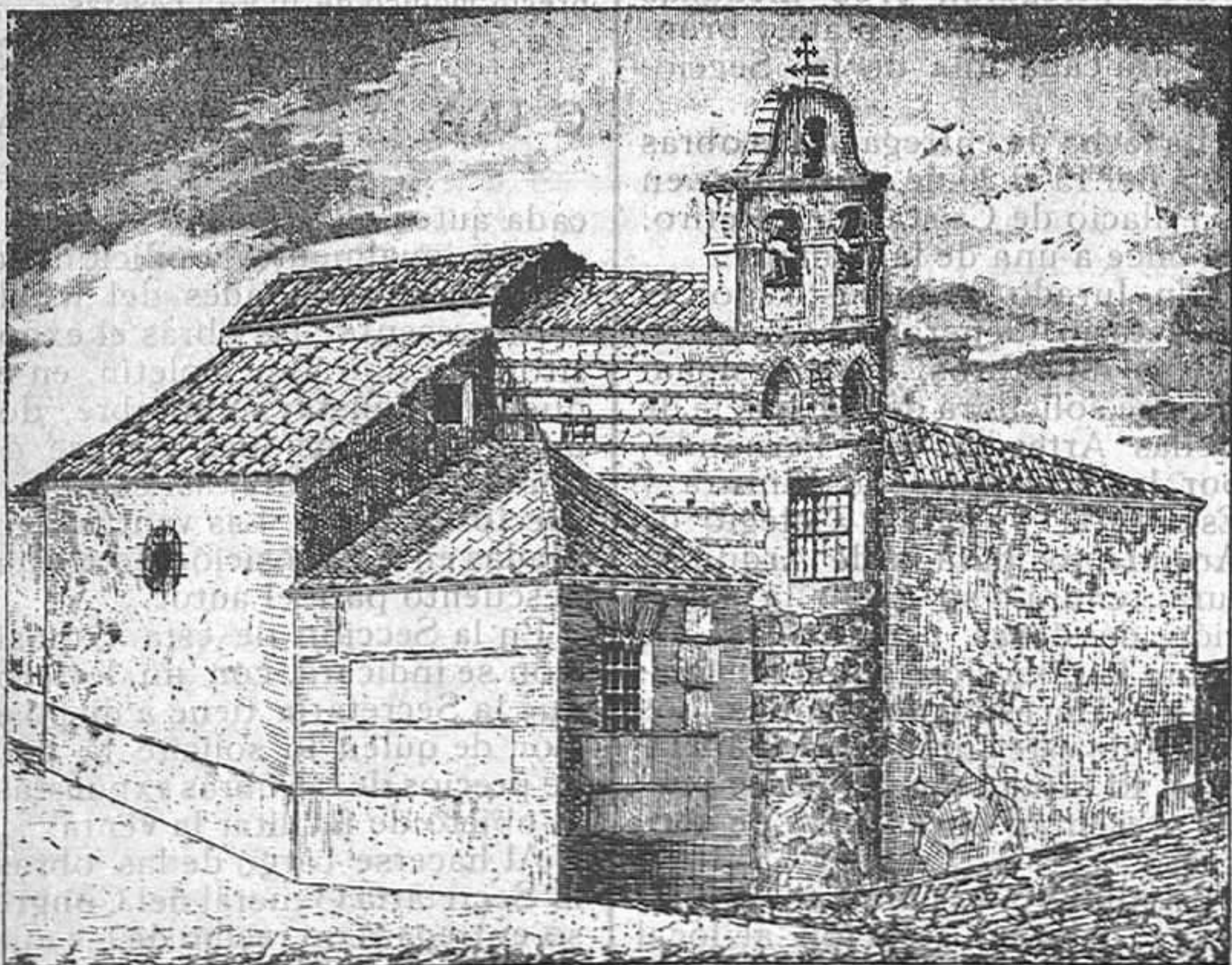
El Santuario de Ntra. Sra. de la Antigua, antes de su reedificación (Año de 1896).

El Padre Escursell fué muy aplaudido al final de su interesante conferencia.