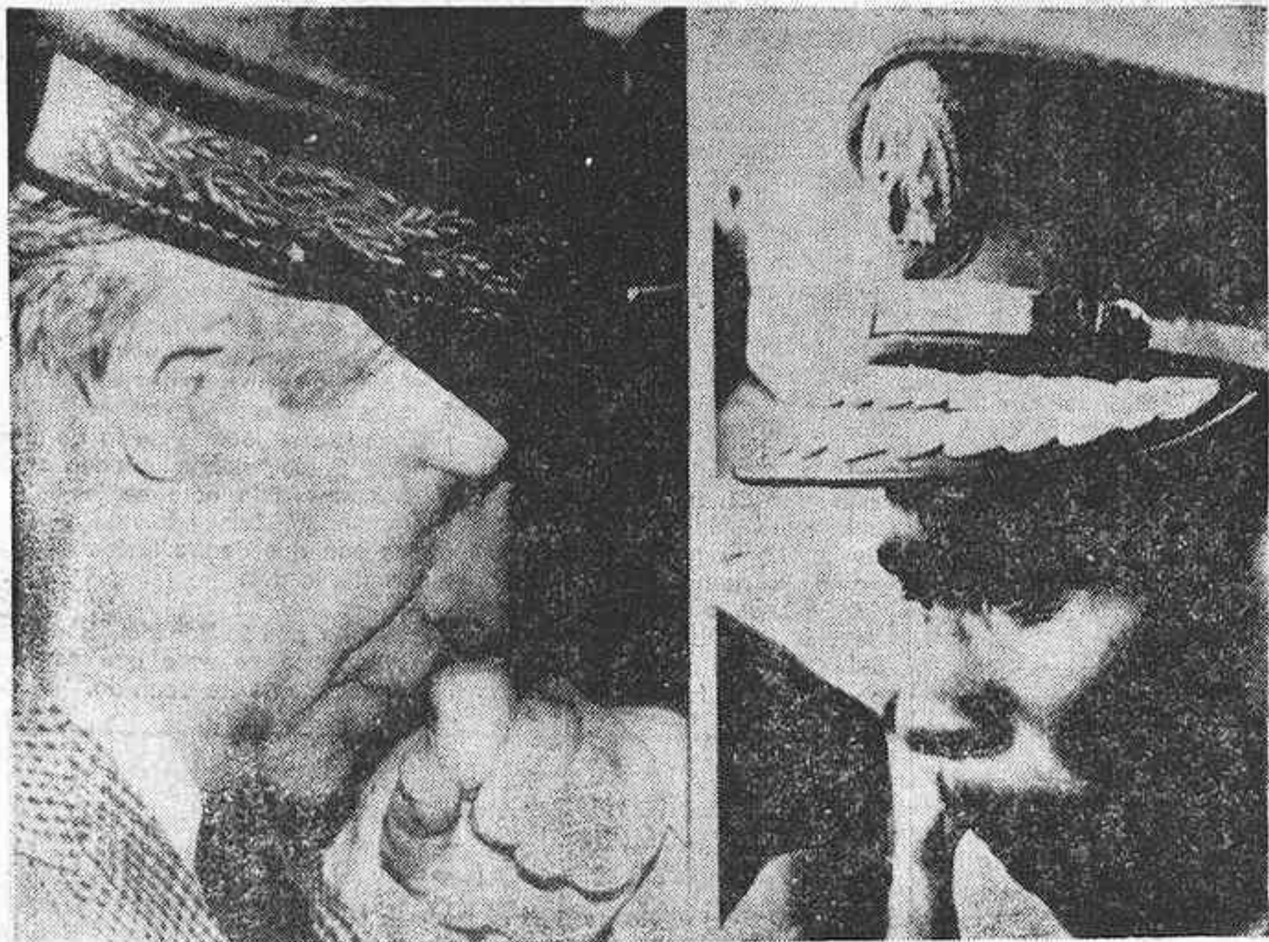
RUNAWAY BAY (Jamaica). — El canciller de Alemania Federal Achim Schmidt (izq.) y el Presidente de Nigeria Olesegun Obasanjo (der.) adoptan una postura similar mientras reflexionan sobre algunas preguntas poco después de su llegada a esta ciudad. — (Telefoto EFE-UPI)

RUNAWAY BAY (JAMAICA), 28 (Efe). — La marcha del diálogo «Norte-Sur» entre los países industrializados y las naciones en vías de desarrollo será el punto principal de las deliberaciones que hoy han iniciado en esta ciudad los jefes de gobierno de seis países.