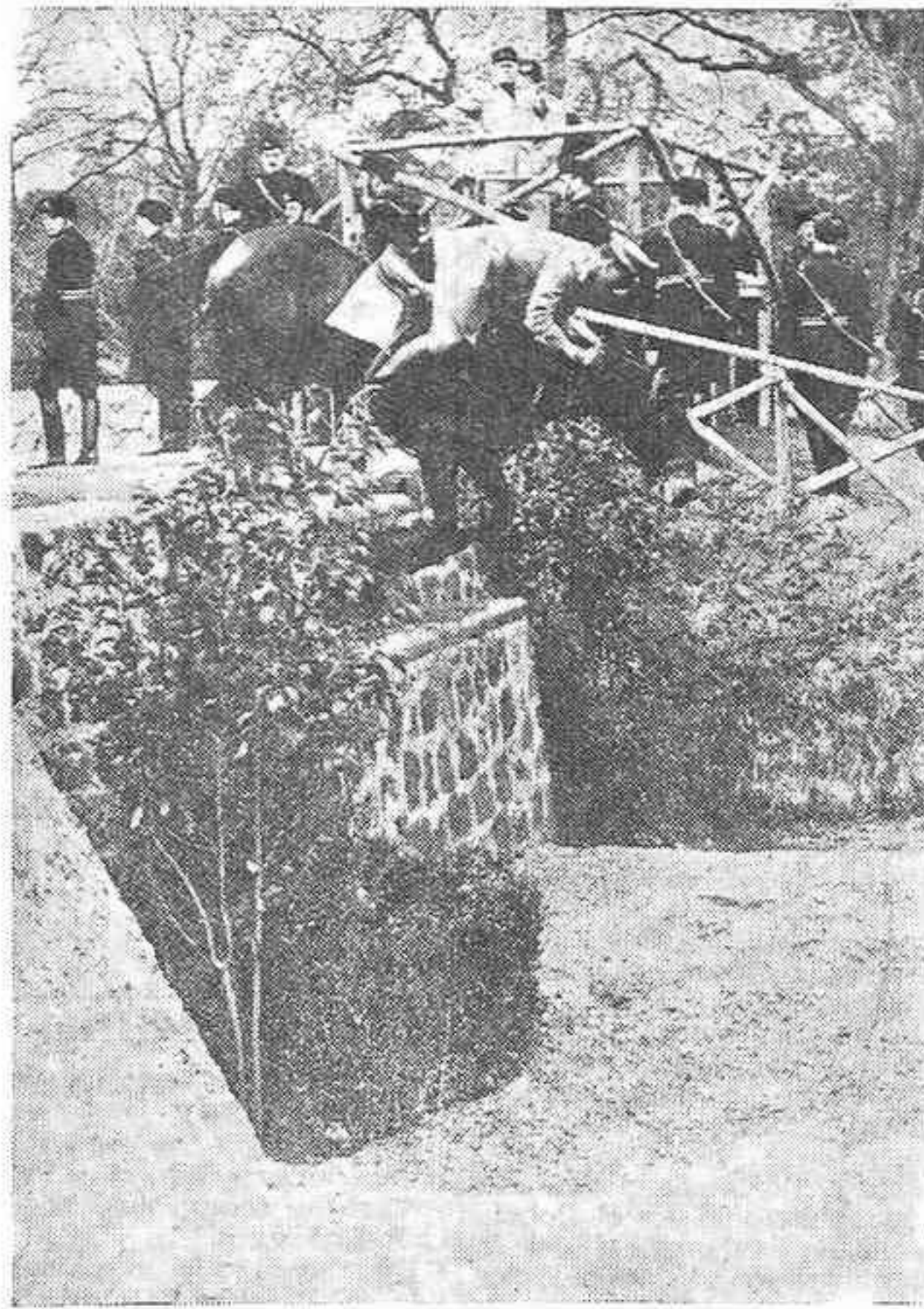
EL DUCE INAUGURA EL CAMPO HIPICO DE VILLA HUMBERTO

Con esta confianza, las autoridades nacionales de España se muestran dispuestas a la transigencia y a la concordia.