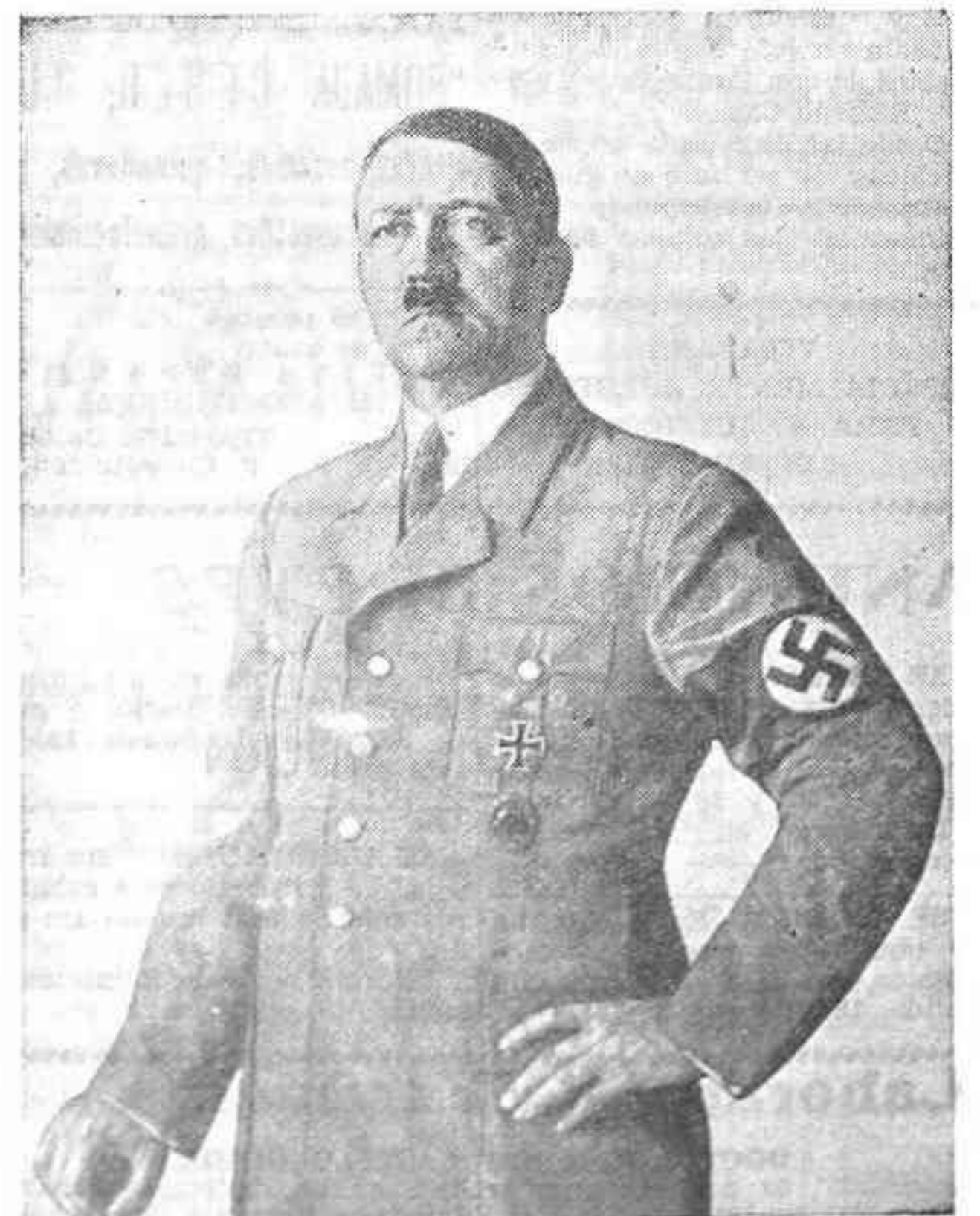
EL FUHRETT-CANCILLER, ADOLF HITLER, CELEBRÓ AYER EL 49 ANIVERSARIO

En Berlín, una enorme muchedumbre permanecía estacionada ante la Cancillería, reclamando al Fuehrer para felicitarle, hasta que éste se vio obligado a salir al balcón, produciéndose en aquellos momentos frenéticas manifestaciones de entusiasmo.