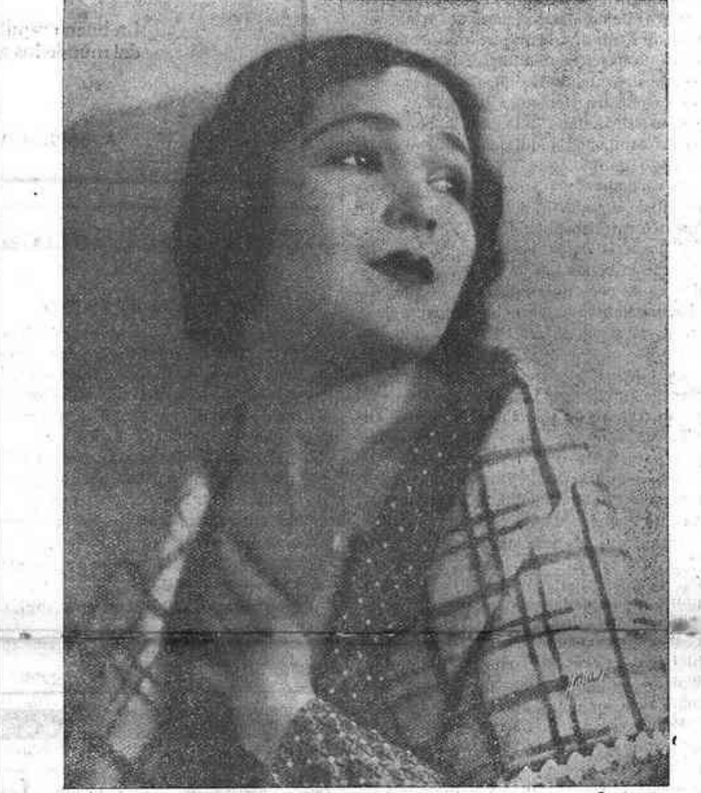
Dolores del Río, famosa artista mejicana, protagonista de "El precio de la gloria", película que se estrenará mañana en el teatro Guimerá.

EN ESTA CAPITAL Cine Victoria En la Sección "vermouth" de hoy a las ocho y quince y ocho y treinta se proyectará por primera vez la interesante película en cinco partes "especial" Fox, titulada "Amor de árabe", con Bárbara La Marr y John Gilbert de protagonistas. Por primera vez se exhibirá la película cómica en dos partes "Rapto eléctrico". La Sección de las diez y cuarto es a mitad de precio para señoras y el programa magnífico pues se pasará por segunda y última vez la extraordinaria producción Metro Goldwyn Mayer en siete partes titulada "El boleros" en la que se nos presenta, después de largo tiempo sin verle el simpático "Chiquilín" y el notable actor Lars Hanson. Empezará la Sección con la película sevillana "Fiestas en tablada". Parque Recreativo En la sección popular, a las ocho y media de la noche, se proyectará la notable película en cinco partes "La ley del país nevado", de emocionante argumento. Para la segunda sección, a las 10 y quince se anuncia el estreno de la interesante cinta de ambiente frívolo "Te para tres", interpretada por Lew Cody, Owen Moore y Alleen Pringle. Comenzará el espectáculo con el "Reportaje gráfico número 21". Cine La Paz A las diez de la noche, gran función de moda en honor de las señoras y señoritas, exhibiéndose la notable producción de la Paramount en ocho partes "La niña de la Florida", por la genial artista Bebé Daniels.