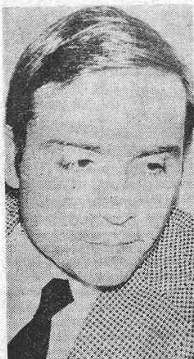
comprende mutaciones precoces de satsuma y mandarina kara. —¿En qué consiste su trabajo? —En el Departamento de Citricultura Regional de Investigación Agrario de Levante, del Instituto de Investigaciones Agrarias, existen varios equipos que trabajan conjuntamente en el estudio de la problemática de variedades, que se toca fundamentalmente bajo el aspecto de catalogación y clasificación de las nuevas mutaciones que con cierta frecuencia van apareciendo en nuestra zona naranjera, y estudio de su contenido vitamínico. Desgraciadamente en esta zona la profusión de virus es enorme y es muy probable encontrar altos porcentajes en tales mutaciones. Entonces es necesaria la actuación de un segundo equipo que trata de la limpieza de esas variedades, al objeto de entregarlas al agricultor en condiciones óptimas para ser utilizadas con patrones tolerantes a la tristeza.

—¿En qué variedades está investigando? —Tal como he expuesto en la conferencia, sobre una serie de mutaciones incluidas dentro del grupo de las clementinas, que se denominan «clementina hermandina», «clementina esval» y «clementina tomatera»; luego también hay otro gran grupo que