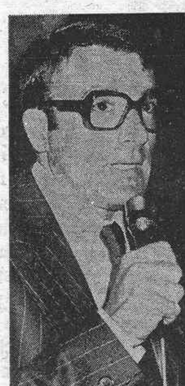
po lo conozcan, domiren y aprovechen al máximo. —¿De qué forma se extiende el uso de herbicidas? —Con carácter general en los Estados Unidos e Israel se usan al cien por cien. En Italia y Japón, concretamente en el sector de los cítricos, su uso es ya del orden del cincuenta por cien. Ahora bien, aquí en España no estamos a ese nivel todavía, aunque en esta zona de Castellón y Valencia creo que el herbicida se aplica ya en un veinte o veinticinco por ciento de las fincas.

—¿El herbicida es conveniente o necesario? —Necesario, no diría que lo es, ahora bien, conveniente sí, porque, de una parte el agricultor lo que va buscando es la rentabilidad de su cultivo y el herbicida una de las cosas que hace es abaratar coste de producción; por otra parte, se ve que la mano de obra sube constantemente, mientras que los productos químicos suben también, pero no tanto, no llevan el ritmo acelerado de los salarios, por eso en un plazo máximo de diez años la utilización de mano de obra, aunque sea con una adecuada mecanización, será ruinosa para el agricultor, por lo que se verá obligado a recurrir a los herbicidas. Entonces, teniendo en cuenta estas cosas, resulta conveniente que se vaya intensificando su uso para que llegue el día