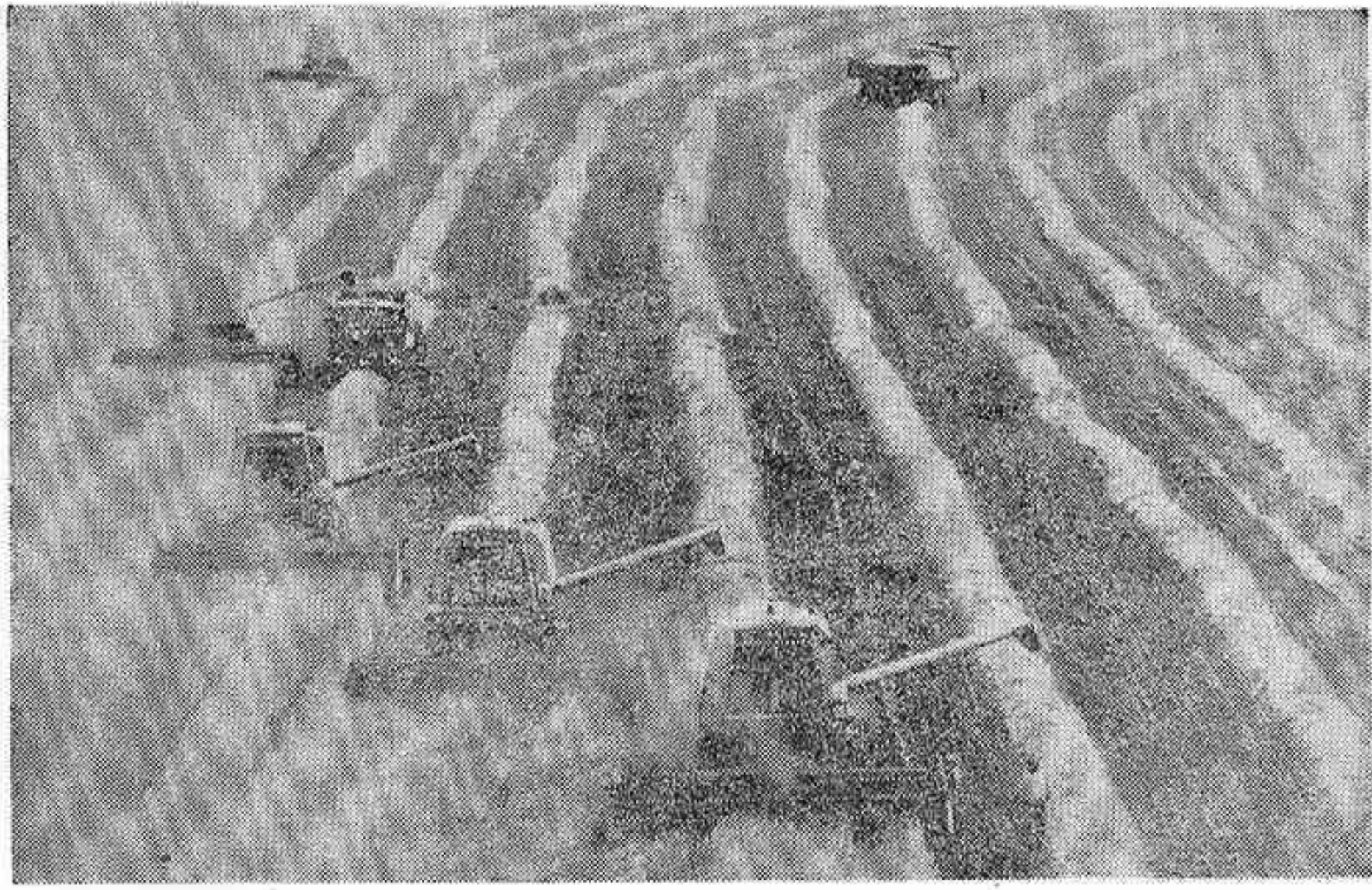
A pesar de los avances técnicos, las perspectivas cerealistas para este año son de marcado pesimismo.