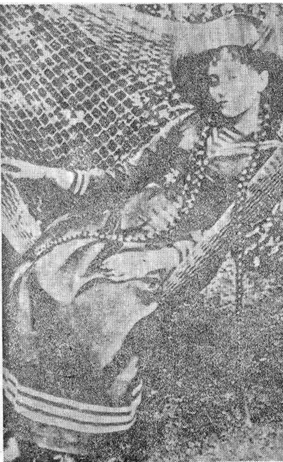
Colette, en una fotografía de su juventud.

Miguel Ángel Asturias, Chopin, Abelardo y Eloísa... Jounod, Berlioz, se han quedado para siempre en París, enterrados en el cementerio del Père Lachaise.