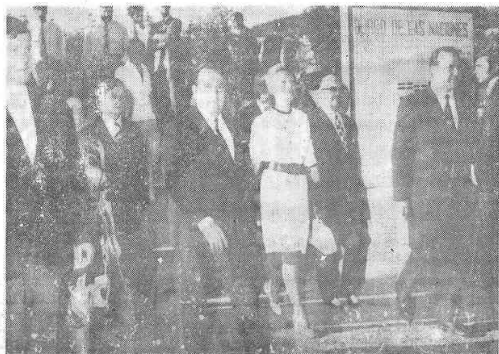
El Ministro de Información y Turismo, D. Alfredo Sánchez Bella, acompañado de su distinguida esposa, realizó una visita a Santiago de Compostela y se detuvo de manera especial en el Burgo de las Naciones.