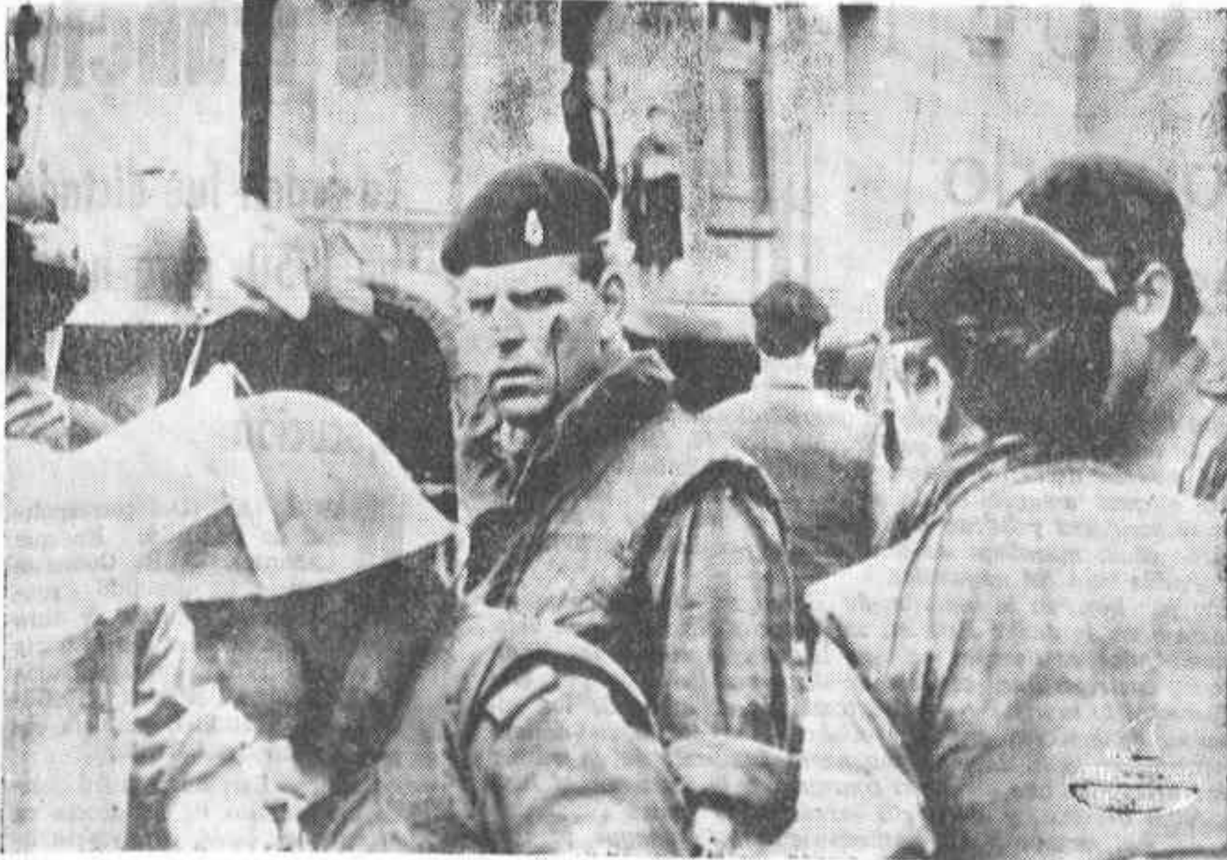
LONDONDERRY. — Un soldado de la Royal Horse Artillery (centro) muestra un hilillo de sangre en la cara después de un tiroteo mantenido en la zona norte de Bogside.

HASTA EL MOMENTO, EL NUMERO DE VICTIMAS SE ELEVA A VEINTICINCO