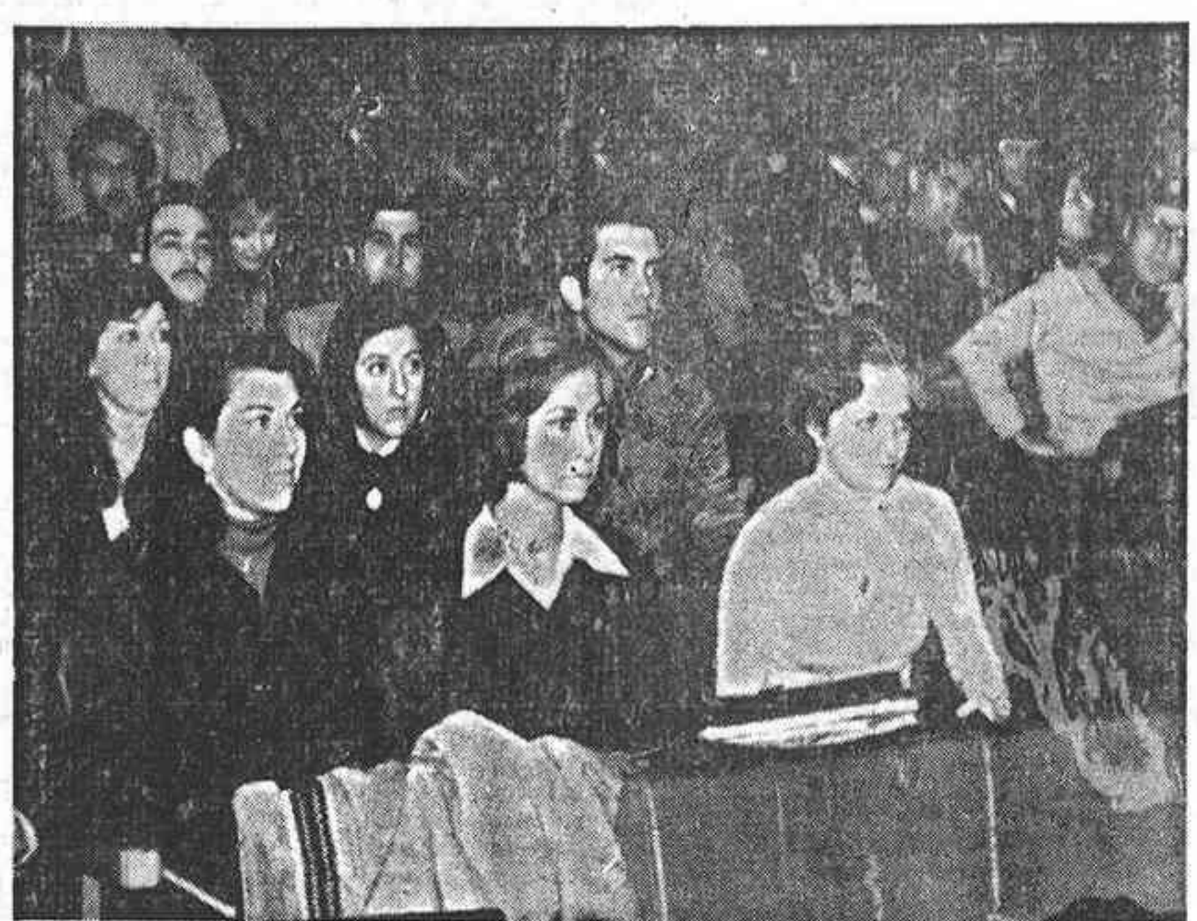
MADRID.—Al igual que lo ha hecho durante todo el año, S. M. la Reina doña Sofía sigue asistiendo como alumna al curso de Humanidades Contemporáneas de la Universidad Autónoma de Madrid.