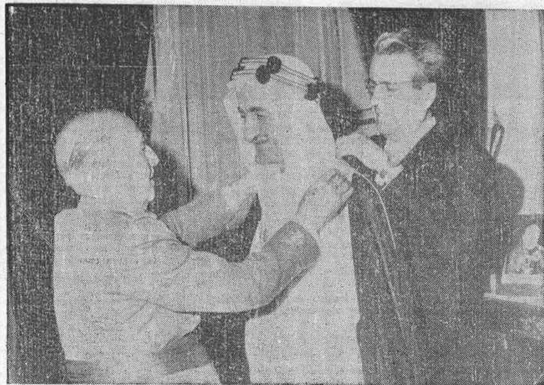
1966.— Durante la entrevista mantenida entre el Jefe del Estado y el Rey Feisal de la Arabia Saudí, en el Palacio de El Pardo, Franco impone al Monarca el Gran Collar de la Orden del Mérito Civil.

PARIS: Alza sensible en las cotizaciones del oro