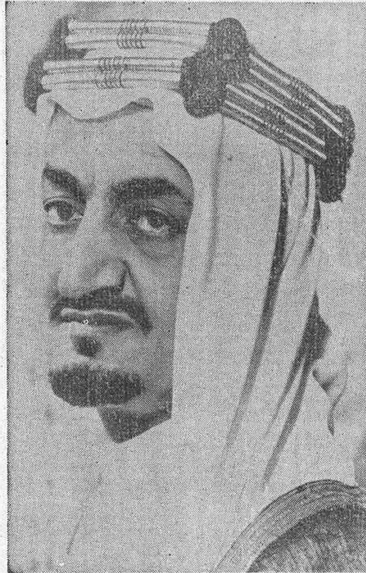
EL REY FEISAL

Su hermano el Príncipe Jalep ha sido designado nuevo Monarca