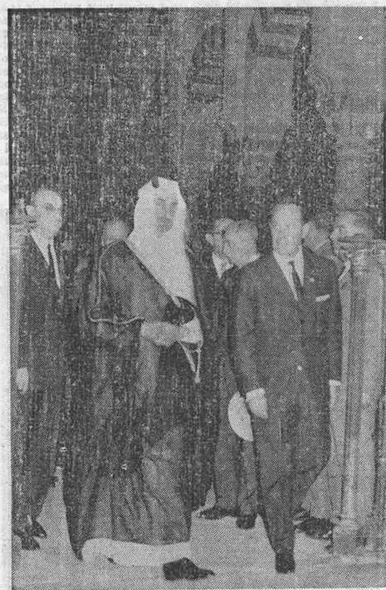
1960.— El Rey Feisal, Ibn Abdeel Azzid de la Arabia Saudí visitando la Mezquita de Córdoba.

Al margen de consideraciones biográficas o dinásticas, lo que se retiene por los observadores políticos es un hecho: la garantía de que la sucesión de Feisal no engendrará ningún conflicto interno en la Arabia Saudí, ya que el propio soberano había previsto esta circunstancia dada su salud delicada. El aspecto más trascendente de esa desaparición súbita del