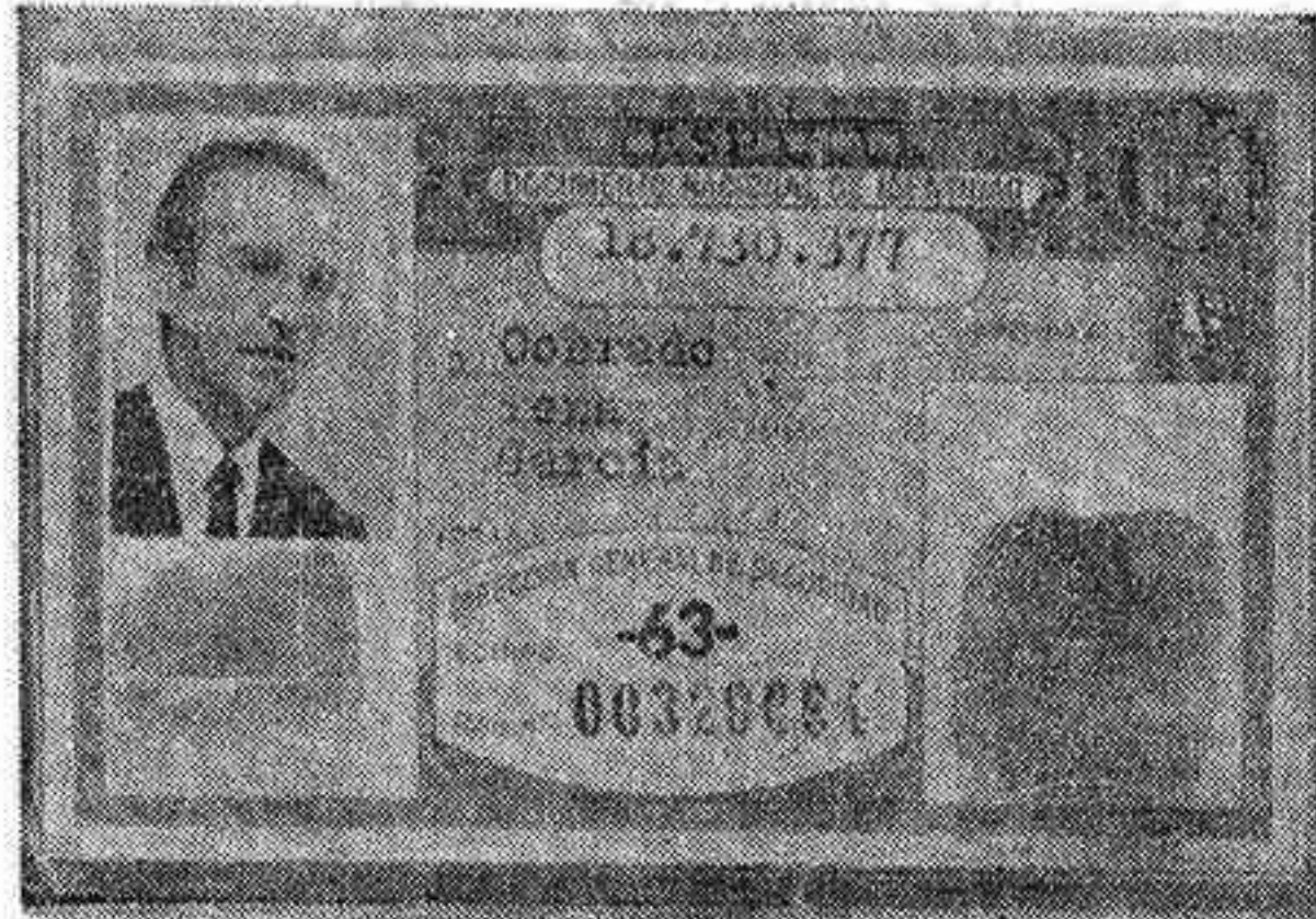
Actual Documento Nacional de Identidad, que será sustituido en breve

El nuevo Documento Nacional de Identidad, cuyo precio de expedición será regulado por una próxima disposición, de acuerdo con las nuevas circunstancias, se cumplimentará por una sola cara y llevará incorporada la fotografía en color del rostro del titular, de frente y con la cabeza descubierta, así como la impresión dactilar, que corresponderá a la del dedo índice de la mano derecha. Los citados datos serán: Nombres y apellidos, nombre de los padres, naturaleza, sexo, fecha de nacimiento,