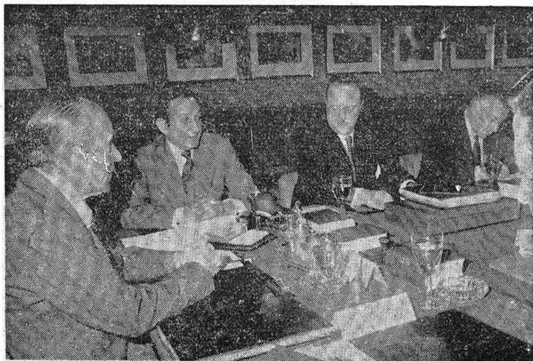
MADRID.—En la sede del Consejo Nacional del Movimiento se celebró la reunión de la Comisión mixta Gobierno-Consejo Nacional, encargada de estudiar las reformas de las Leyes Fundamentales. Presidió la reunión el presidente del Gobierno, don Carlos Arias Navarro. En la foto, un momento de la reunión de la Comisión mixta.