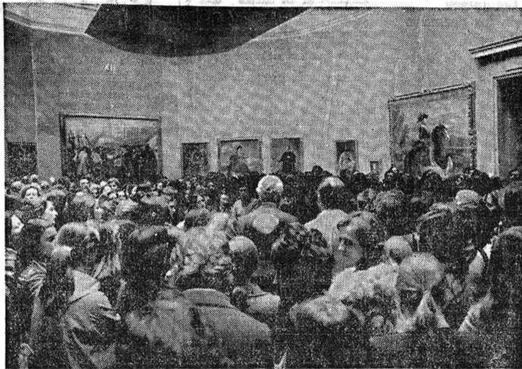
MADRID.—Aspecto de una de las salas del Museo del Prado dedicadas a Velázquez durante el encierro de unos trescientos alumnos y profesores de la especialidad de Historia del Arte de la Facultad de Filosofía y Letras de la Universidad de Madrid. Tal determinación tiene por objeto llamar la atención "sobre el error que supone, según sus manifestaciones, la supresión de la asignatura de Historia del Arte de los estudios de Bachillerato".—(Foto Cifra Gráfica)