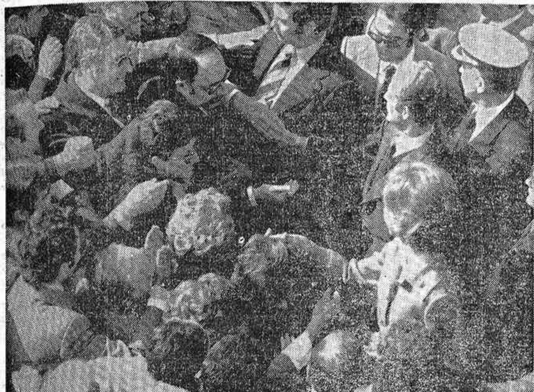
En la fotografía, los Reyes de España, saliendo de todo protocolo, saludan cariñosamente a la gente que les rodeaba durante su visita a Lérida.

Por espacio de seis horas, Don Juan Carlos y Doña Sofía realizaron ayer una visita a Tarragona, cuya población les tributó un caluroso recibimiento. En sus palabras, el Rey afirmó su seguridad de que ganaremos ese futuro mejor que con tanta ilusión buscamos.