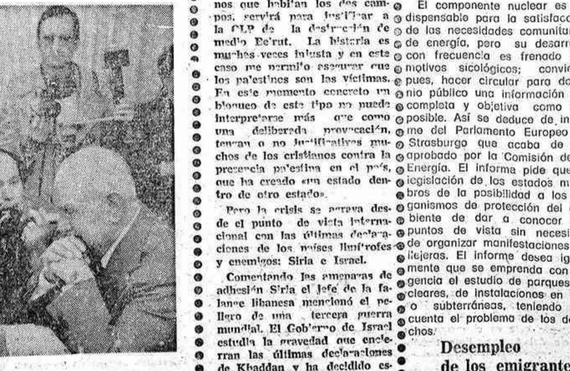
ROMA.—El secretario del Partido Socialista italiano, Francesco De Martino, reunido con los informadores en su despacho, tras la votación de los líderes de los partidos sobre la retirada de apoyo a la minoría gubernamental de Moro, que obligó a éste a presentar la dimisión de su Gabinete.