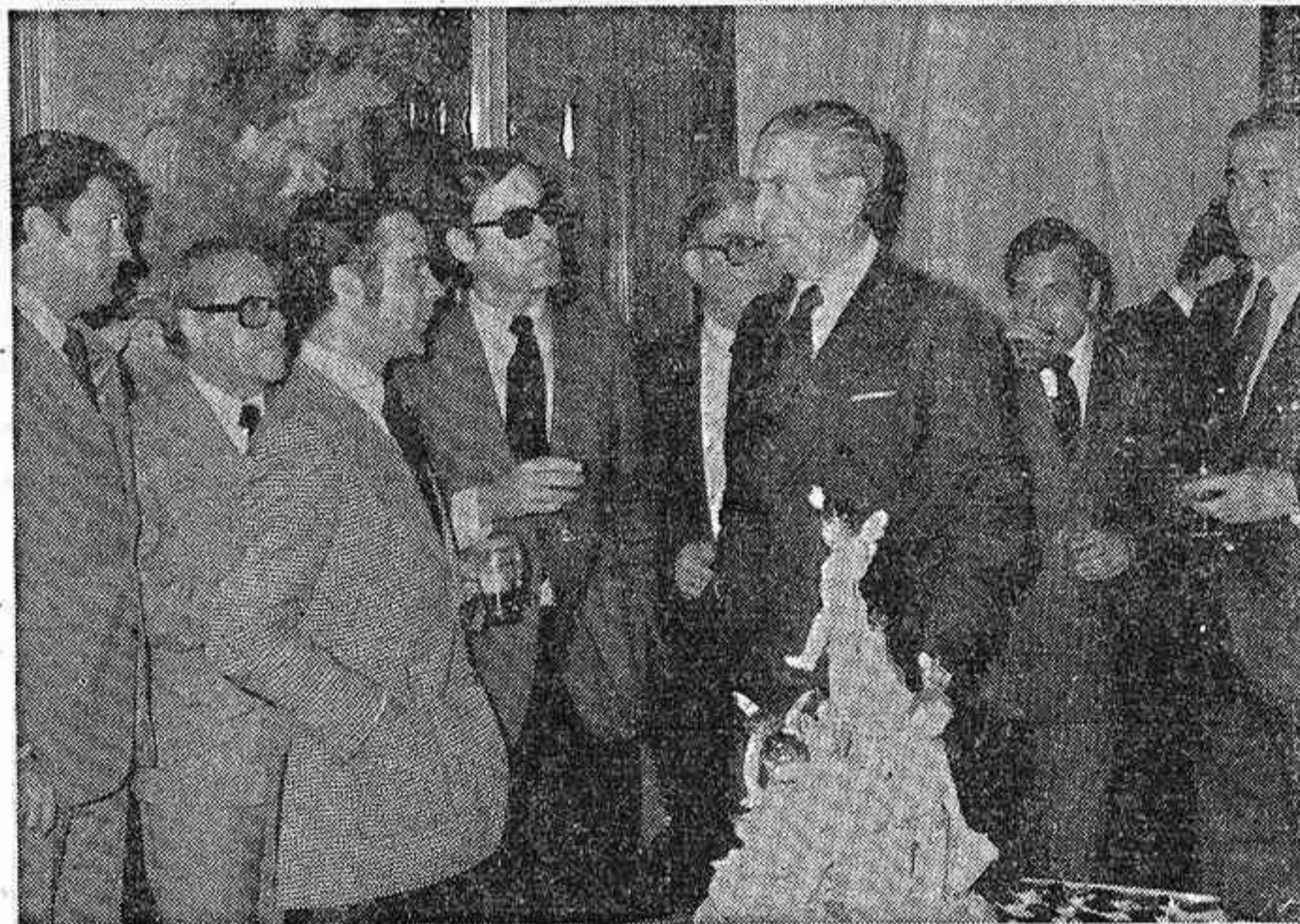
MADRID.—El ministro de Justicia, Antonio Garrigues y Diaz Cañabate, se reunió en su Departamento con los informadores para hacerles patente sus mejores deseos en el año que comienza. En la fotografía, el ministro conversa con un grupo de periodistas.