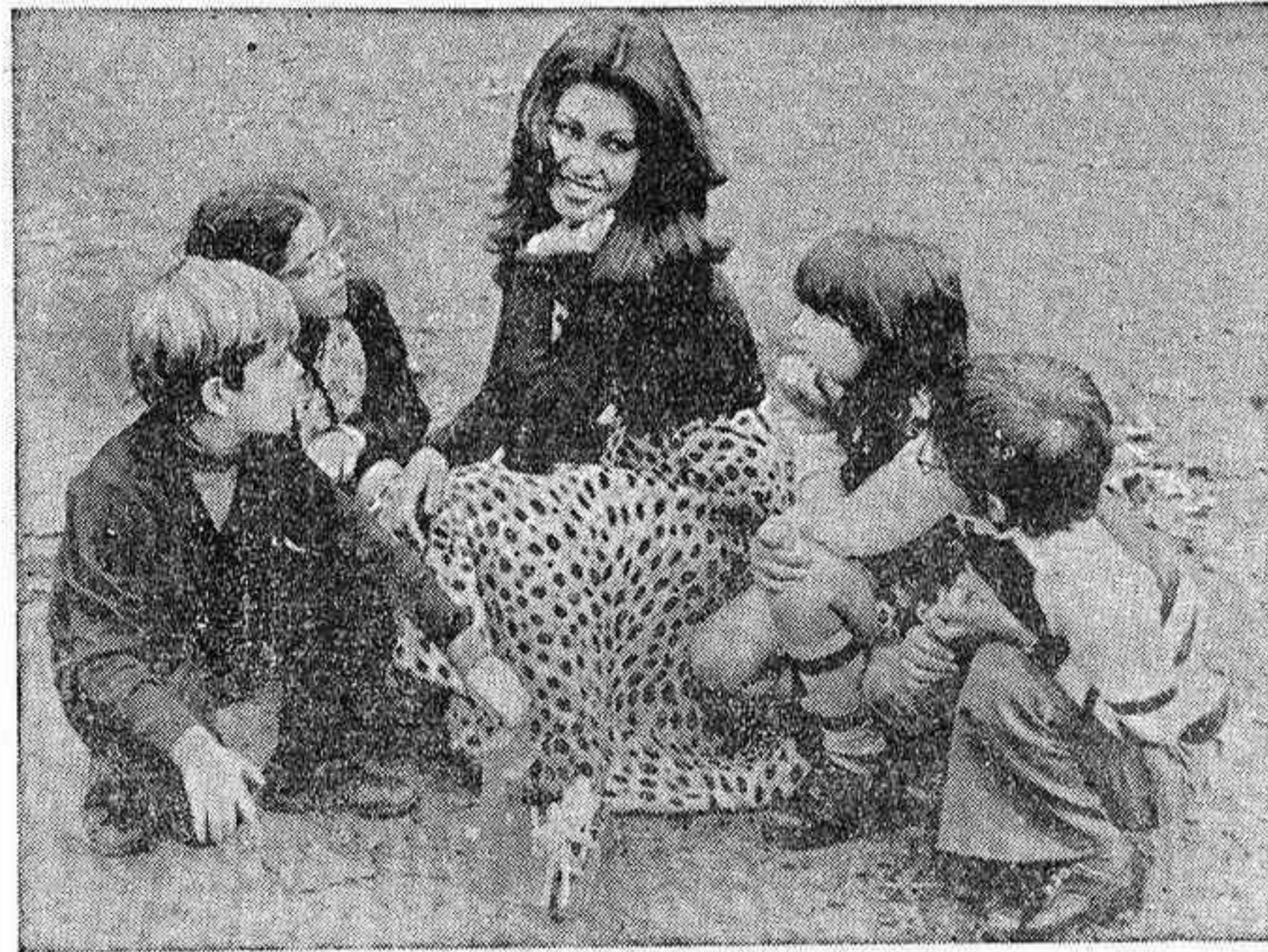
LONDRES.—"Miss Mundo" 1975, Wilnelia Merced, de Puerto Rico (centro), es objeto de la atención de cuatro pequeños londinenses, que dejaron de jugar en el Grosvenor Square, para escuchar lo que les contaba sobre sus viajes desde que fue proclamada "Miss Mundo". Wilnelia se encuentra en Londres en visita al Reino Unido.