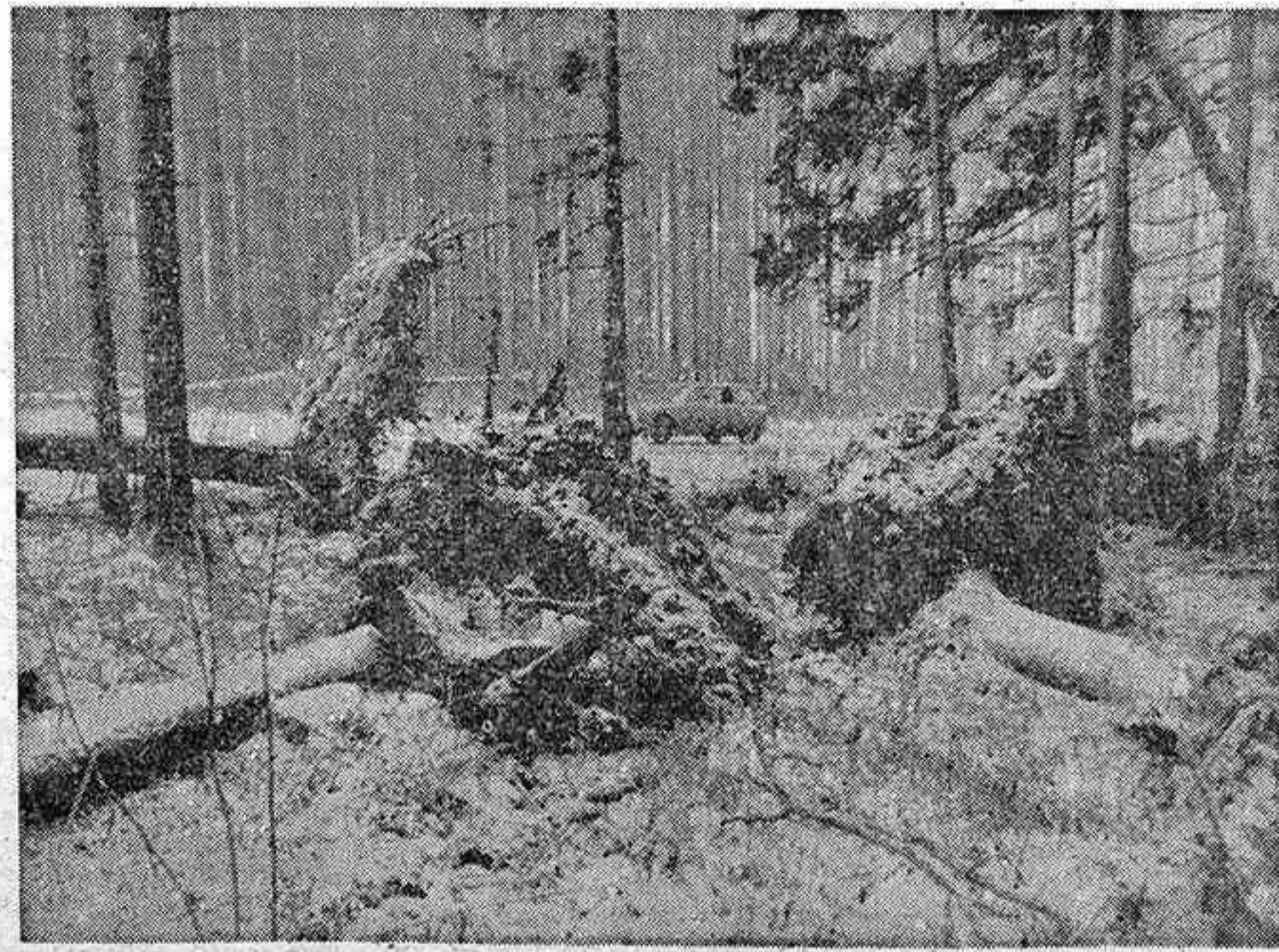
VIENA.—Las autoridades austriacas recopilan informes para determinar los daños causados en el país por los temporales de estos últimos días en Europa, que también alcanzaron a Austria. En la fotografía, gruesos árboles, derribados sobre una carretera del país como consecuencia del vendaval, cuyos vientos superaron, en ocasiones, los 145 kilómetros por hora.