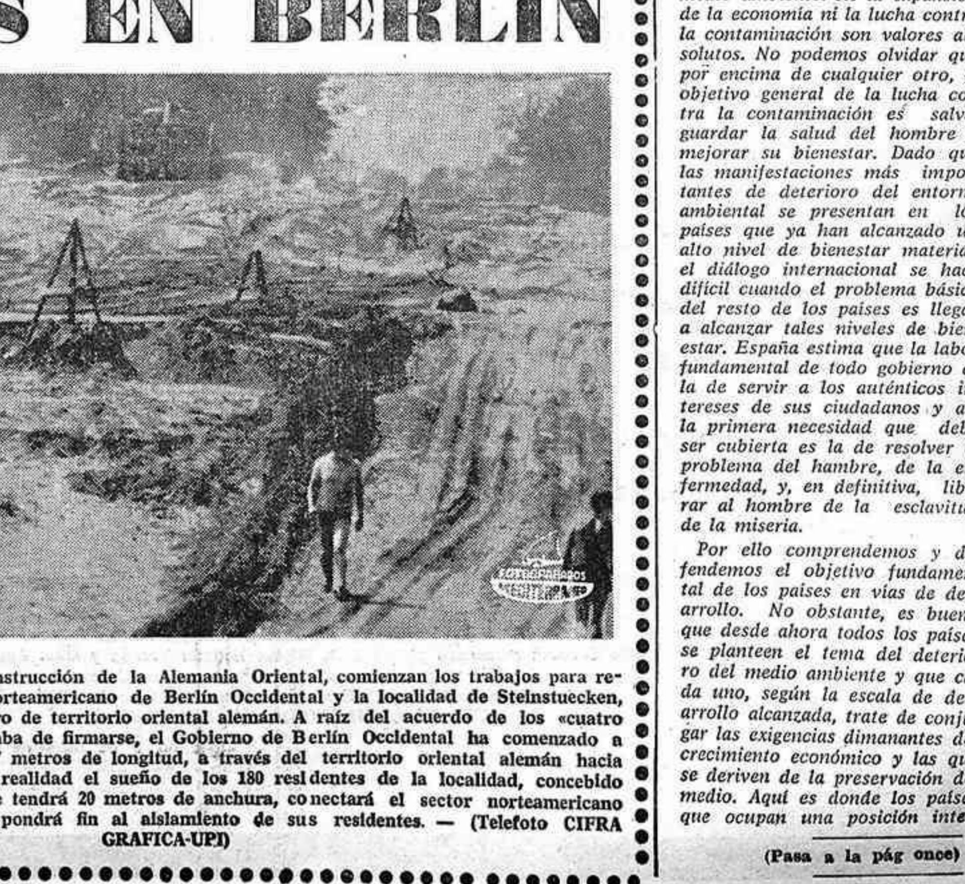
BERLIN. — Obreros de la construcción de la Alemania Oriental, comienzan los trabajos para retirar la valla entre el sector norteamericano de Berlín Occidental y la localidad de Steinstuecken, un enclave de 31'5 acres dentro de territorio oriental alemán. A raíz del acuerdo de los «cuatro grandes» sobre Berlín, que acaba de firmarse, el Gobierno de Berlín Occidental ha comenzado a construir una carretera, de 1.097 metros de longitud, a través del territorio oriental alemán hacia Steinstuecken, convirtiéndolo en realidad el sueño de los 180 residentes de la localidad, concebido hace 27 años. La carretera, que tendrá 20 metros de anchura, conectará el sector norteamericano de Berlín con Steinstuecken y pondrá fin al aislamiento de sus residentes.