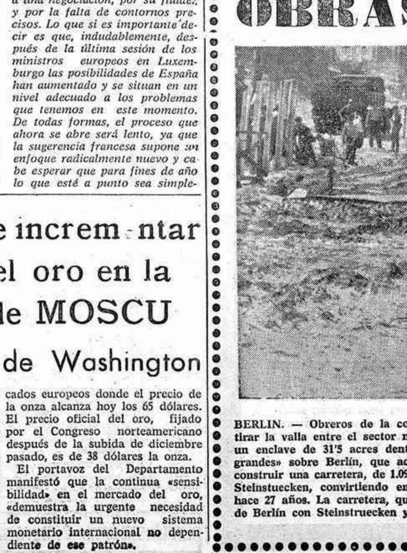
BERLIN. — Obreros de la construcción de la Alemania Oriental, comienzan los trabajos para retirar la valla entre el sector norteamericano de Berlín Occidental y la localidad de Steinstuecken, un enclave de 31'5 acres dentro de territorio oriental alemán. A raíz del acuerdo de los «cuatro grandes» sobre Berlín, que acaba de firmarse, el Gobierno de Berlín Occidental ha comenzado a construir una carretera, de 1.097 metros de longitud, a través del territorio oriental alemán hacia Steinstuecken, convirtiéndolo en realidad el sueño de los 180 residentes de la localidad, concebido hace 27 años. La carretera, que tendrá 20 metros de anchura, conectará el sector norteamericano de Berlín con Steinstuecken y pondrá fin al aislamiento de sus residentes. — (Telefoto CIFRA GRAFICA-UPFI)