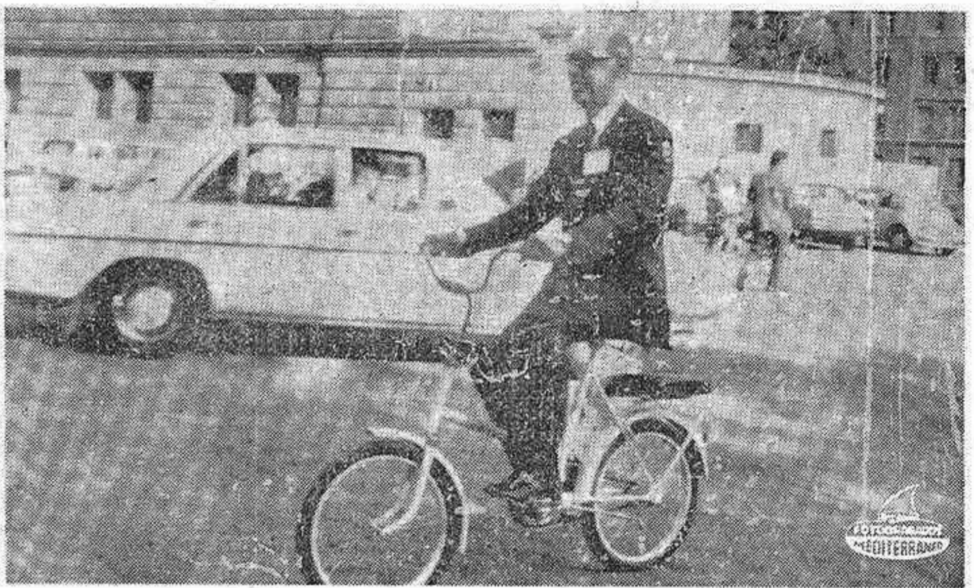
ESTOCOLMO. — El Ministro Comisario del Plan de Desarrollo, D. Laureano López Rodó, que asiste a la conferencia Internacional del Medio Ambiente que se celebra en esta ciudad, aparece en la foto trasladándose al Salón de reuniones en una de las 750 bicicletas puestas a disposición de los delegados de dicha Conferencia, como medio de traslado anticontaminación.

Importante intervención del ministro Comisario español del Plan de Desarrollo en la Conferencia del Medio Ambiente