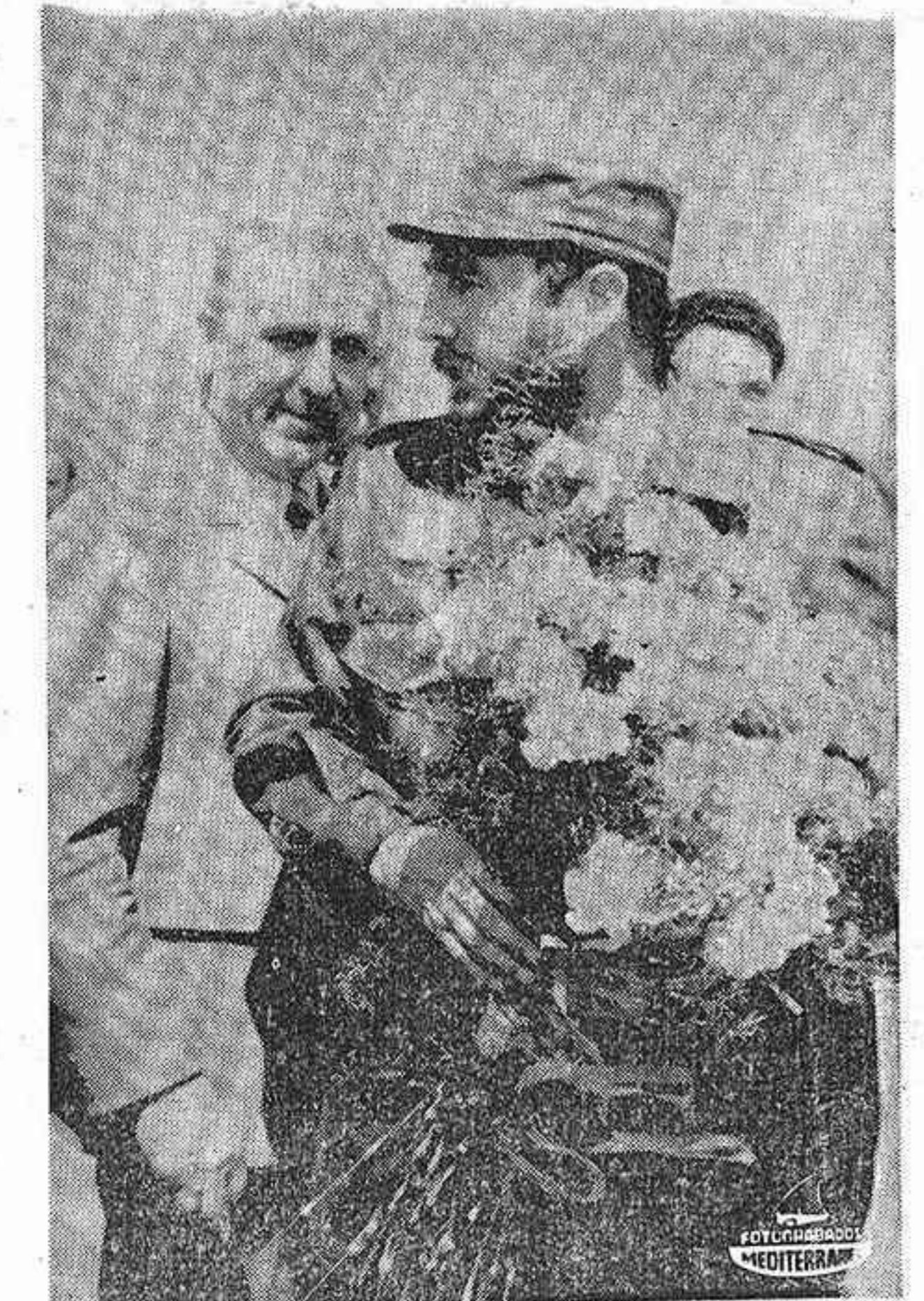
VARSOVIA. — El jefe del Gobierno cubano, Fidel Castro, llegado a esta capital, en visita oficial, aparece en la foto con un gran ramo de claveles. Detrás de él, Edward Gierck, dirigente del partido comunista polaco, que acudió a recibirle al aeropuerto.

El propio presidente cubano desmiente la noticia de que haya sufrido un ataque cardíaco