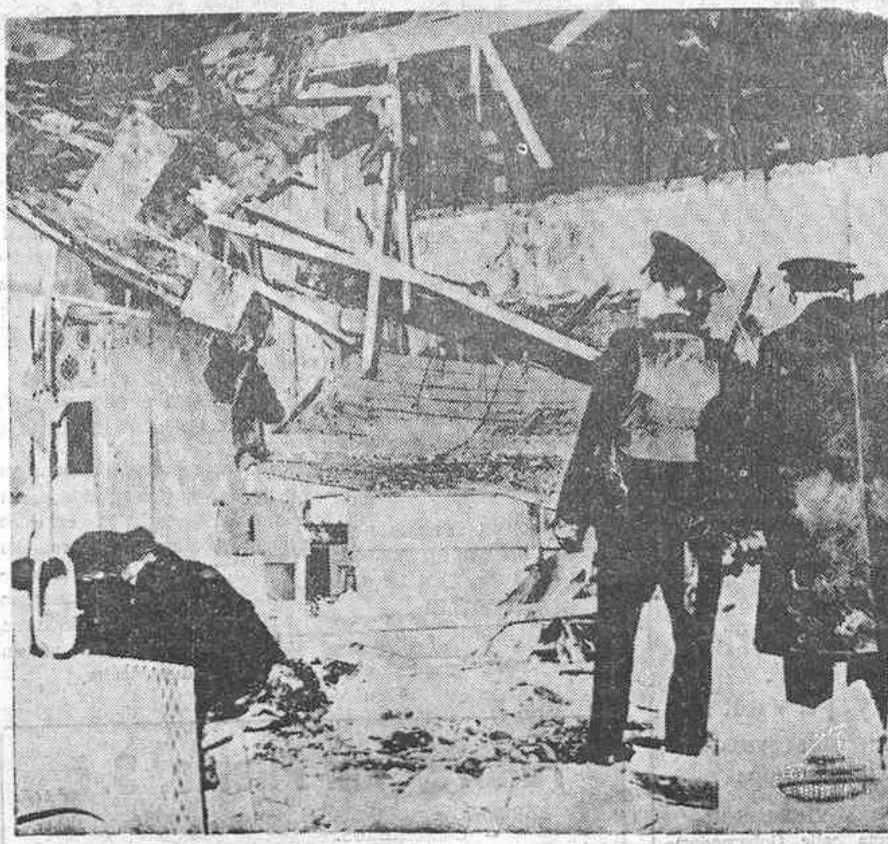
BELFAST. — Agentes de policía contemplan los daños ocasionados por la explosión de una bomba en un bar de la localidad de Moy. Dos personas resultaron muertas y tres sufrieron heridas.