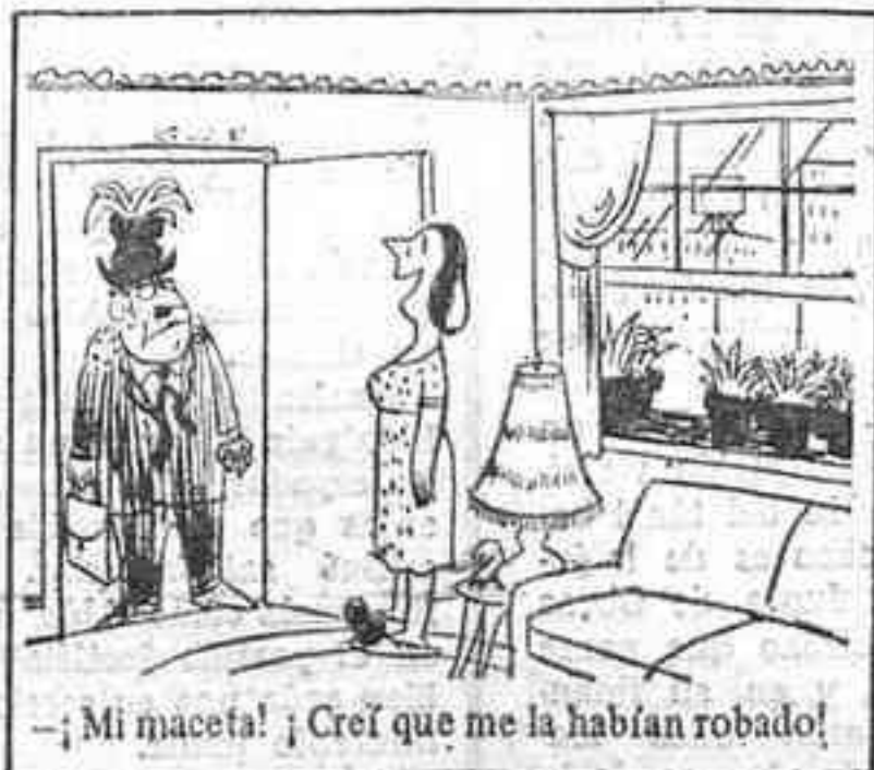
— ¡Mi maceta! ¡ Creí que me la habían robado!