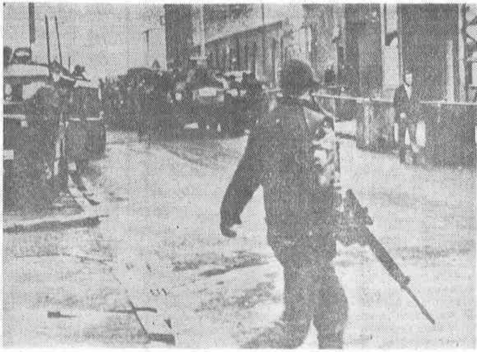
BELFAST. — Un convoy de carros armados lleva 48 presos al tribunal de Belfast. Los prisioneros son acusados de delitos que van desde asesinato a la posesión de armas y explosivos. El ejército tuvo que transportarlos debido a la negativa de la policía del Ulster, por haber sido acusado uno de sus miembros de golpear a un prisionero mientras era interrogado.