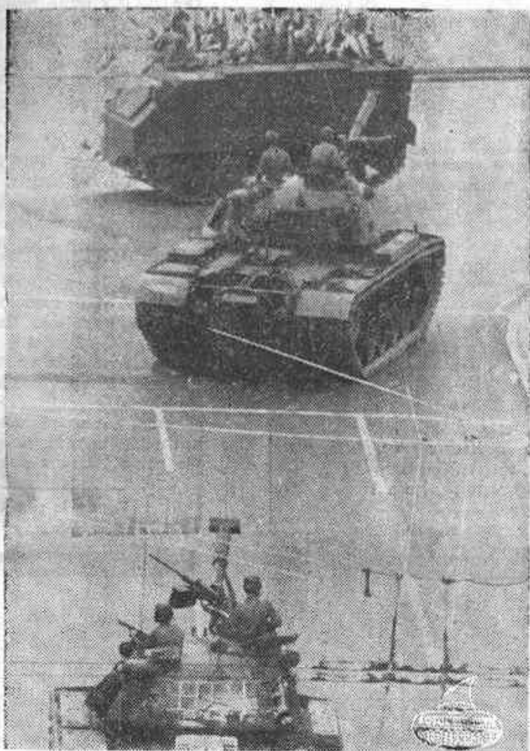
ROMA, 26. (Del corresponsal de Pyresa, Alejandro Pistolesi). — Las primeras noticias de testigos directos del golpe de Estado en Grecia llegaron a la capital italiana con el vuelo «Olympic 233», procedente de Atenas.

Según parece, los promotores del golpe militar «son los elementos más puros e idealistas de la revolución de 1967»