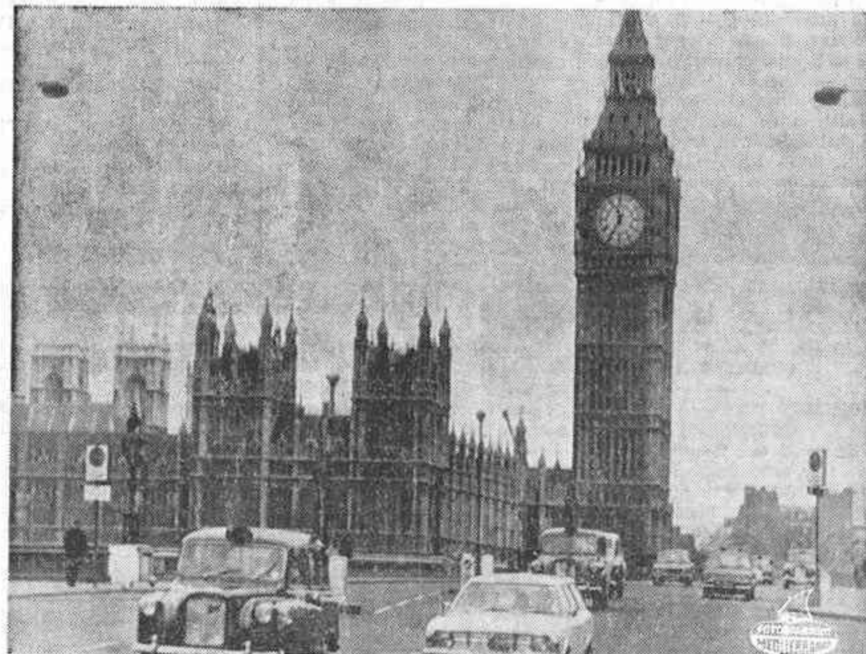
LONDRES. — Los británicos, en gran número, han obedecido la petición del Gobierno de reducir el tránsito de vehículos rodados en domingo. La Asociación del Automóvil ha informado que el tráfico ha sido más reducido que lo normal. La foto fue captada en la mañana de hoy domingo, en el puente de Westminster.