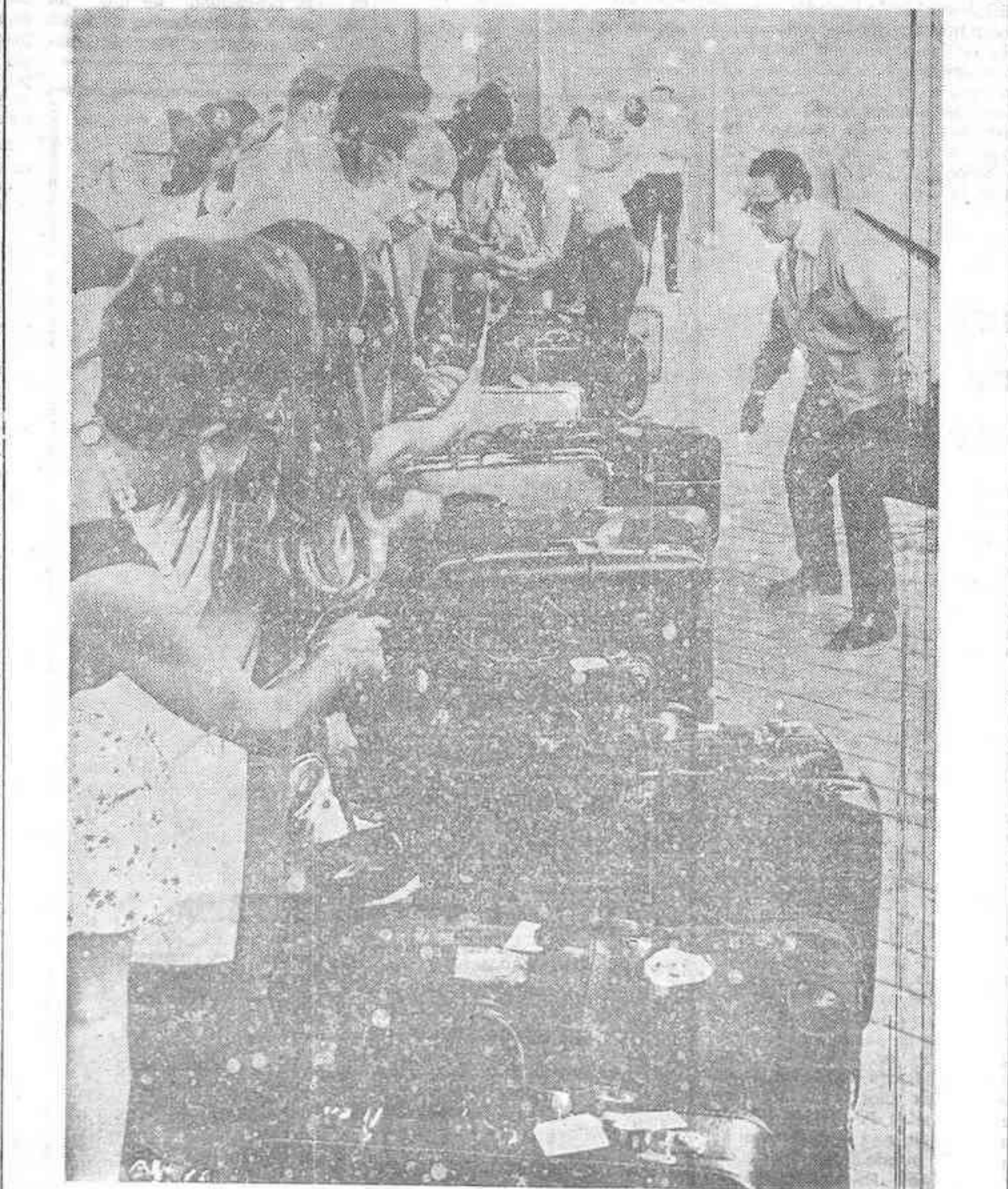
MADRID. — La operación retorno se halla en pleno apogeo. La presente foto fue captada en la estación de Chamartín, a la llegada de uno de los numerosos trenes procedentes del Norte.