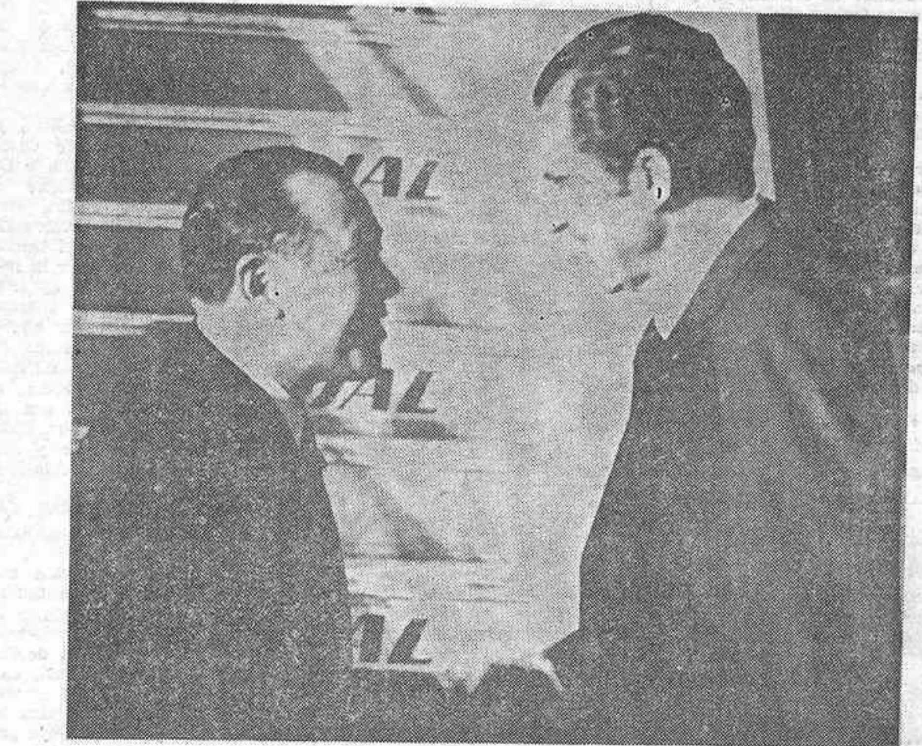
HONOLULU. — El primer ministro del Japón, Kakuei Tanaka, estrecha la mano del presidente Nixon, poco después de su llegada a las islas para celebrar una importante entrevista