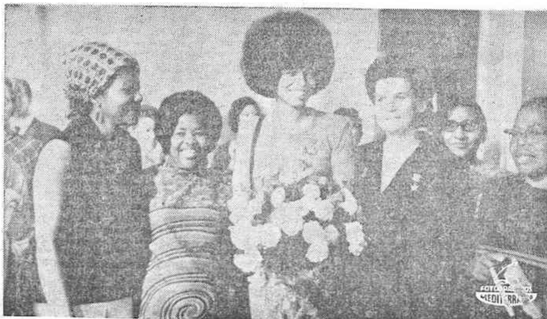
MOSCU. — Angela Davis junto a la cosmonauta Valentina Tereshkova (2.ª a la dcha), aparece junto a un grupo de componentes del Seminario Femenino Internacional dedicado a la celebración del 50 Aniversario de la fundación de la URSS.