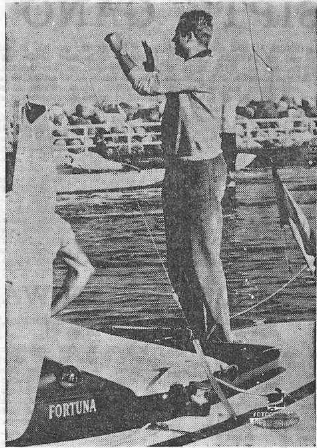
KIEL. — El Príncipe de España D. Juan Carlos de Borbón, a bordo de su yate «Fortuna».

La batalla era doble, pues había en juego no sólo la honrilla deportiva, sino la profesional del danés. Sobre la baliza, Elvstroem consiguió alcanzar a Balcells. En la empogada trató nuestro compatriota de metérselo por dentro,