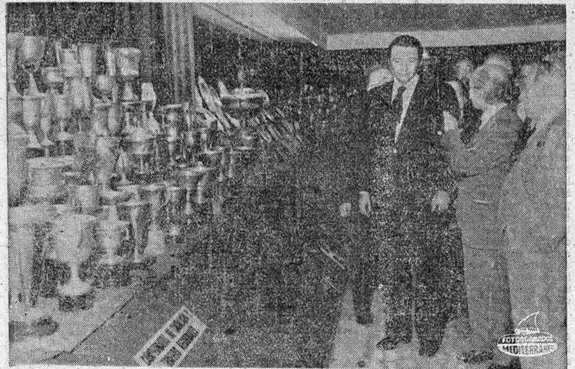
BARCELONA. — Con motivo del 75 aniversario de la fundación del F. C. Barcelona ha sido inaugurada en la Ciudad Condal la Gran Exposición de los Trofeos ganados por el equipo. En la foto el presidente del Club Sr. Montal durante la inauguración.