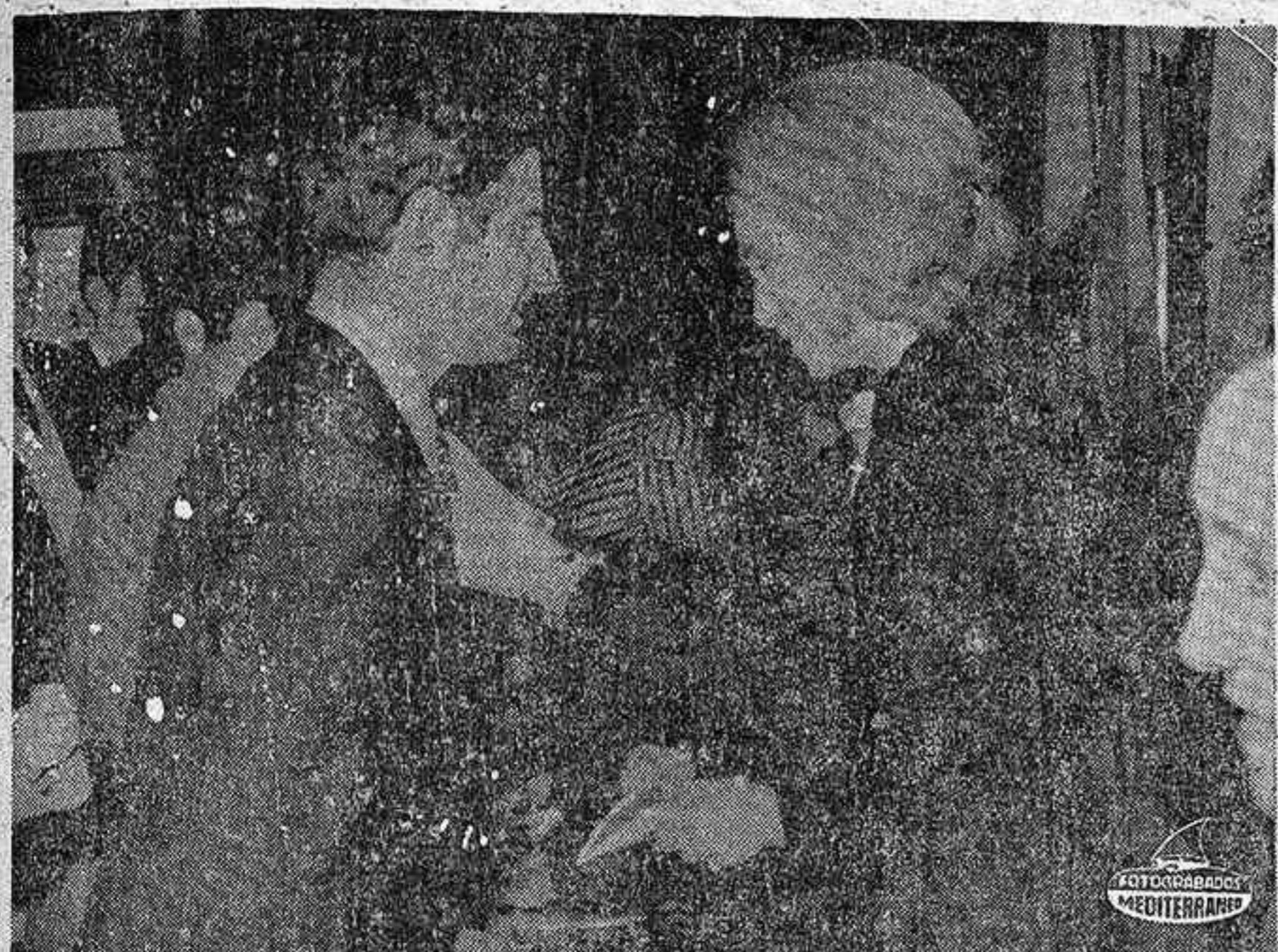
MADRID. — Madrid ha celebrado la tradicional Fiesta de la Banderita, cuarteción anual en favor de la Cruz Roja Española. En la foto la Princesa de España, doña Sofía que presidió una mesa petitoria instalada en la avenida de José Antonio recibe el donativo del Duque de Huescar.