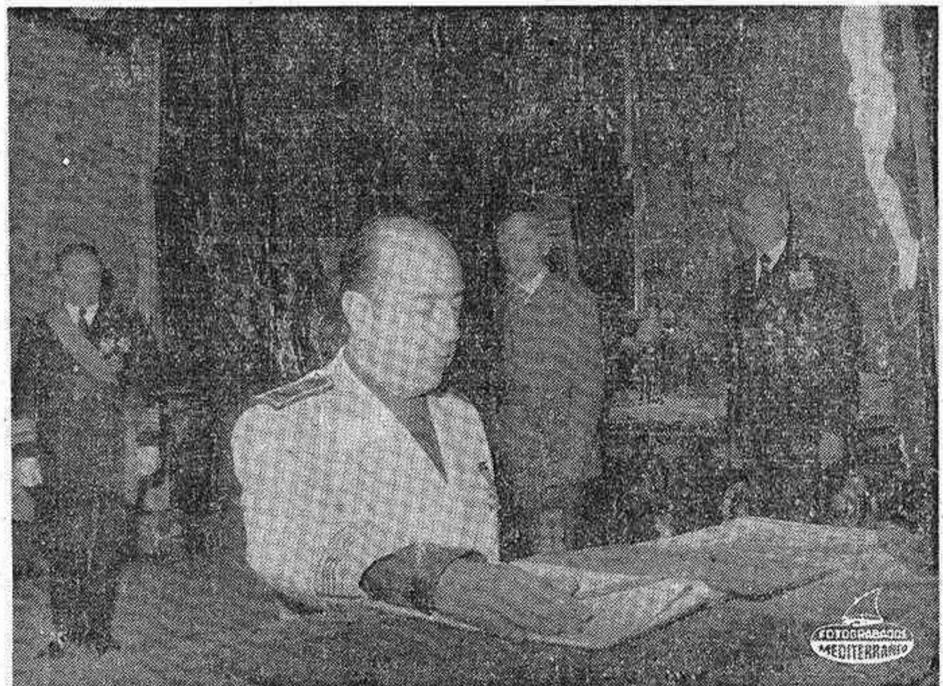
MADRID. — El Ministro Secretario General del Movimiento al jurar su cargo de Consejero Nacional anteayer en el Palacio de El Pardo. — (Foto Cifra Gráfica).