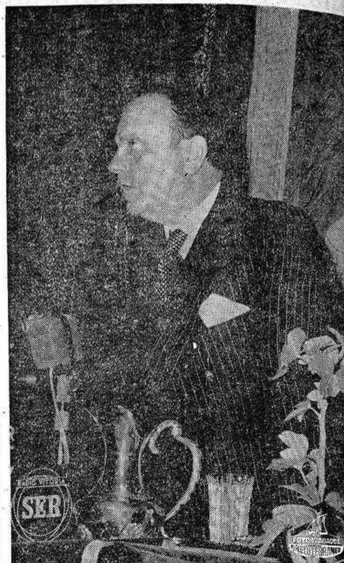
VITORIA. — Los actos conmemorativos del centenario del nacimiento de Ramiro de Maeztu culminaron con la colocación de la primera piedra de una fuente luminosa monumental y una conferencia de D. Manuel Fraga Iribarne sobre el tema «Ramiro de Maeztu y el pensamiento político británico». El embajador de España en Londres, don Manuel Fraga Iribarne, durante la conferencia que pronunció en Vitoria con motivo de los actos conmemorativos del centenario del nacimiento de Ramiro de Maeztu.