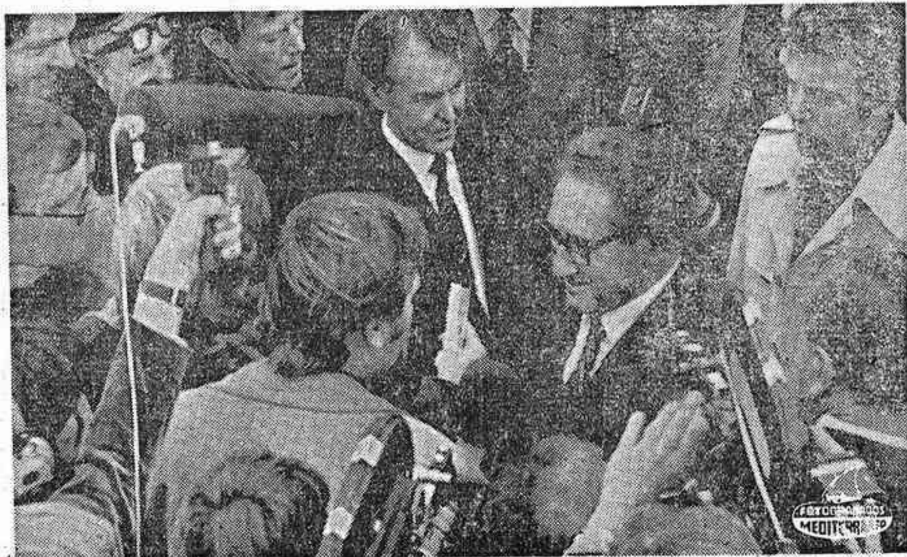
COPENHAGUE. — El secretario norteamericano de Estado, Henry Kissinger, es rodeado por los periodistas en el aeropuerto de Copenhague donde hizo escala de hora y media en ruta a Moscú. Junto a él, el ministro danés de Asuntos Exteriores, Ove Guldberg.

Tres horas permaneció reunido con Breznev