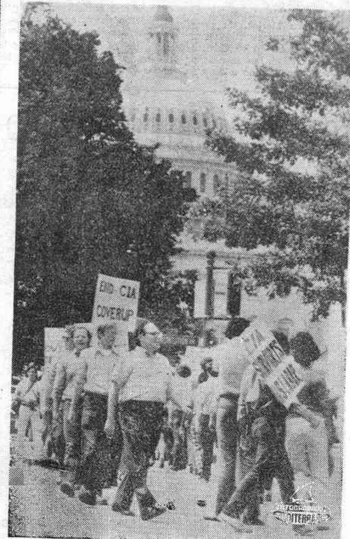
WASHINGTON, 8.—Una manifestación de protesta contra las actividades de la C.I.A., desfiló ante el Capitolio.