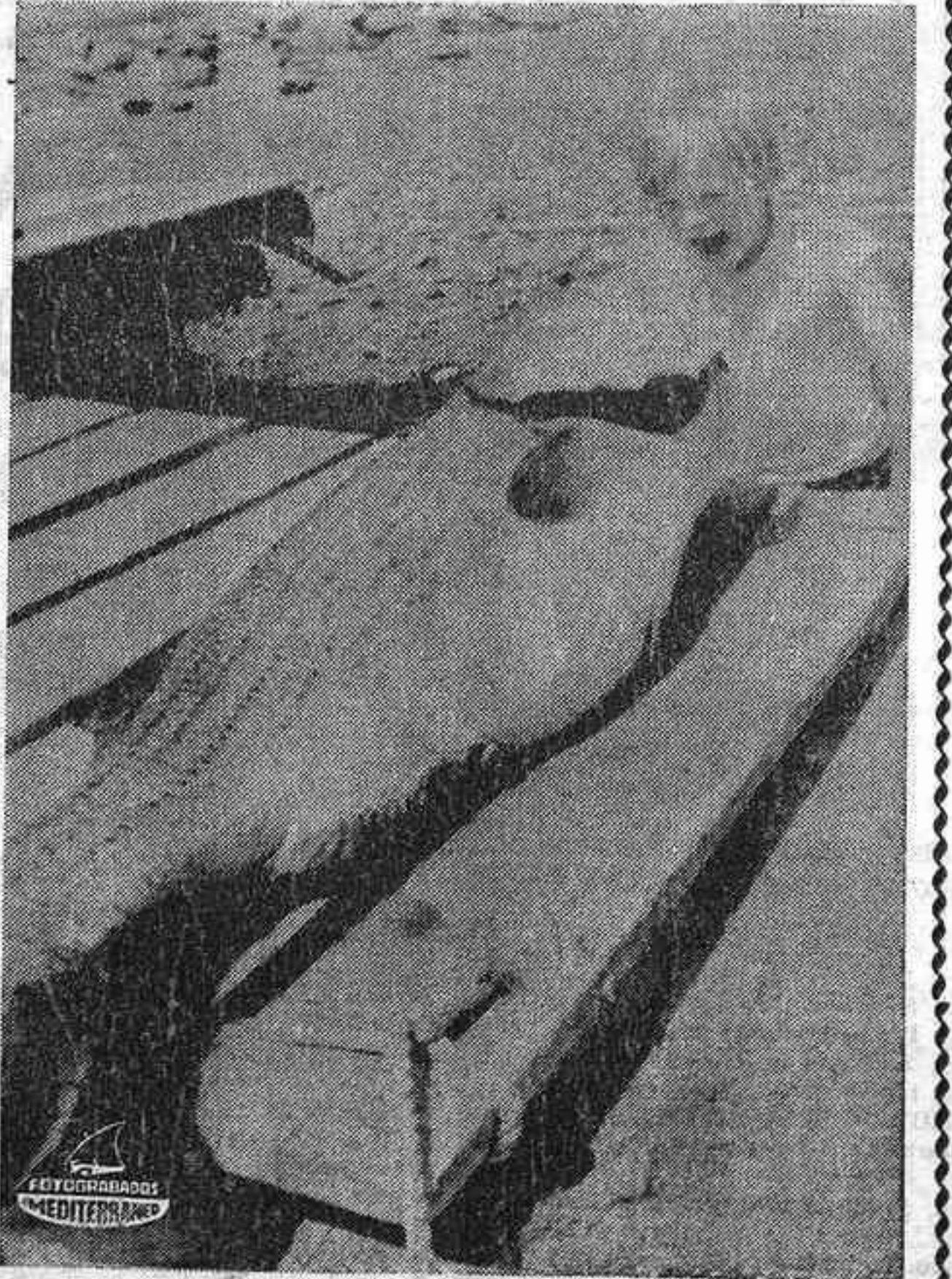
QUINCY (Massachusetts). —Clen Ryan, se entusiasma ante la magnífica captura realizada por su padre, y que viene a resolver algo la escasez de carne. Se trata de una lubina de 25 kilos, pescada en estas aguas.