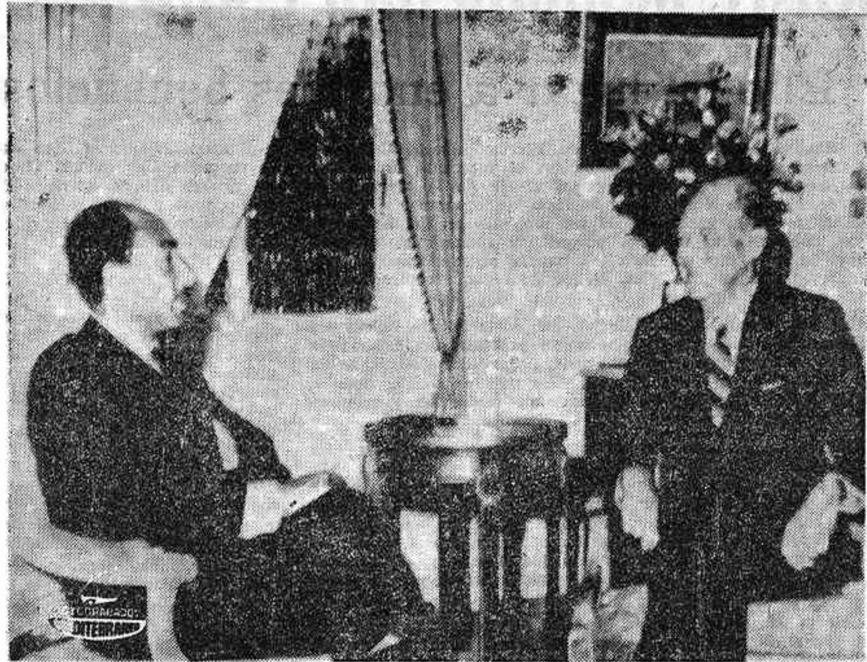
GIZA (Egipto). — El Secretario norteamericano de Estado, William Rogers, derecha y el Presidente de la RAU, Anwar Sadat, durante su entrevista en casa del Presidente de Egipto.