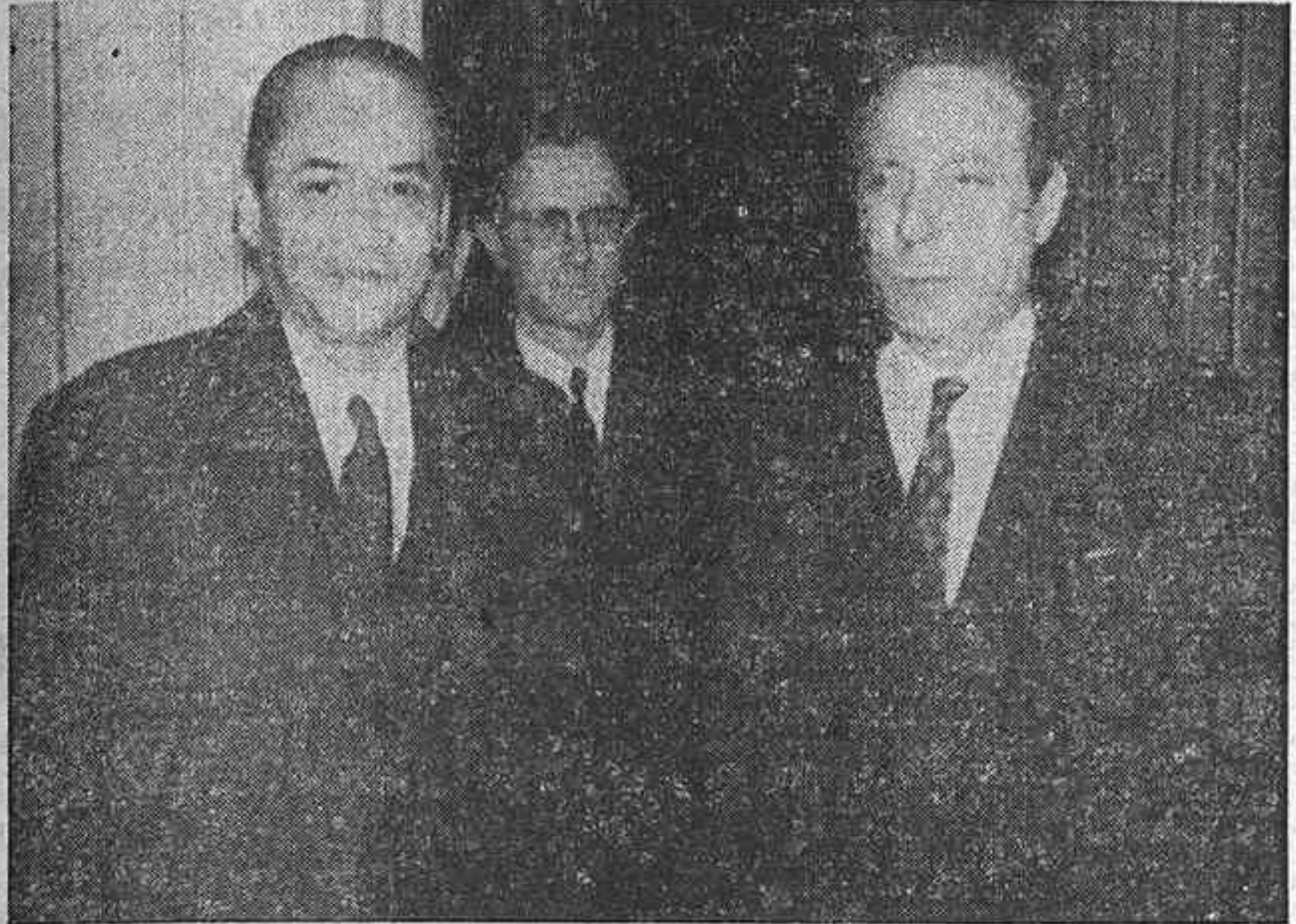
PARIS. El embajador de Vietnam del Sur, Pham Dang Lam (izquierda), jefe de la delegación de su país en París, fotografiado con el ministro de Asuntos Exteriores francés, Michel Debré (a la derecha), a la salida de la conferencia celebrada como consecuencia de haber sido llamado el representante vietnamita por el titular del Quai d'Orsay, Ministerio de Asuntos Exteriores de Francia.

Para el F.N.L. «los americanos no quieren aún sinceramente solucionar el problema del Vietnam»