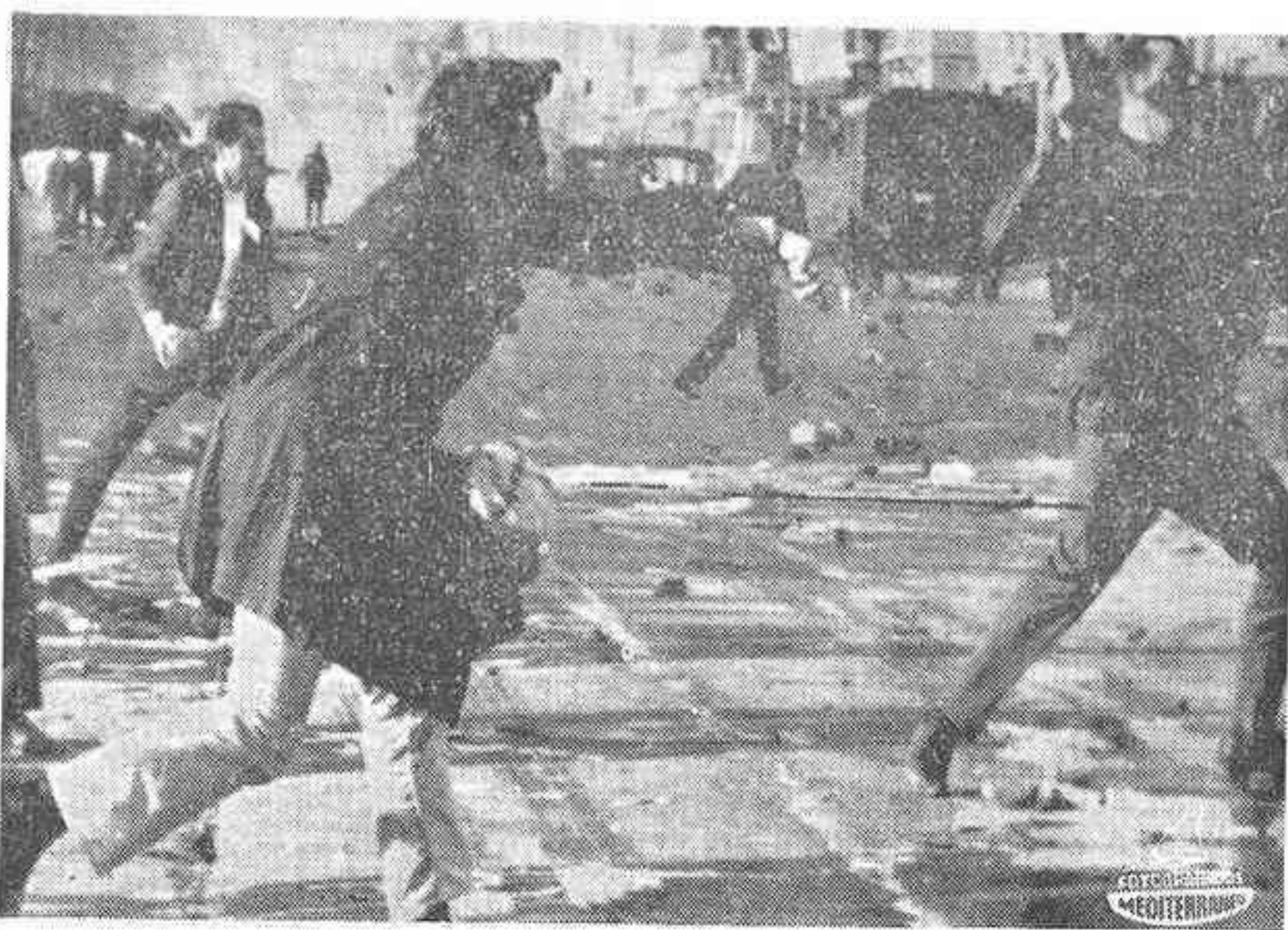
BRUSELAS. — Al final de la manifestación de agricultores europeos se registraron actos de violencia al hacer los manifestantes frente a las fuerzas de la autoridad con piedras e insultos y provocar algunos incendios en automóviles aparcados en la vía pública y otros desmanes. En la foto, unos manifestantes arrojando piedras a las fuerzas del orden.