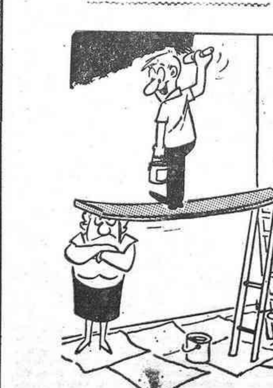
—¡No puedes imaginarte, querida mamá política, cuánto nos alegran tus visitas!