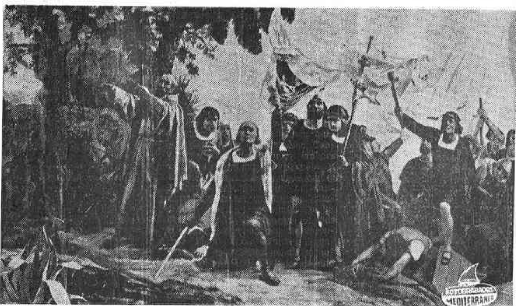
La fotografía reproduce el famoso cuadro de Puebla mostrando a Cristóbal Colón en el momento de pisar tierra en la isla de San Salvador. Pero llegó Colón allí gracias a los mapas de Piri Reis, dibujados cientos o miles de años antes?