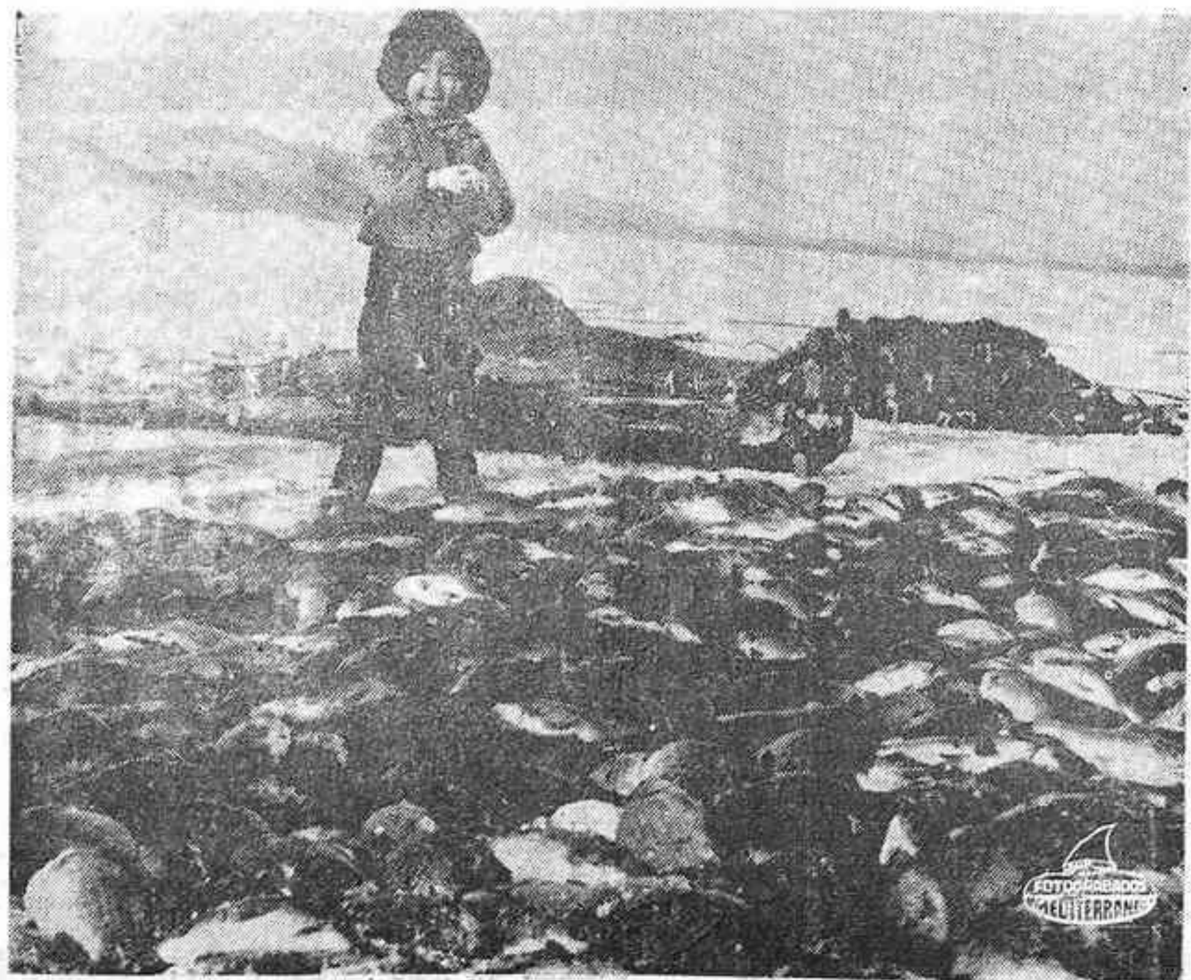
MOSCU. — Este pequeño Uchil, pescador por herencia, sonríe después de una fabulosa pesca. El pequeño vive con sus padres a lo largo del río Amur, fronterizo con Rusia y la China roja.

Escójala la funda que desee para TAPIZAR SU COCHE en 20 minutos la colocaremos Avda. Rey D. Jaime, 98 (Frente Instituto). Telf. 216452