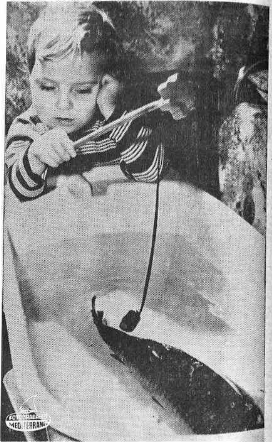
PRAGA (Checoslovaquia). — Nadie sabe cómo el pequeño de la foto consiguió la carpa real, con la que juega en la bañera de su casa, pero la realidad es que el niño disfruta de lo lindo. Su madre aprovecha la oportunidad que le ofrece el pequeño para realizar las labores cotidianas de toda ama de casa, sin la molestia que le supondría el hecho de que su hijo no tuviera tan buen entretenimiento.