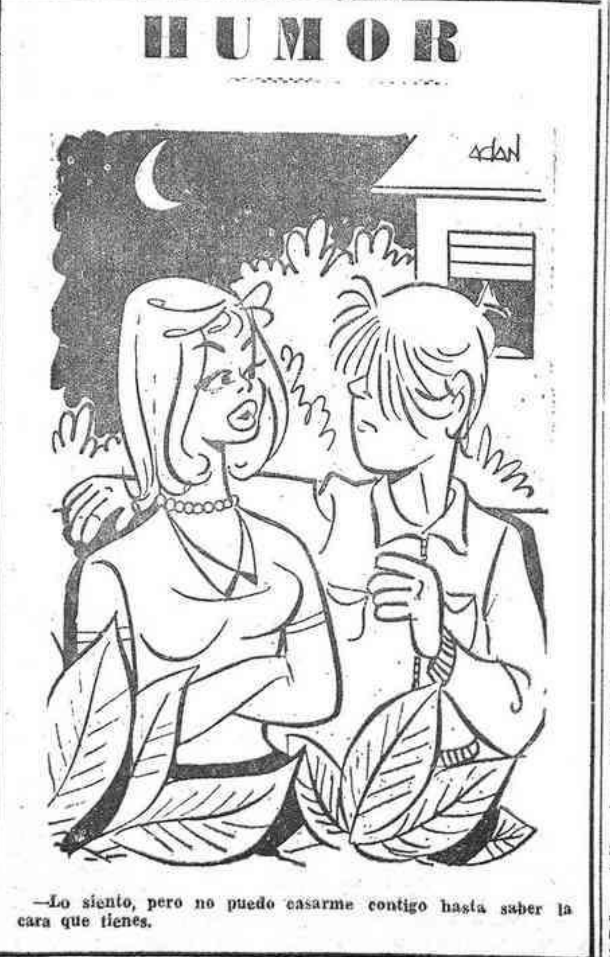
—Lo siento, pero no puedo casarme contigo hasta saber la cara que tienes.

LISBOA, 11 (Efe). — Vila Real de Santo Antonio, municipio turístico de la provincia de Algarve, cerca de la frontera con España, ha decidido prohibir toda clase de publicidad sobre el tabaco, a partir del día uno del próximo mes de febrero. Esta decisión es única, en su clase, en Portugal y fue adoptada en el curso de una reunión de las concejalías de la ciudad por unanimidad.